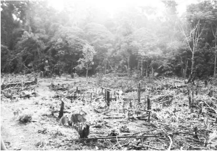
Camino hacia la comunidad El Calderón, Amazonas.

Pueden entrecruzarse así los múltiples orígenes de la destrucción de los ecosistemas amazónicos, especialmente por la explotación petrolera, minera y maderera en Putumayo. Indiquemos que la industria petrolera se estableció en el departamento de Putumayo desde 1943, momento en que la explotación de hidrocarburos fue dada en concesión a la Texas Petroleum Company hasta 1987 cuando la Empresa Colombiana de Petróleos inició la actividad exploratoria. A lo largo de este periodo y actualmente los principales efectos ambientales en Putumayo están relacionados con la deforestación, las áreas degradadas por la intervención humana, la contaminación con desechos de los ríos San Juan, San Vicente, Putumayo y Juanambú, la muerte de especies acuáticas y la pérdida de vegetación en sus riberas. 20