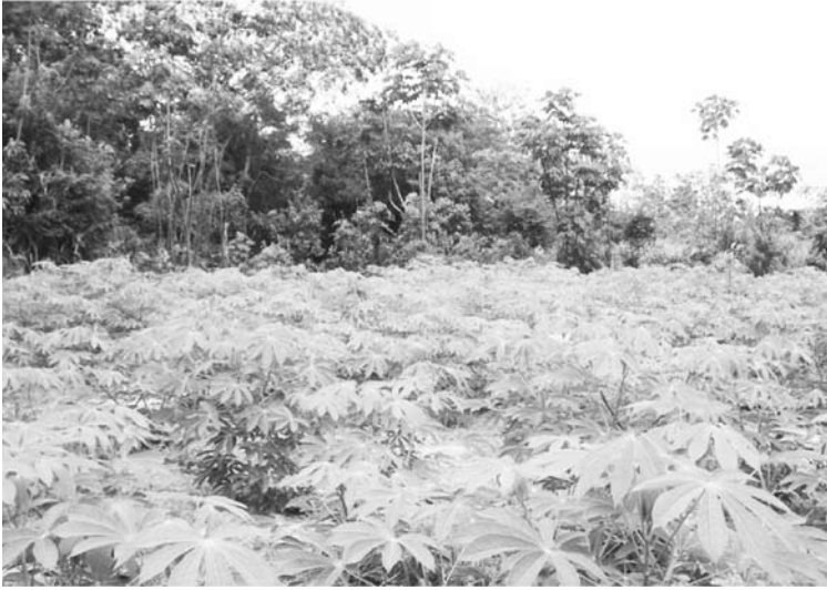
Chagra cultivada con yuca dulce. Vista a la comunidad indígena de Arara.

fuelle de comunicación y alimento físico y espiritual, de los hijos del tabaco y la yuca dulce.