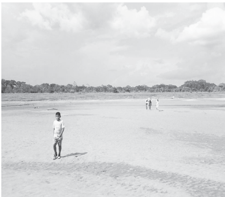
Costado río Amazonas, camino a la comunidad indígena El Progreso.

Los conflictos en los que es posible entrever un mismo patrón: la destrucción del sistema boscoso más grande del mundo y la violación de los derechos humanos y de la naturaleza. Si para finales del siglo XIX era la explotación y comercialización del caucho, hacia los años cuarenta la extracción petrolera, para 1960 fue la explotación maderera y para los años noventa fue la deforestación para el cultivo de hoja de coca. En la actualidad es la explotación de la flora y fauna como un todo comercializable. Es el ecosistema entero el que es objeto de extracción.