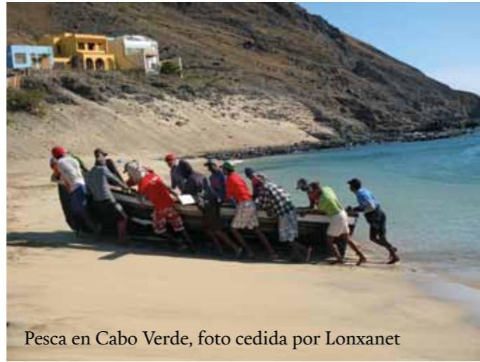
Pesca en Cabo Verde

revolución y la subsiguiente pérdida de control de las actividades del sector.