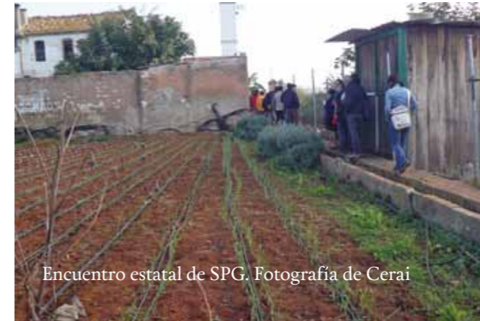
Encuentro estatal de SPG.

En este marco, y fruto de ese diálogo permanente, se toman decisiones y se van diseñando y construyendo poco a poco los pilares, la estructura y las tareas del SPG; un edificio que no es rígido, que debe estar dispuesto a ir modificándose y ser como un organismo que va creciendo y