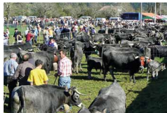
Vacas tudancas. Suso Garzón

Por otro lado, tal y como nos relata el militante ecologista: «Algunos ganaderos pueden haber pensado que iban a recibir menores cuantías tras las últimas reformas y que la única solución residía en aprovechar este periodo de altas temperaturas y escasas lluvias para aumentar sus superficies de pasto y conservar o incrementar las subvenciones». José Manuel Lago, del Consejo del Fuego en Asturias, asegura que hay muchas sospechas que apuntan a estas políticas como causa principal de los incendios ya que, «aunque