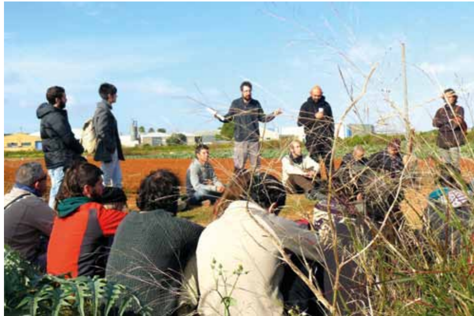
Encuentro estatal de SPG. Fotografía de Cerai

el de la especialización y los interminables eslabones (de hecho, vemos cada vez más estos sellos en marcas multinacionales que lanzan «líneas ecológicas»). Sus burocracias pesan y, a menudo, no se adaptan a las formas de producción agroecológicas, que, por ejemplo, en la finca manejan una biodiversidad subversiva que no encaja en formularios. También pueden ser muy cuestionables sus criterios, por insuficientes y por no adaptarse a las particularidades de cada circunstancia.