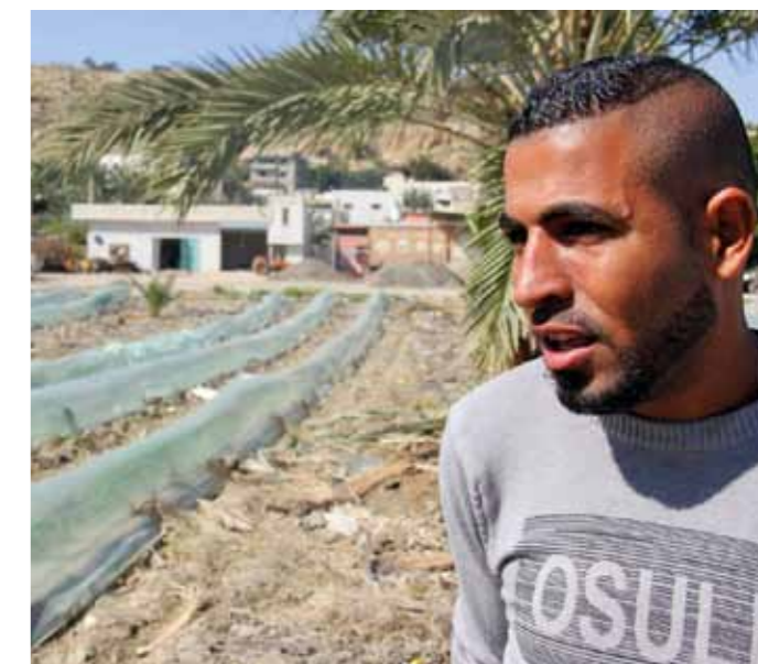
Campeñinos palestinos, foto cedida por La Vía Campesina de Palestina

administrativos injustos en las terminales de exportación reducen la calidad y agregan costes.