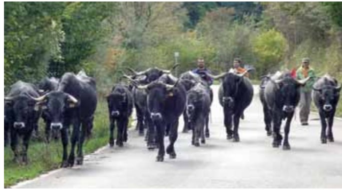
Vacas tudancas. Suso Garzón