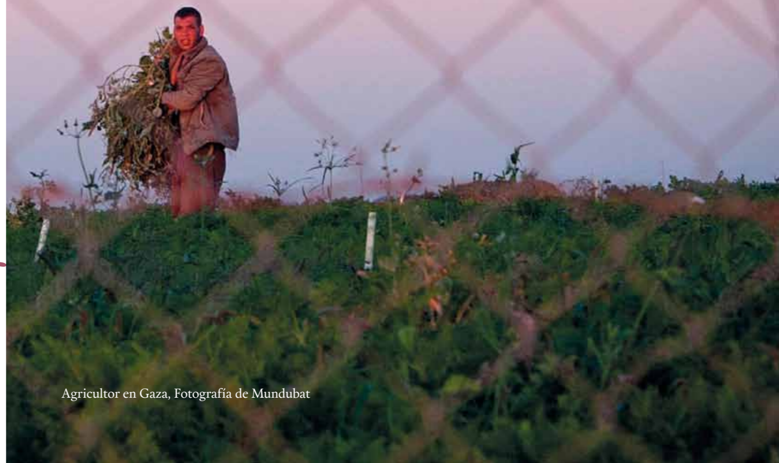
Agricultor en Gaza

«La confiscación de tierra, órdenes de demolición, el muro de separación, los asentamientos, los distintos checkpoints, la prohibición de transitar por ciertas zonas... son prácticas habituales de la ocupación israelí para prohibir el acceso del pueblo palestino a sus tierras. La soberanía alimentaria es uno de los derechos humanos de los que se priva al pueblo palestino y afecta a la mayoría de las personas y a la situación socioeconómica de Palestina en general», afirman desde la La Vía Campesina en Palestina. Para denunciar los incumplimientos de los tratados internacionales por parte del Estado de Israel, vamos a prestar especial atención a la realidad agrícola analizando la cadena que va desde la producción hasta la comercialización.