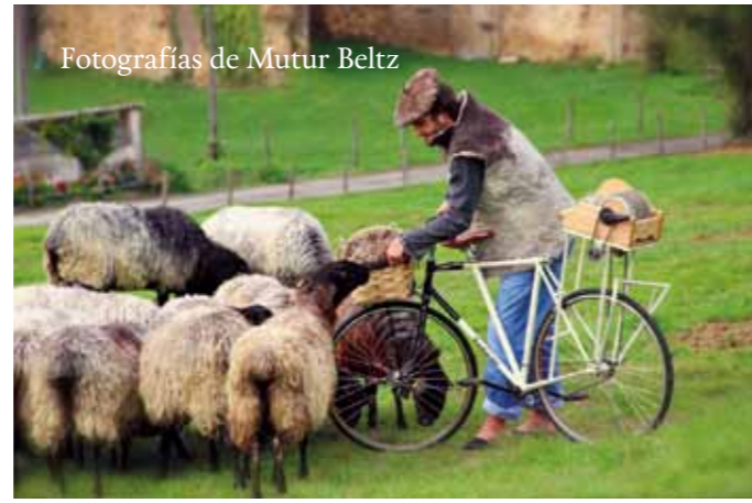
Fotografías de Mutur Beltz