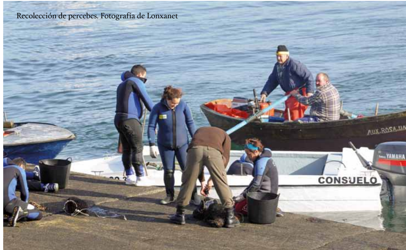
Recolección de percebes.

Tras su aprobación, será el turno del Plan plurianual para la gestión de las pesquerías demersales del mar del Norte (que pescan los peces del fondo del mar), el Plan para la pesca demersal de las aguas occidentales de la UE y otros como el Plan para las especies demersales en el Mediterráneo noroccidental. Este último es de gran trascendencia para las pesquerías del golfo de León.