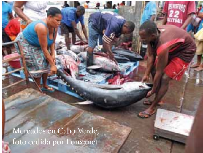
Mercados en Cabo Verde, foto cedida por Lonxanet