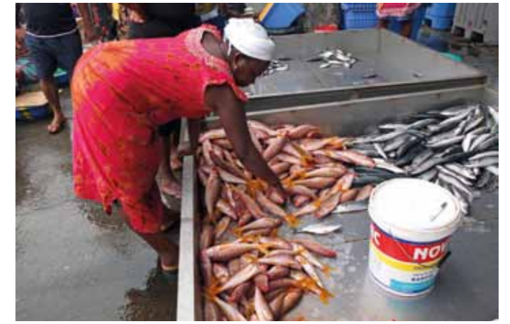
Comunidades pesqueras africanas, Lonxanet