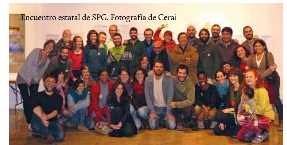
Encuentro estatal de SPG.

Los espacios y las responsabilidades que se generan en un SPG, requieren actitudes que normalmente no hemos aprendido a desarrollar o perfeccionar: escuchar, ceder en nuestros posicionamientos, asumir y manejar nuestros prejuicios, tener empatía... La presencia en el encuentro de algunas compañeras de organizaciones campesinas de Bolivia y su forma de entender el trabajo colectivo sirvió como espejo. En nuestra sociedad tenemos, en general, una enorme falta de educación organizativa, fruto del individualismo. Este es uno de los retos más importantes que se