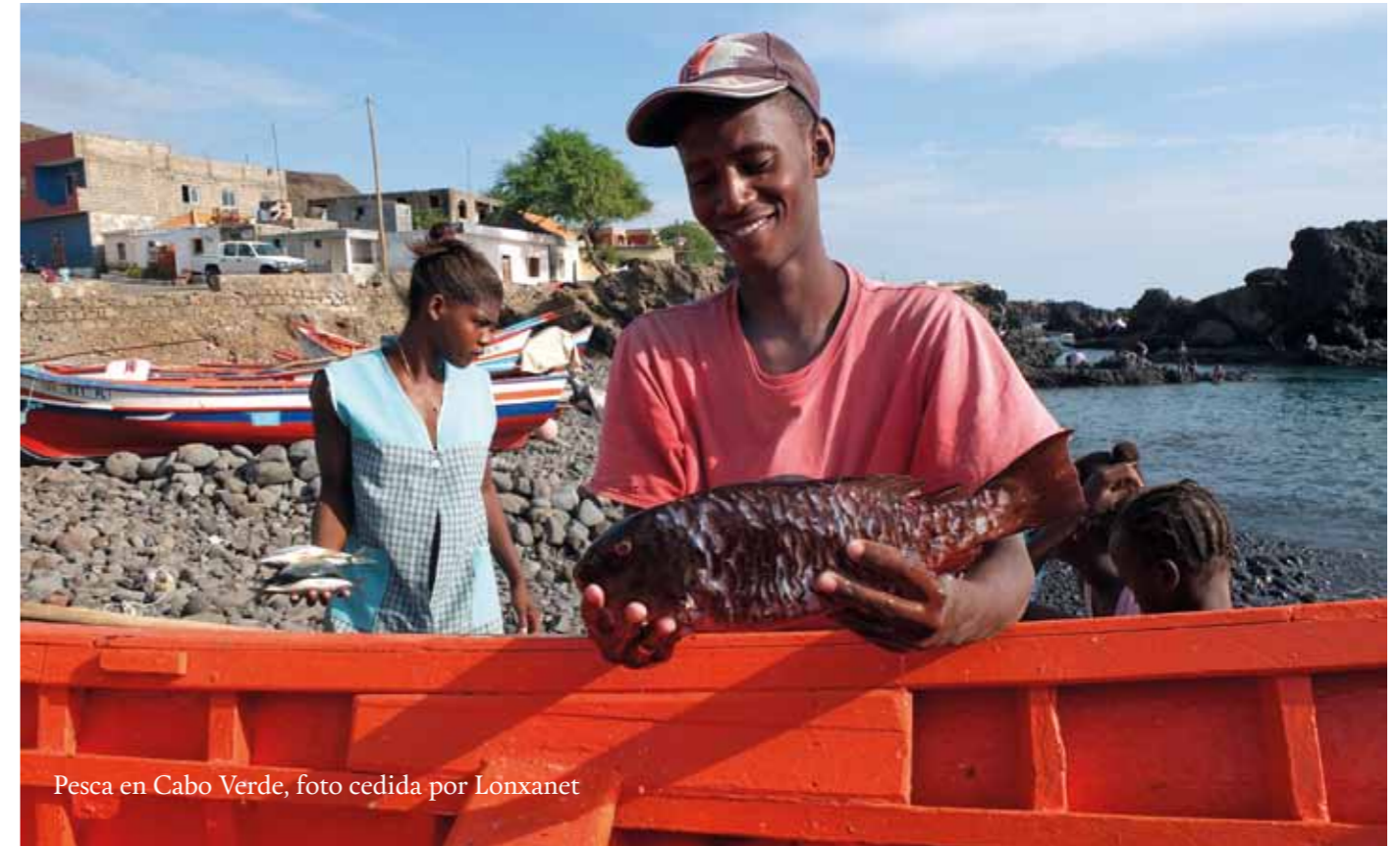
Pesca en Cabo Verde

En los seis países visitados, un asunto que siempre se repite son los problemas encontrados con los pesqueros de arrastre de origen extranjero, que vienen a pescar en las zonas de la pesca artesanal, o compiten por los mismos recursos que esta. Sin embargo, algunas batallas han sido ganadas, victorias de las que la población local está orgullosa de celebrar. Es el caso de la Feria Nacional del Pulpo en Mauritania, celebrada el 26 de julio. En ese día, en 2012, Mauritania firmó un acuerdo de pesca con la UE que impedía a las flotas europeas acceder a los pulpos, reconociendo que estos eran exclusivos de las pesquerías mauritanas, especialmente de las artesanales. Para