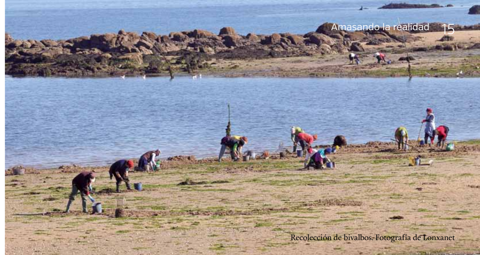
Recolección de bivalvos.

Acaparamiento de océanos: https://www.tni.org/es/publicacion/el-acaparamiento-mundial-de-oceanos-guia-basica .