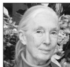
Dr. Jane Goodall