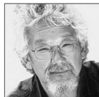
Dr. David Suzuki