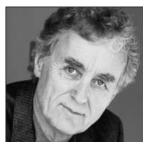
Dr. Fritjof Capra