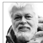
Cpt Paul Watson