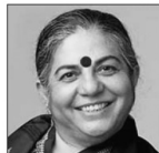
Dr. Vandana Shiva