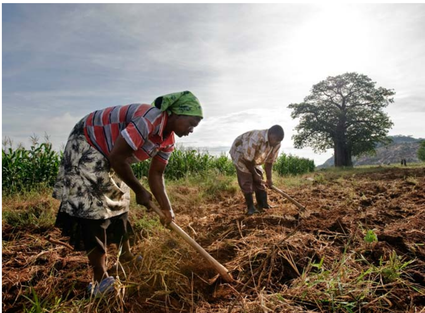
El acaparamiento global de tierras está lejos de terminar.