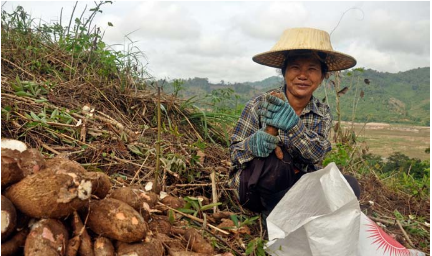
Cuando la sequía golpea, las comunidades que viven cerca de las plantaciones ven cómo se dificulta su acceso al agua.

tierras ha ayudado a traer la tierra y la reforma agraria de vuelta al debate público en los parlamentos y otros foros legislativos. Pero el principal objetivo del proceso regulatorio es formalizar el mercado de tierras y los títulos de propiedad, lo cual, la experiencia nos dice, terminará en una mayor concentración de la tierra en manos de unos pocos. 7