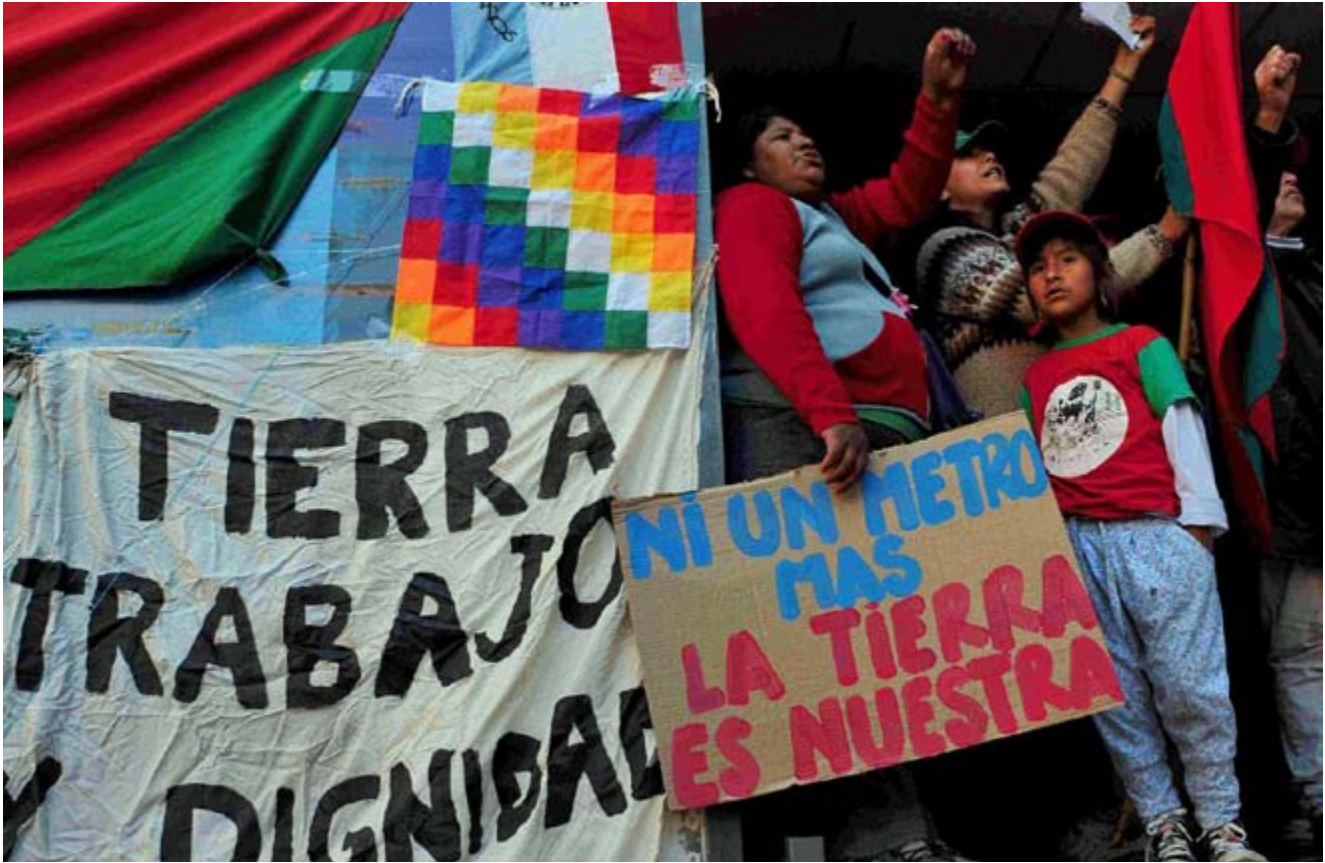
La resistencia y la solidaridad están creciendo.

notar que las compañías que están acaparando tierras no tienen mucho interés en la agricultura y parecen haber sido creadas para propósitos totalmente diferentes —como lavado de dinero, evasión de impuestos o para estafar a la gente con sus ahorros. Por ejemplo, la African Land Limited del Reino Unido, que armó un sistema para vender tierras agrícolas en Sierra Leona, fue encontrado culpable de engañar a sus inversionistas. Lo campesinos locales y pequeños ganaderos de Senegal, desde hace mucho tiempo, sospechan que Senhuile lleva a cabo lavado de dinero. 13 La Kenya Revenue Authority (la agencia fiscal de Kenia) persiguió por años a Karuturi, uno de los mayores inversionistas en tierras agrícolas en Etiopía, por manipular precios de transferencia entre sus subsidiarias. 14 No es una sorpresa que muchos inversionistas en tierras agrícolas se encuentren en los Panamá Papers, como el multimillonario ruso