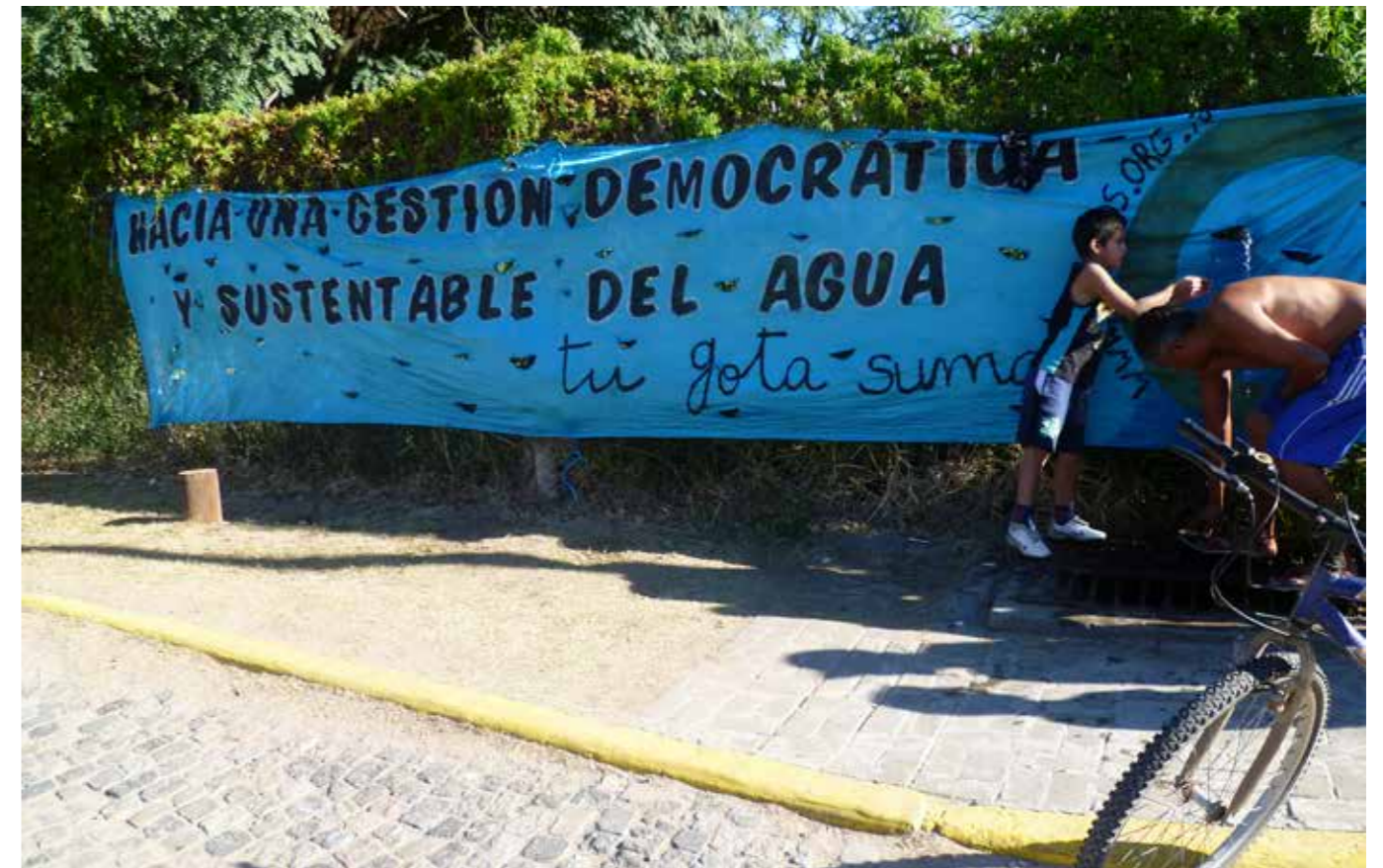
Campaña agua y sustentabilidad.

*Los gobiernos de todo el mundo deben proteger las aguas de sus territorios, y declararlas Bienes Comunes.