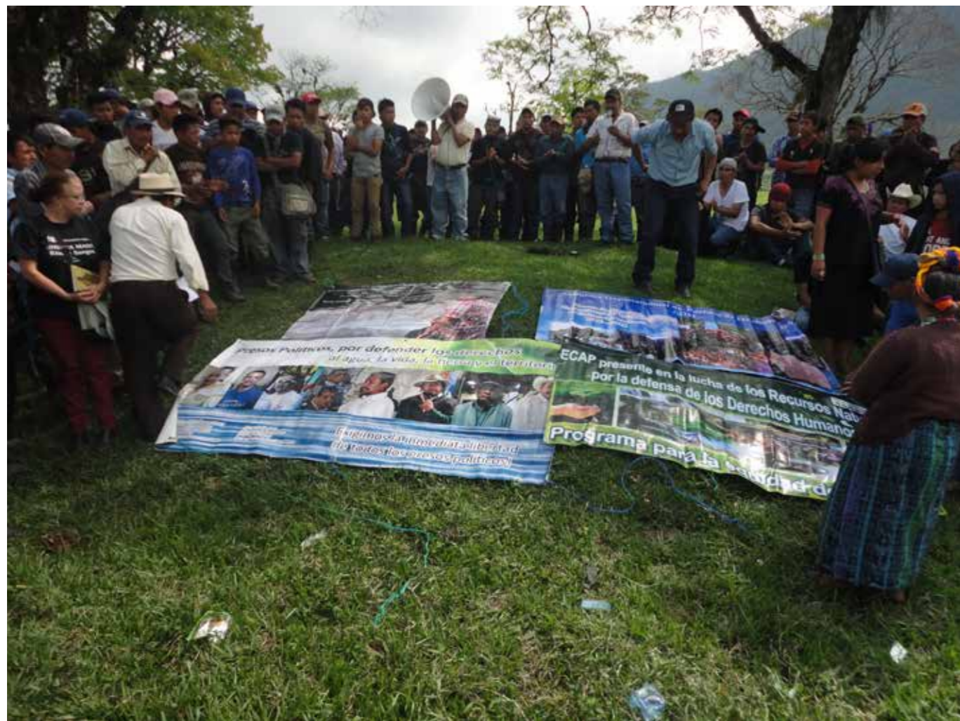
Visita de la Comisión de Ambiente del Congreso de la República de Guatemala, en abril del 2016, a las comunidades de Ixquis. Representantes comunitarios presentan la situación.