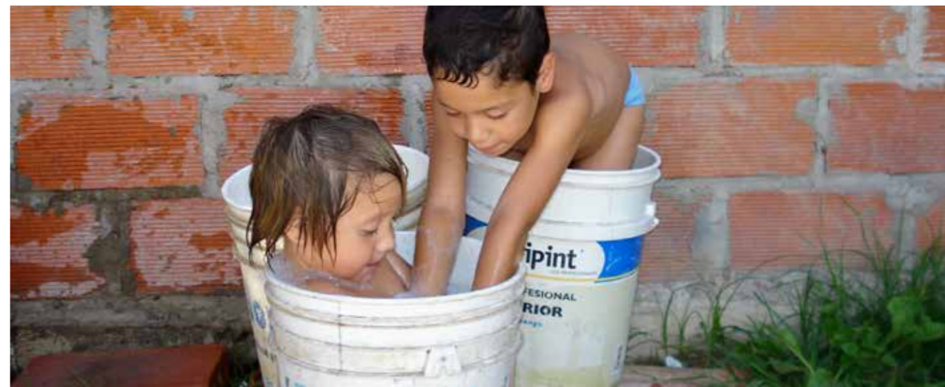
Niños jugando con agua en el Conurbano bonaerense.

Así como capitales extranjeros, la Argentina recibió la mayor cantidad de demandas en el arbitraje internacional durante los años posteriores a la crisis de 2001 y sus medidas asociadas, como el congelamiento de las tarifas y, la devaluación del peso en 2002. Hasta el presente año, el país cuenta con 59 demandas, en su mayoría en el CIADI. Esto lo convierte en el país más demandado en el sistema de arbitraje internacional. Las demandas inversor-estado han aumentado en las últimas dos décadas, de un total de 3