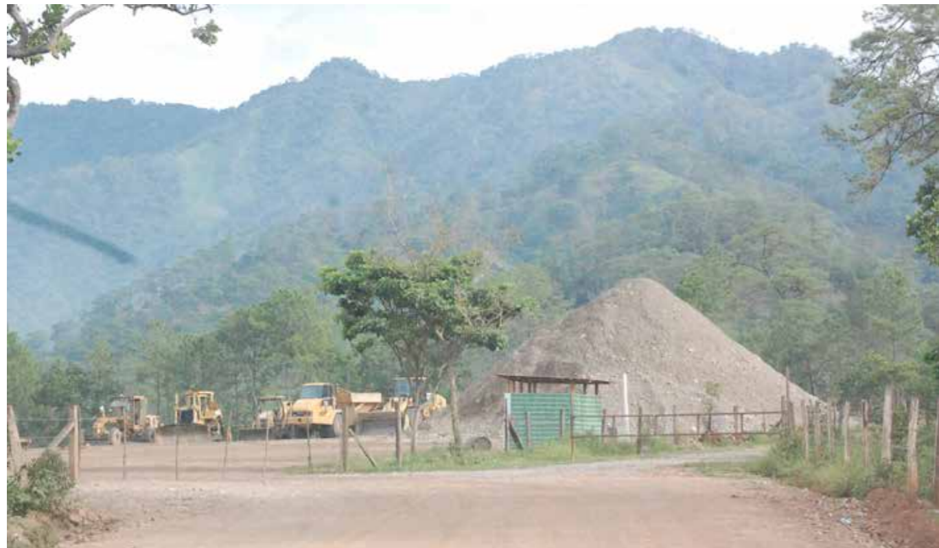
Foto de las instalaciones de Blackfire en Chicomuselo en Chiapas.