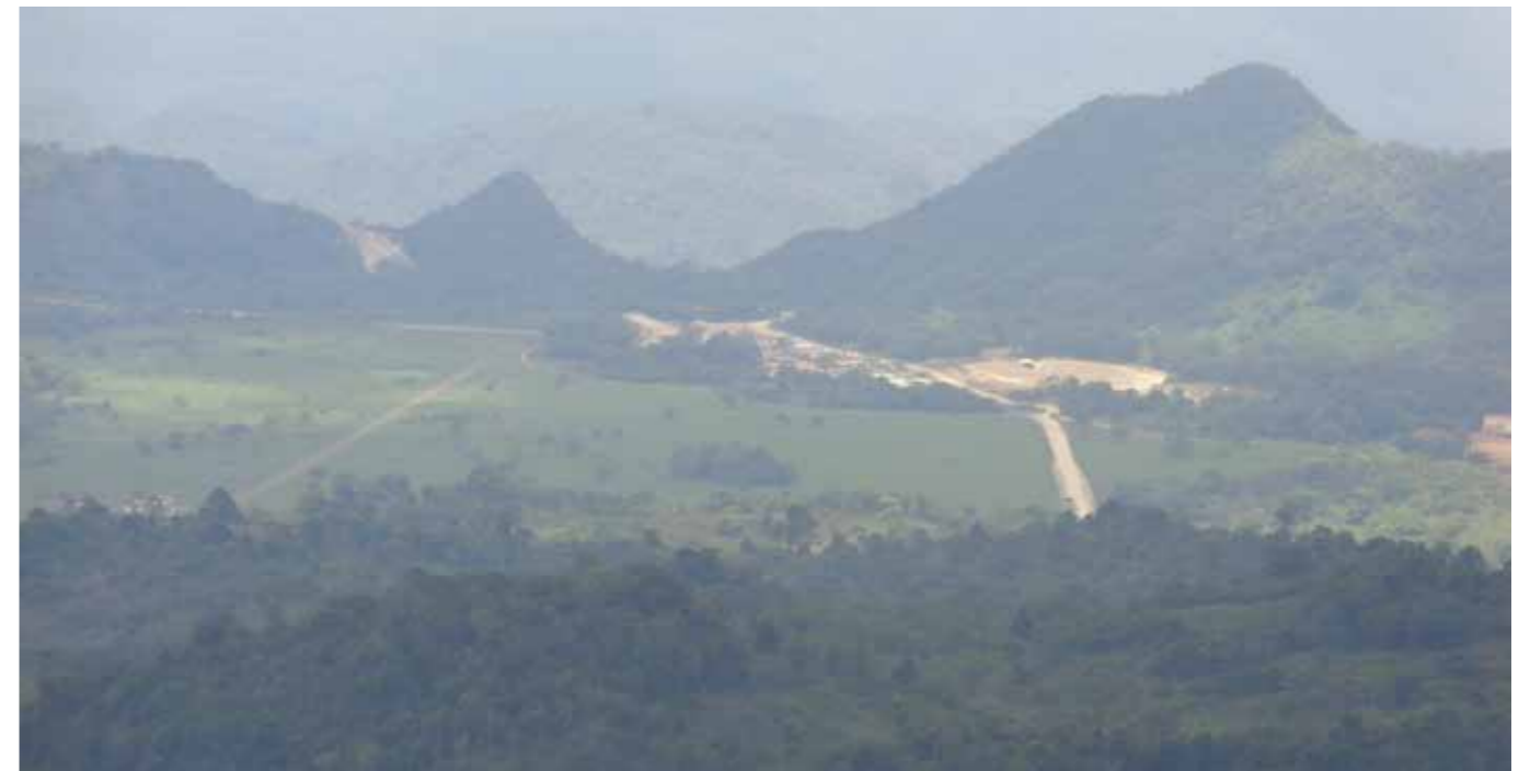
Valle de Ixquisis, vista desde la aldea Pojom, San Mateo Ixtatán, Huehuetenango. Se visualiza la presa, el desvío de los ríos y las instalaciones de la PDH S.A.

La población ha estado exigiendo respeto por su consulta comunitaria, y porque se suspendan los proyectos hidroeléctricos. En su afán de que sus proyectos se realicen a toda costa, la empresa ha desarrollado toda una serie de estrategias para imponer sus proyectos: La desinformación, la cooptación de los Alcaldes municipales y líderes comunitarios vinculados en el pasado con la militarización del país (patrullas de autodefensa civil y comisionados militares), contratado a empresas de seguridad privada, cooptado a estructuras del Estado en su beneficio, y las intimidaciones, amenazas y hasta muertes. Durante el año 2016 se reportaron: 4 detenciones extrajudiciales por parte del Ejército y PNC, 12 difamaciones, 4 agresiones físicas, 11 agresiones armadas, 11 medidas de control/vigilancia, 18 intimidaciones, 4 amenazas, 7