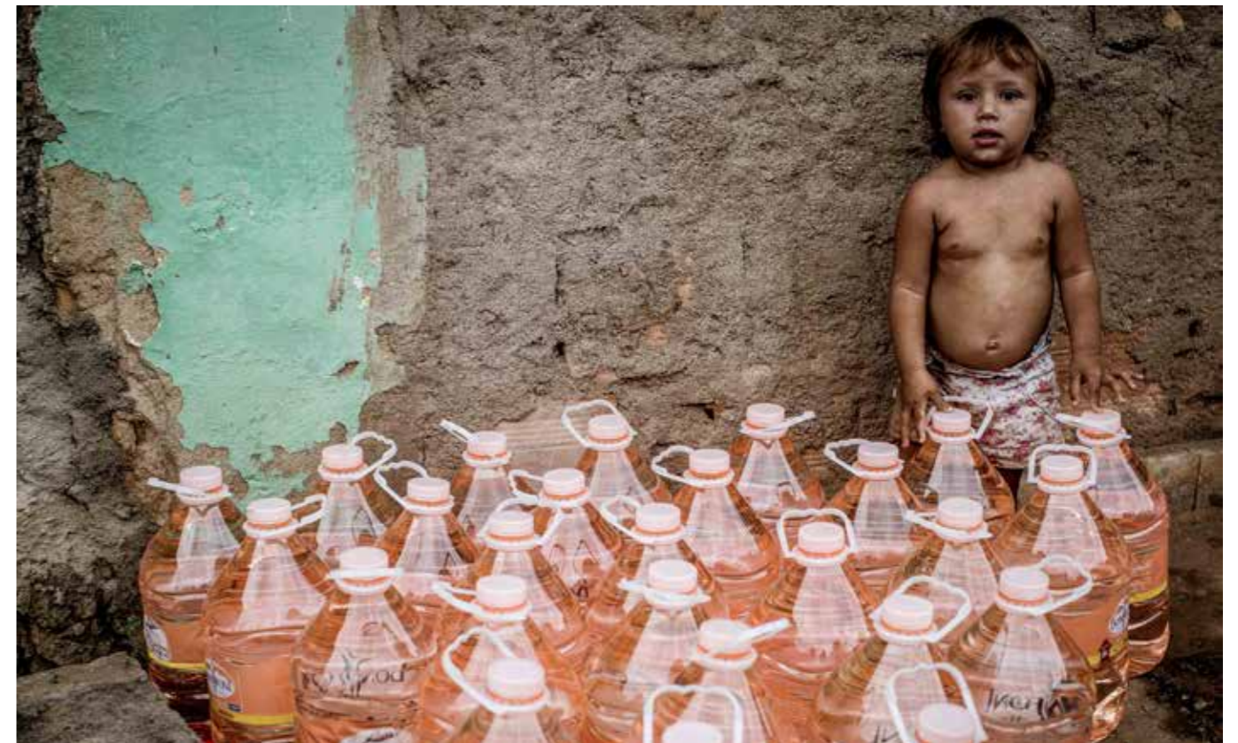
Niña en Mariana (MG) durante distribución de agua. Muchas comunidades siguieron teniendo violados sus derechos cotidianamente, con acceso restringido a agua potable.

Hubo avisos, por lo tanto, y fueron sumariamente silenciados por BHP y Vale 15 . Posteriormente (porque antes no hubo inspección necesaria para que se evitara el crimen), el Ministerio Público llevó a público documentos internos de Samarco evidenciando que entre los altos ejecutivos de la empresa, se conocían los