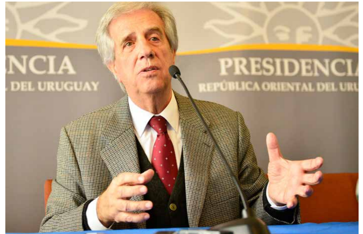
Tabaré Vázquez, presidente de Uruguay e impulsor de la política anti tabaco en el país desde 2006.

En pocas palabras, la empresa alegó que las medidas adoptadas por el gobierno uruguayo implicaban un trato discriminatorio, injusto e inequitativo y que representaban una expropiación de su propiedad intelectual sin la debida indemnización.