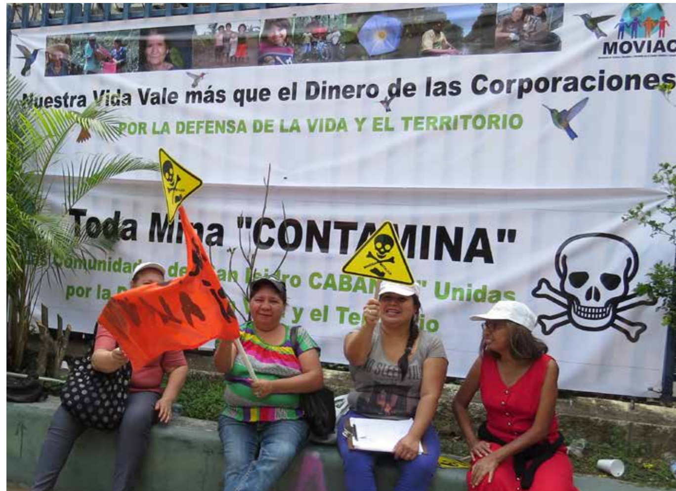
Pobladores-as demandan ley de prohibición de la minería metálica.