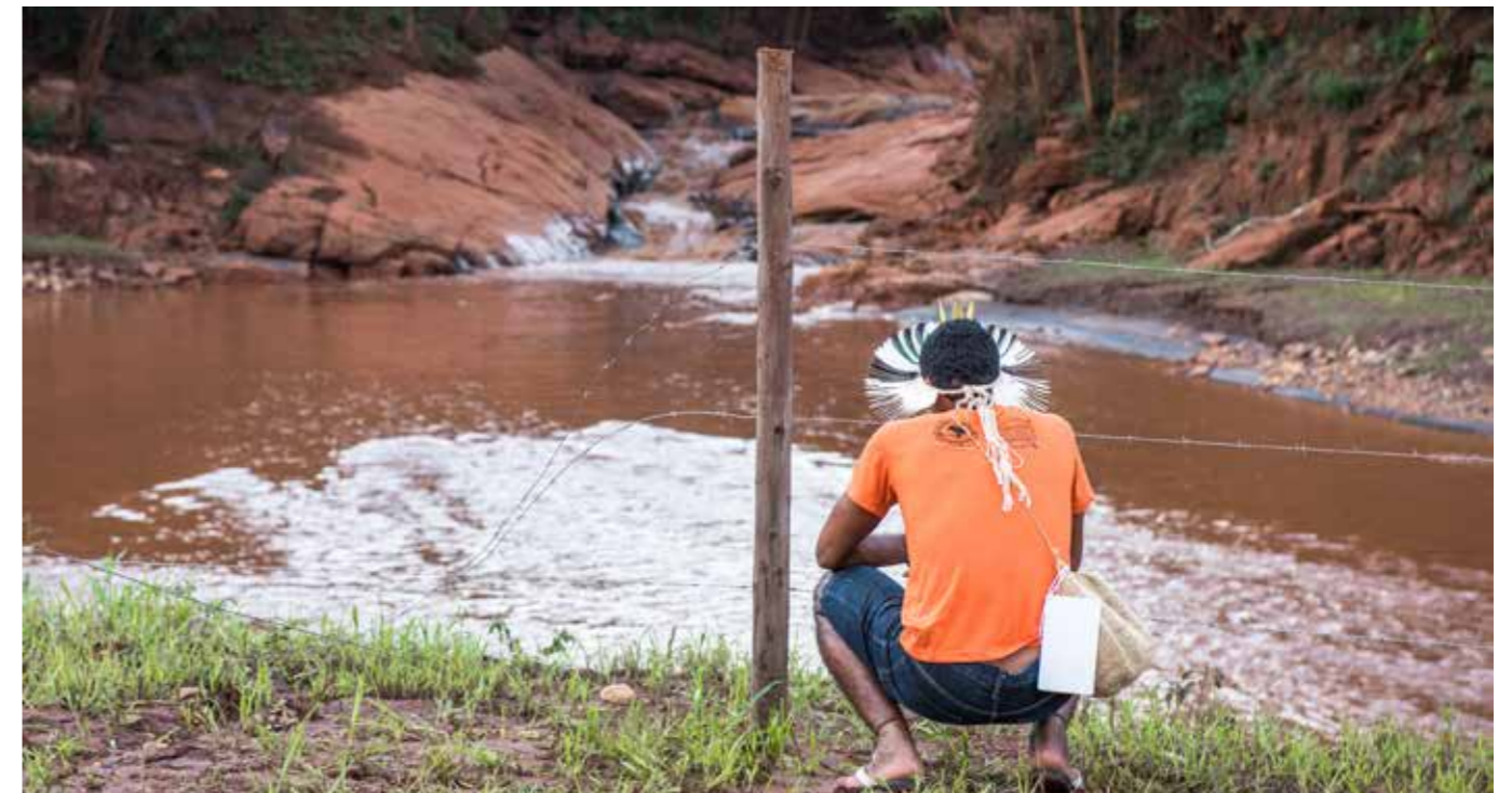
Indígena observa el rastro de destrucción en el río Gualaxo do Norte, subafluente del Río Doce, primer manantial afectado por la lama de Samarco.

A fin de cuentas, no hay patrón más evidente y sistemático en el actuar de esas grandes corporaciones alrededor del globo – y en especial al sur del mundo – que las violaciones de derechos hu-