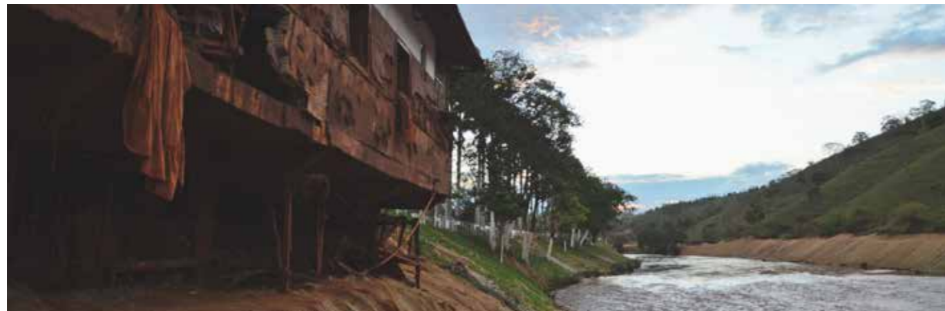
Un año después de la ruptura de la represa casas en diversas comunidades todavía muestran las memorias del crimen. Registro de un caserón a orillas del Río do Carmo, uno de los que forman el Río Doce, en el municipio de Barra Longa, Minas Gerais, en noviembre de 2016.