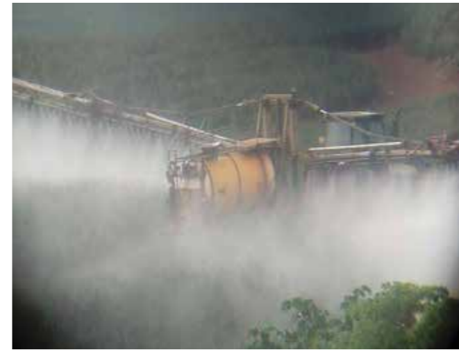
Fumigaciones en las plantaciones de piña en Costa Rica.

como las empresas Del Monte y la Chiquita Brand;