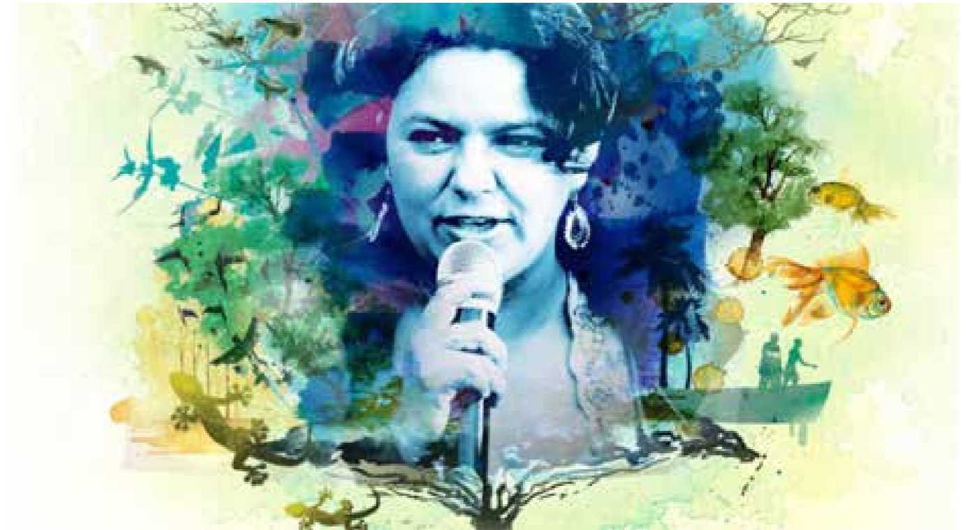
Berta Cáceres Vive