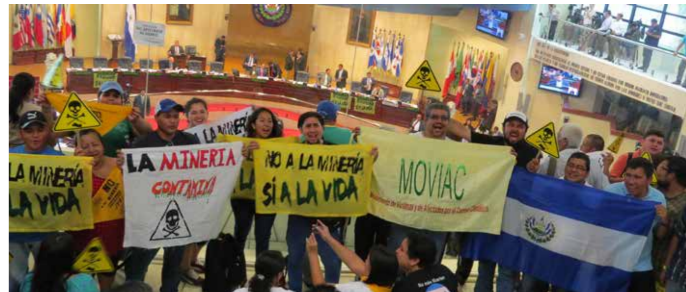
Al interior del Parlamento Salvadoreño al momento de decidir la aprobación de la ley contra la minería en El Salvador.