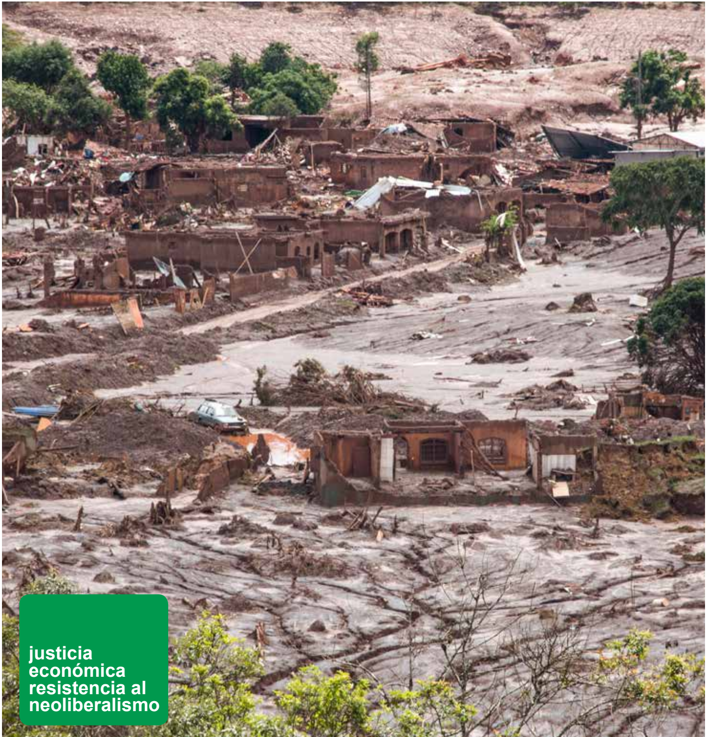
Bento Rodrigues, município de Mariana (MG), después del paso de la lama de la represa de Fundão.