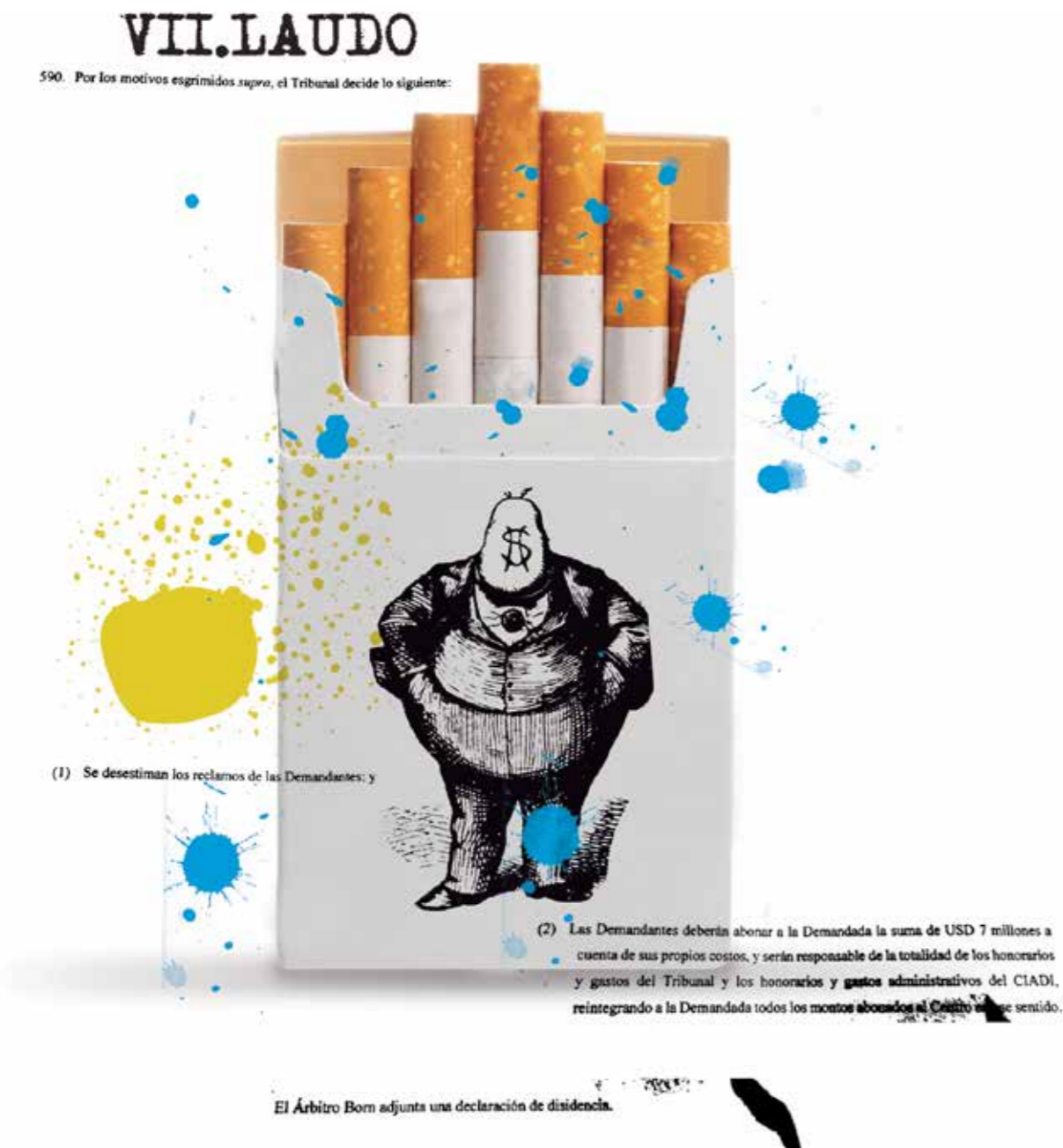
Diseño: Nicolás Medina, REDES - Amigos de la Tierra Uruguay.

Salud, que se presentaron como 'amigos de la corte' en defensa de Uruguay, cuando la mayoría de las veces son organizaciones no gubernamentales las que se presentan como amigos de la corte y por lo general son rechazadas por los tribunales de arbitraje.