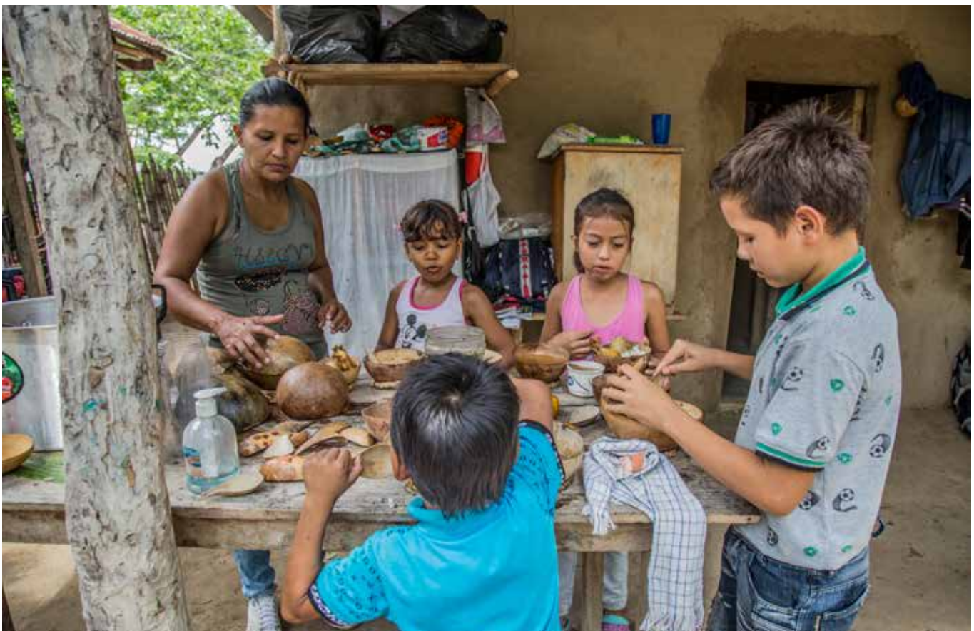
Intercambio de semillas, saberes y miradas sobre los territorios.

Aparentemente Brasil no tenía el mandato del Grupo de Países Megadiversos Afines, de quien era representante, o del Grupo América Latina y el Caribe (GRULAC) para llevar a cabo estas conversaciones secretas, ni por supuesto hubo ningún proceso de información ni consulta con ellos. Tampoco lo sabía el Grupo de Países Asiáticos. De esta manera, el mundo en vías de desarrollo parecía estar oficialmente fuera de las negociaciones. Sólo de último momento, Namibia (representante del Grupo de África) fue invitado con el aparente objetivo de asegurar su voto en apoyo de la iniciativa UE-Brasil que incluiría un artículo