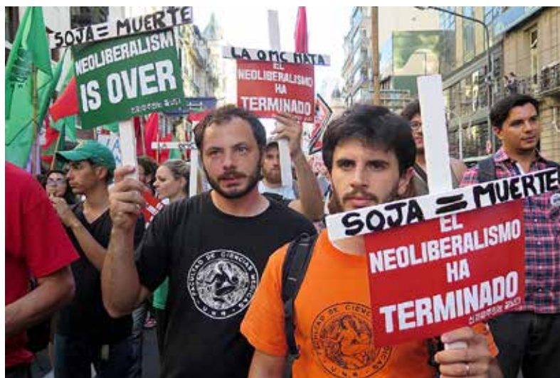
Marcha contra la OMC, Buenos Aires, Argentina, diciembre de 2017.