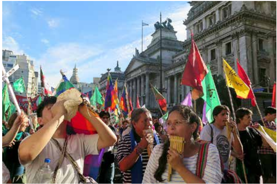
Marcha contra la OMC, Buenos Aires, Argentina, diciembre de 2017.

Somos una sola fuerza hermanada con los trabajadores urbanos, consumidores, desocupados, movimientos feministas, movimientos por la diversidad sexual, ecologistas, organizaciones de jóvenes, académicos y todas y todos los que llegamos aquí comprometidos en la construcción de otra sociedad.