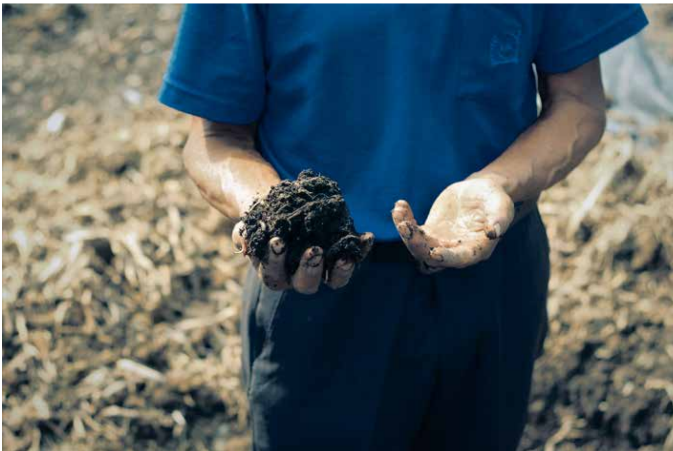
Tierra fértil plena de materia orgánica.

E n agosto de 1838, un joven llamado Frederick Bailey escapó de la esclavitud en Baltimore, en la costa este de los Estados Unidos. Menos de tres semanas después, caminando por la que sería su nueva ciudad natal, New Bedford, Massachusetts, vio una pila de carbón que habían dejado tirada en la calle frente a una casa. Bailey ofreció sus servicios para cargarla y guardarla de manera segura. Una vez terminado el trabajo, la señora de la casa puso en su mano dos monedas de plata de cincuenta centavos de dólar.