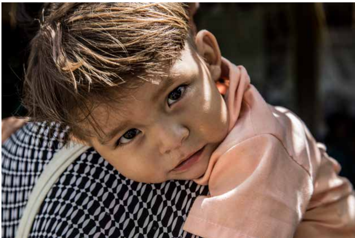
Una madre lleva a su hijo a la escuela agroecológica y territorial Manuel Quintín Lame.

E l gran fraude climático, argumentos contra la geoingeniería ( The Big Bad Fix ), informe publicado por el Grupo ETC, Biofuelwatch y la Fundación Heinrich Böll, advierte que la geoingeniería (la manipulación del clima a gran escala) está ganando aceptación en países altamente contaminantes, como una “solución” tecnológica al cambio climático, ya que esos países se niegan a cambiar sus economías basadas en combustibles fósiles. Por ello proliferan los programas y proyectos de investigación sobre geoingeniería, planeados y financiados por la industria e instituciones privadas, principalmente en los países que son grandes emisores de gases de efecto invernadero, como Estados Unidos, Reino Unido y China. El gran fraude climático analiza el contexto y riesgos de la geoingeniería, revela sus actores, intereses creados y las políticas que subyacen al avance de esquemas tecnológicos a gran escala para manipular los sistemas naturales de la Tierra.