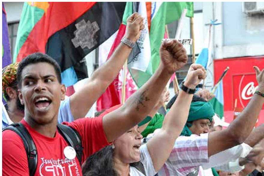
Marcha contra la OMC, Buenos Aires, Argentina, diciembre de 2017.

Quinto. Es inevitable reseñar la respuesta al estudio del equipo de investigación mexicano UNAM-UAM, por parte de los investigadores paladines de los transgénicos. Ésta es la repetición de todo lo que desde el gobierno, la industria y ciertos científicos, sigue siendo la reivindicación principal: que los transgénicos son inocuos, que se han cumplido todas las regulaciones, nacionales e internacionales, que hay una equivalencia sustancial entre transgénicos y no transgénicos. En la respuesta más directa, los promotores de transgénicos afirman: “En más de 20 años de uso y consumo continuo por más de 1200 millones de humanos y 100 mil millones de animales, no se ha presentado ninguna evidencia científica de daños por su consumo. El supuesto daño reportado en algunos artículos (Seralini et.al , 2012 y 2014), no tiene sustento científico relevante”. 21