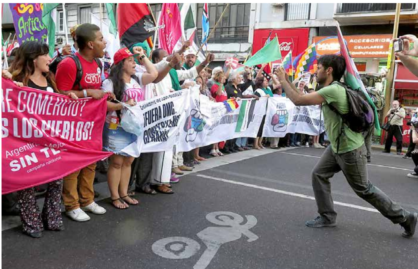
Marcha contra la OMC, Buenos Aires, Argentina, diciembre de 2017.