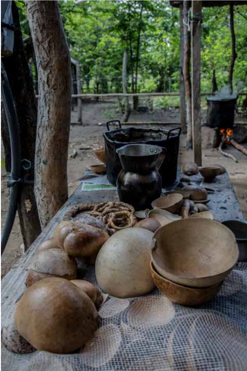
Utensilios de cocina de árbol del Totumo fabricados por comunidades indígenas del sur de Tolima, Colombia.

3. Roots of inequity: How the implementation of REDD+ reinforces past injustices http://www.redd-monitor.org/2016/01/14/roots-of-inequity-in-wildlife-works-kasigau-corridor-redd-project/