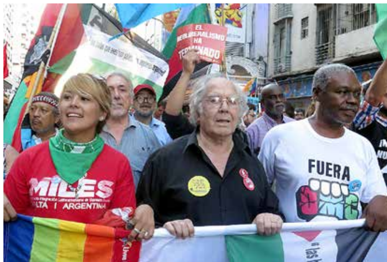
Marcha contra la OMC, Buenos Aires, Argentina, diciembre de 2017.

Los contenidos se estructuran en cinco capítulos. En el primero se describen los cultivos transgénicos con datos sobre la tecnología en sí y sobre su situación actual a nivel mundial, y en particular en Uruguay. Se describe para ese país el marco normativo vinculado a la evaluación de riesgos y lo referente al etiquetado de los alimentos derivados de esos cultivos. Se aborda críticamente el proceso de evaluación de riesgos que ha derivado en la aprobación de quince eventos transgénicos de soja y maíz que hoy se cultivan a nivel comercial en