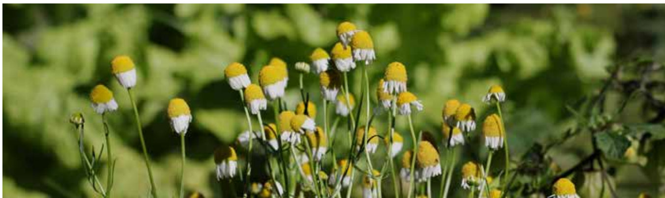
I 6 Camomila, Costa Rica.