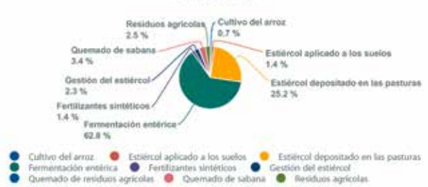
Emisiones por sector (CO 2 equivalente) Promedio 1990 - 2014

Fuente: FAOSTAT (24, septiembre de 2017) http://www.fao.org/faostat/es/#country/169