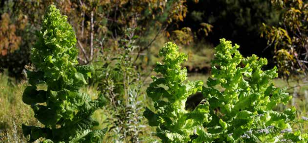
Siembras agroecológicas en Costa Rica.