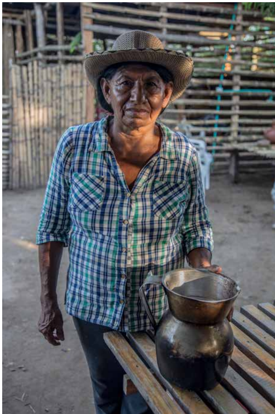
Municipio de Coyaima, Tolima, Colombia

El informe de The Munden Project —y un número creciente de propuestas de reforma de la tenencia de tierras