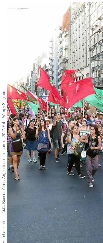
Marcha contra la OMC, Buenos Aires, Argentina, diciembre de 2017.

Violencia con que las corporaciones buscan convertir a nuestros alimentos en mercancías produciendo la mayor crisis alimentaria que haya sufrido la humanidad con más de la mitad de la población malnutrida o malcomida sufriendo de hambrunas, múltiples carencias y enfermedades crónicas por sobrepeso y obesidad; sufrimiento que es mayor en los más vulnerables.