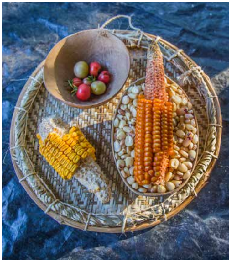
Variación de semillas cultivadas en zonas secas y resistentes al cambio climático.