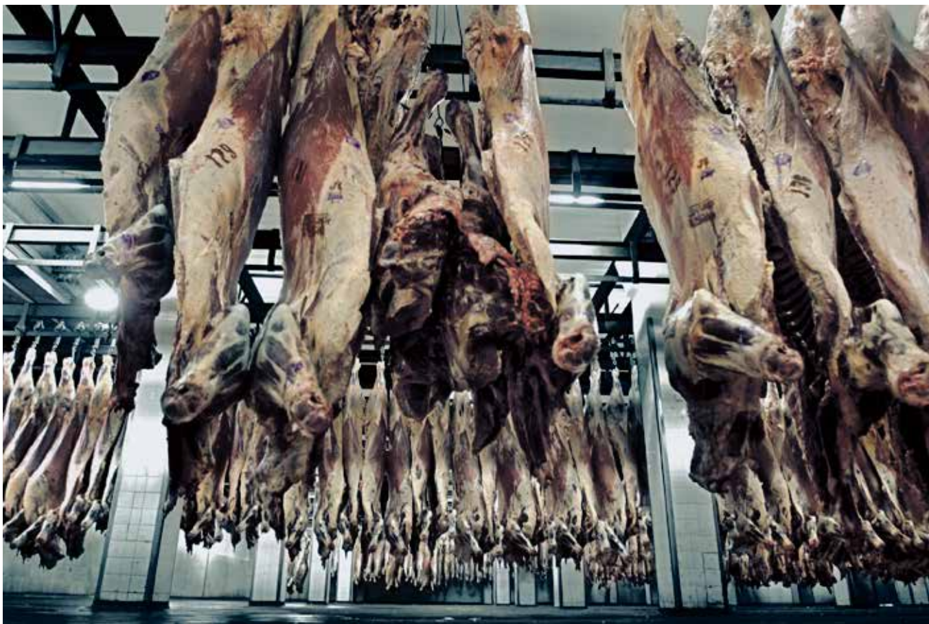
Carne paraguaya

breza y pobreza extrema. Coincide que de los 5 Departamentos con mayor producción de carne (Pdte. Hayes, Boquerón, Alto Paraguay, San Pedro y Concepción), 3 (Pdte. Hayes, Boquerón y Concepción) forman parte del grupo de los 5 departamentos más desiguales del país; otros 3 (Alto Paraguay, San Pedro y Concepción) de los 5 con mayor porcentaje de pobreza y 2 (Alto Paraguay y San Pedro) pertenecen al grupo de departamentos con mayor pobreza extrema. Los departamentos no ganaderos que pertenecen al grupo de los más desiguales, pobres y de extrema pobreza son aquellos con grandes extensiones de monocultivo de soja.