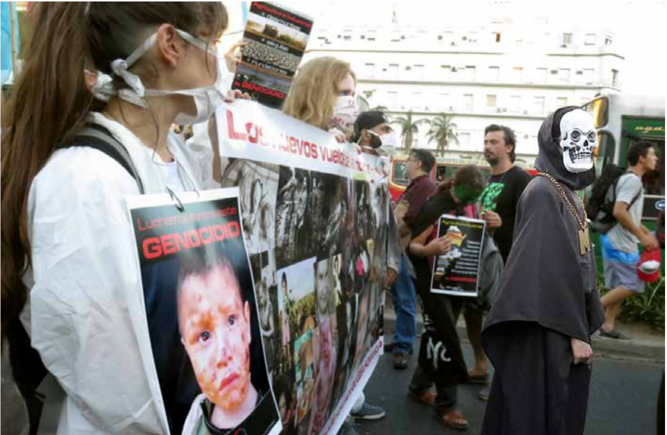
Marcha contra la OMC, Buenos Aires, Argentina, diciembre de 2017.

Violencia con la que se están imponiendo nuevas y cada vez más peligrosas tecnologías sin debate, consulta ni participación de los pueblos. Tecnologías que como los transgénicos, los nuevos desarrollos biotecnológicos, la georingeniería o las nuevas técnicas de edición genética amenazan todos los sistemas de vida a nivel global.