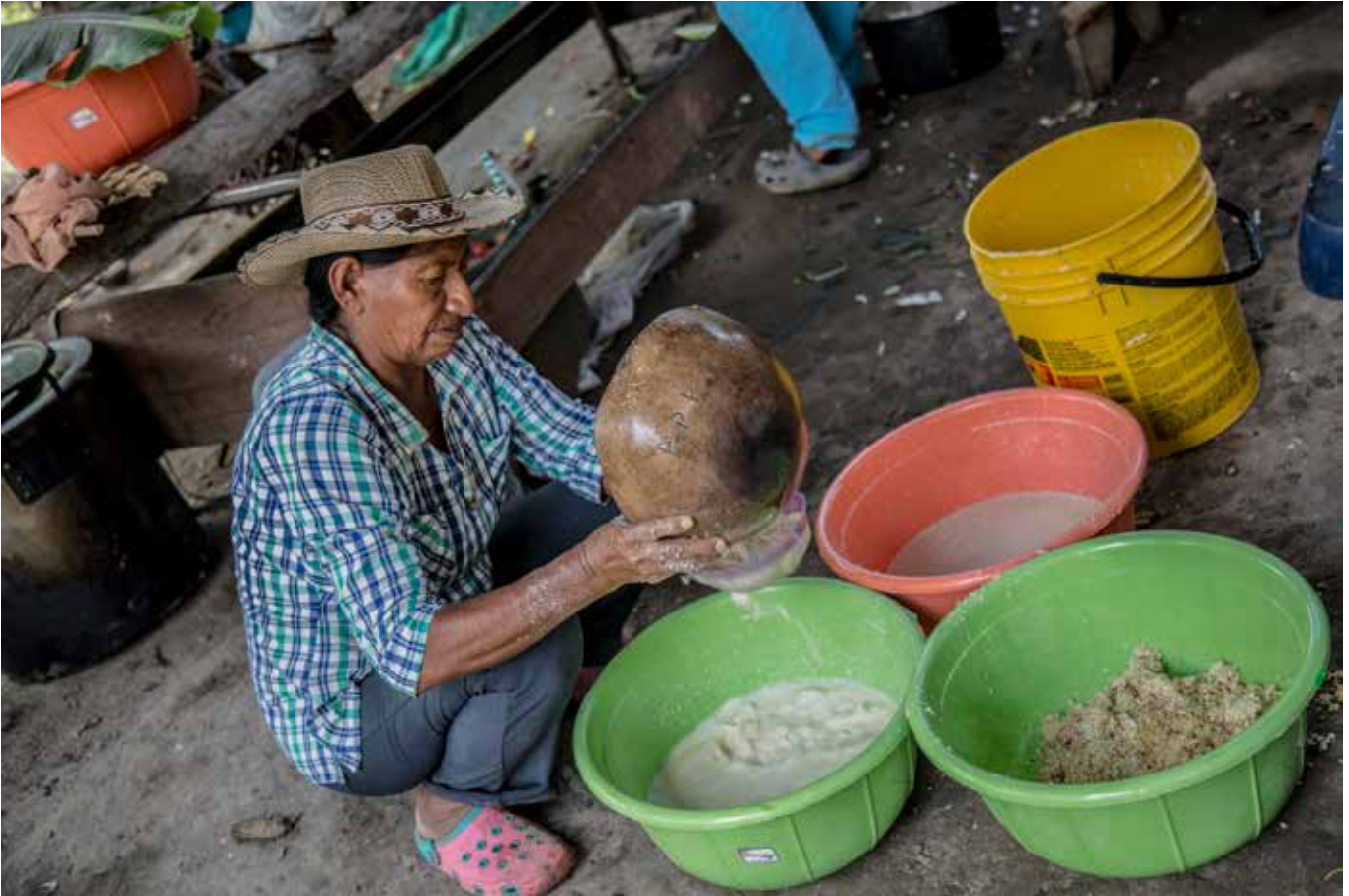
Elaboración artesanal de chicha de maíz.

las públicas que se desmoronan, a condición de que la comunidad presente un título de propiedad individual para el terreno escolar. Además de violar la Convención Interamericana de Derechos Humanos, esta presión provoca divisiones dentro de la comunidad. Aunque las comunidades entienden la importancia de afirmar siempre su propiedad comunal, tan importante para su supervivencia como pueblos indígenas con una cultura diferenciada, la gran necesidad de tener una buena infraestructura escolar y de salud lleva a algunos de sus miembros a aceptar tales presiones. 5