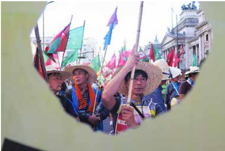
Marcha contra la OMC, Buenos Aires, Argentina, diciembre de 2017.

M ediante pedidos de acceso a información pública, un grupo de organizaciones de la sociedad civil, entre ellas la Red del Tercer Mundo y el Grupo ETC, obtuvo más de mil 200 correos electrónicos de investigadores de universidades públicas de Estados Unidos que revelan que el Ejército de ese país es hoy el principal financiador global de la controvertida tecnología de impulsores genéticos — gene drives en inglés ( https://tinyurl.com/ybusbtqx ). Se trata de una forma de ingeniería genética para engañar las leyes de la herencia, de forma que un rasgo transgénico se trasmita por fuerza a toda la descendencia de plantas, insectos o animales. Se propone para extinguir especies enteras consideradas plagas, como mosquitos, ratones y malezas. Entre los consultores del ejército sobre esta tecnología aparece un alto ejecutivo de Monsanto ( http://genedrive-files.synbiowatch.org/ ).