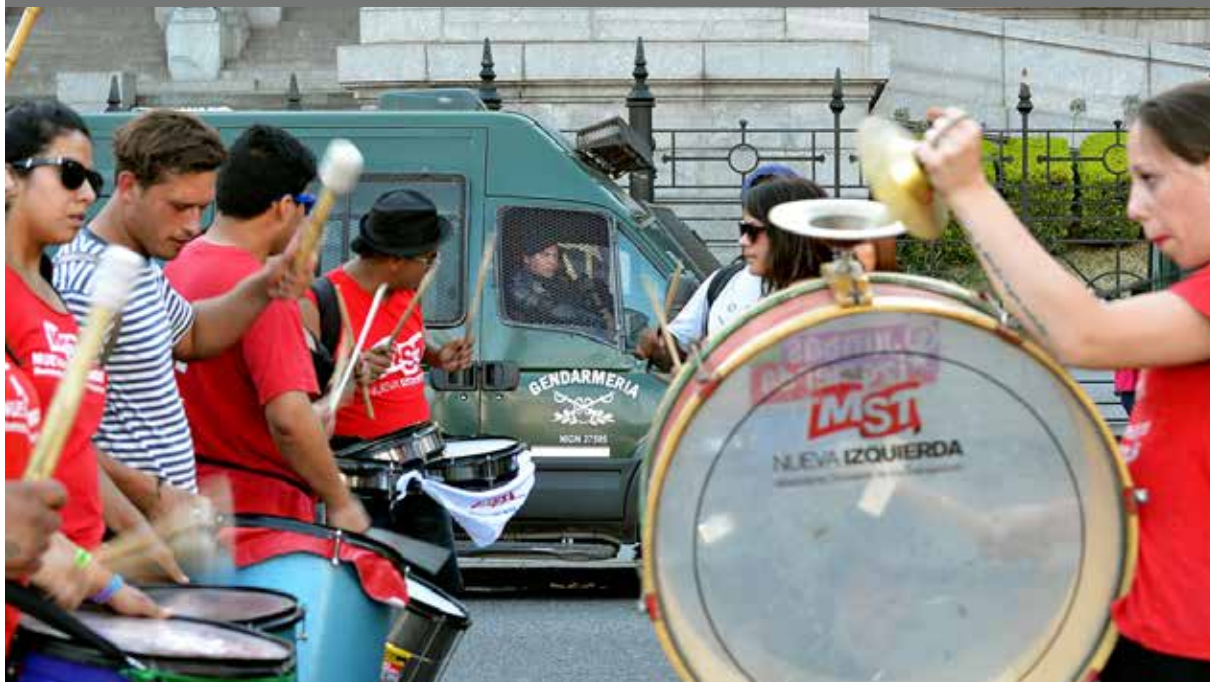
Marcha contra la OMC, Buenos Aires, Argentina, diciembre de 2017.