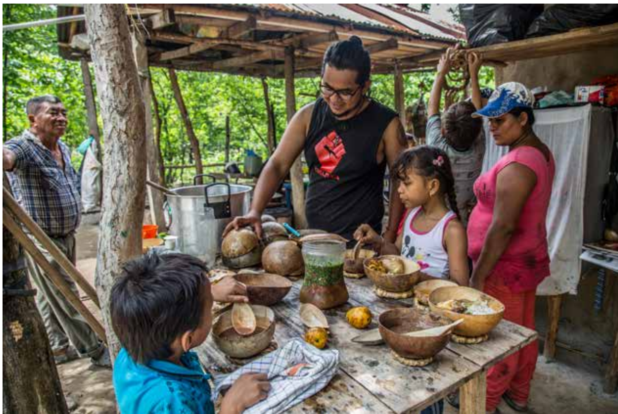
Compartiendo la importancia de producir alimentos sanos.

Durante la ardua lucha de la comunidad contra las presiones de los hacendados y una ONG que impulsaba un proyecto de carbono forestal, se denunció ante las autoridades una serie de crímenes ambientales cometidos por el hacendado, pero estas denuncias fueron ignoradas por completo. Los derechos territoriales de la comunidad fueron violados constantemente tanto por el hacendado terrateniente como por el proyecto de carbono forestal. A pesar de esto, prevaleció la unidad y la movilización popular. Con el apoyo del Movimiento de los Trabajadores Rurales Sin Tierra (MST), ocuparon la tierra en 2003 e instalaron allí un campamento donde organizaron colectivamente el uso del territorio común. Se establecieron diferentes zonas de uso colectivo e individual, pensando sobre todo en el bienestar comunal. Hoy en día, este campamento ha recibido el premio Juliana Santilli por la recuperación exitosa de los bosques nativos y la producción sustentable de alimentos sin el uso de agrotóxicos. ♣