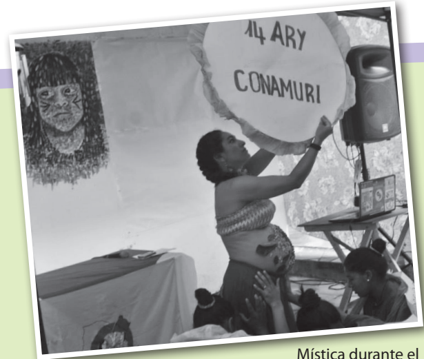
Mística durante el aniversario de Conamuri