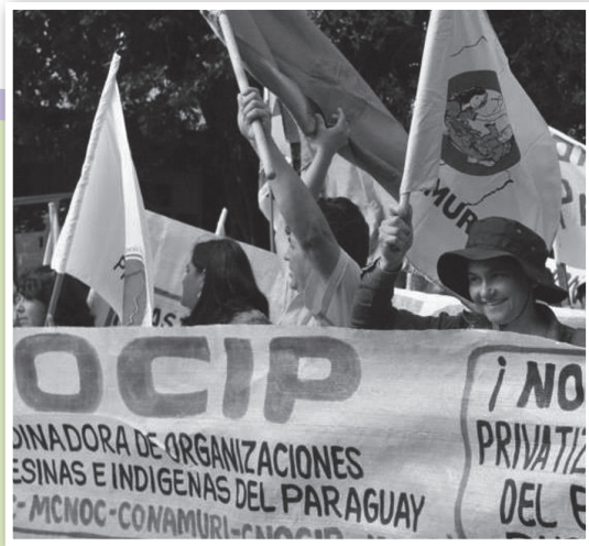
Marcha del Congreso Unitario