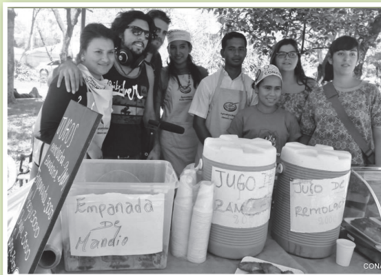
Feria Jakaru Pora Hagua