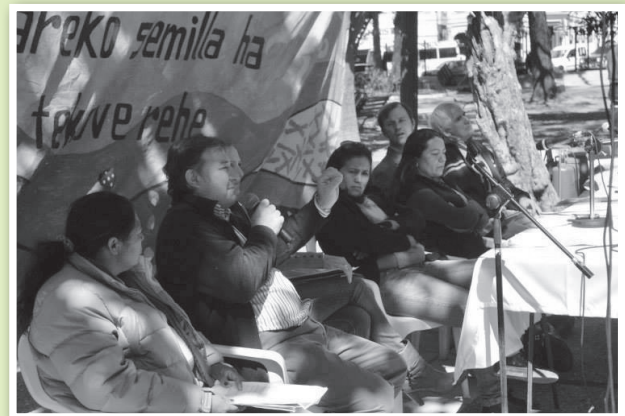
Seminario de Semillas