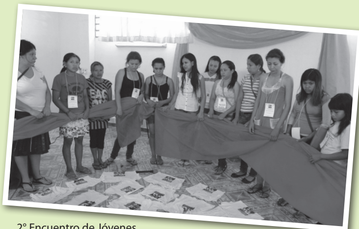
2° Encuentro de Jóvenes Campesinas e Indígenas