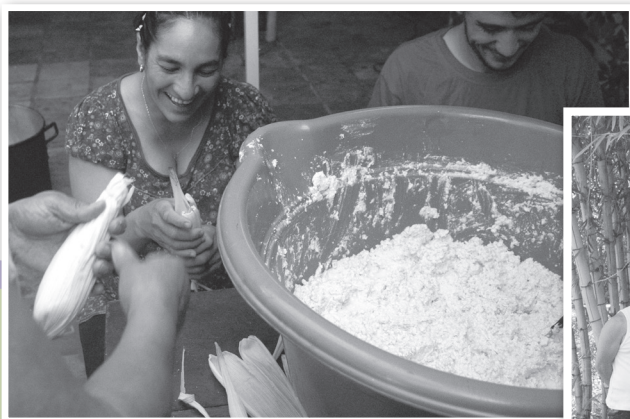
Feria Avati en el marco del día por el no uso de agrotóxicos