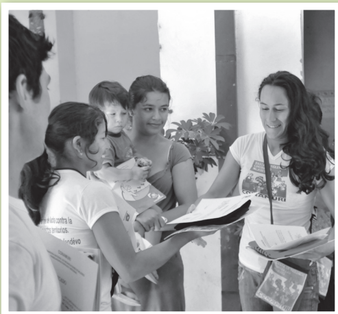
El Curso de Promotoría Jurídica entregó certificados de participación