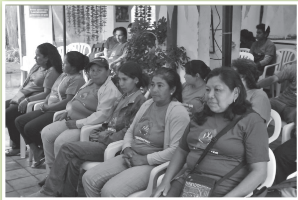
14ª Aniversario de Conamuri