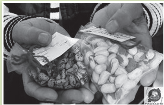
Intercambio de semillas durante el Seminario