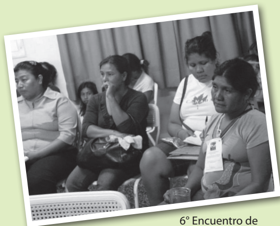
6° Encuentro de Mujeres Indígenas