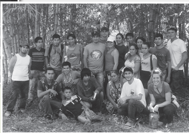
El Curso de Agroecología cerró su ciclo 2013