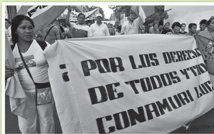
Marcha por la Soberanía Popular para la vigencia de los DDHH