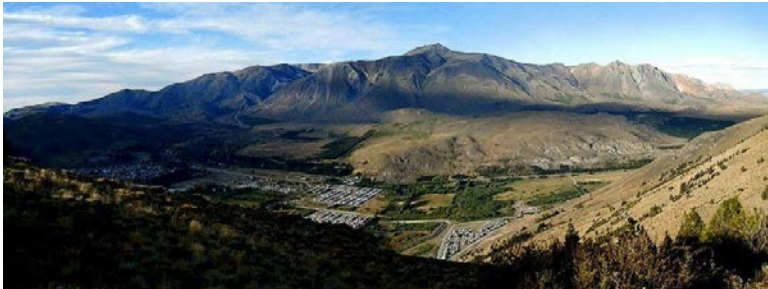
Esquel

Esquel es un pueblo que camina sus calles en defensa del agua y de la vida desde fines de 2002. Es el pueblo que echó a la multinacional minera que pretendió explotar el Cordón que lleva su nombre y que es símbolo y custodio de entereza y dignidad.