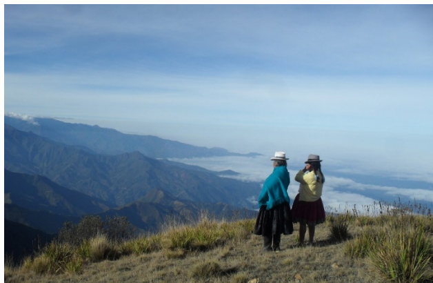
Foto: Área que será impactada por el proyecto

En este artículo trataré sobre los impactos sociales que ha ocasionado este mega proyecto minero, que al momento se encuentra en trámites para obtener la licencia para la fase de explotación, centrándome en aquellos que tienen relación con las violaciones a Derechos Humanos y constitucionales. También me interesa evidenciar la resistencia de las comunidades, dando énfasis, en el rol que han jugado las mujeres en este proceso, en especial el Frente de Mujeres Defensoras de la Pachamama, y la respuesta del gobierno y el Estado a las justas demandas de la población.