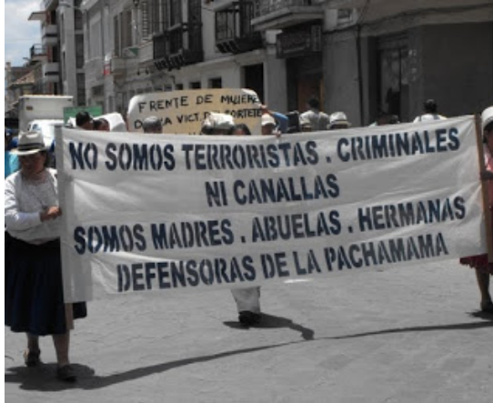
Foto: Contra la criminalización de la resistencia

Concomitante con la violación de los derechos y la legítima protesta de las comunidades para defenderlos, se da un proceso de criminalización y judicialización de la protesta social. Desde que se dieron las primeras acciones de hecho en contra la minería en junio de 2007, a pocos meses de haber iniciado el gobierno de Correa y siendo el Ministro de Minas y Petróleos el economista Alberto Acosta, se hizo un uso indiscriminado de la fuerza para sofocar las revueltas populares y comenzó una verdadera