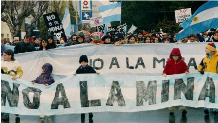
Asamblea de Vecinos Autoconvocados por el NO A LA MINA