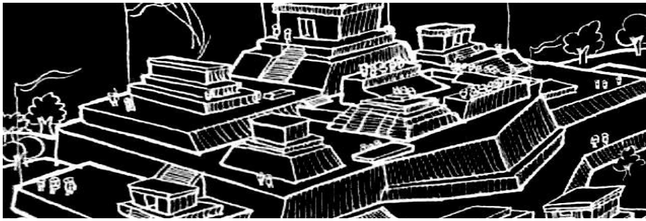
Theomai 27-28 · Año 2013

Perspectivas diversas sobre la problemática territorial y urbana