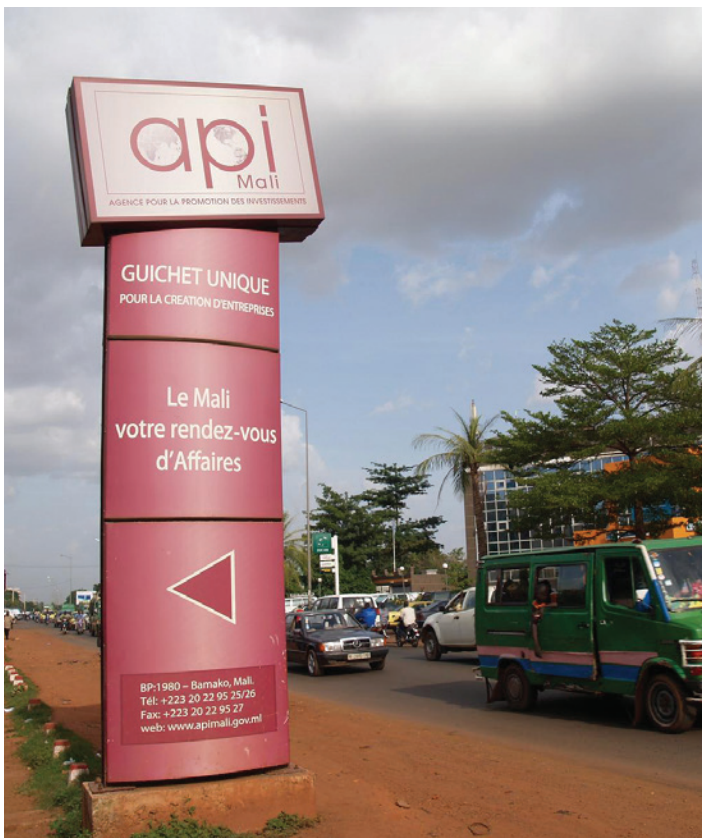
Señal indicadora de la agencia de promoción de las inversiones en Bamako, Mali