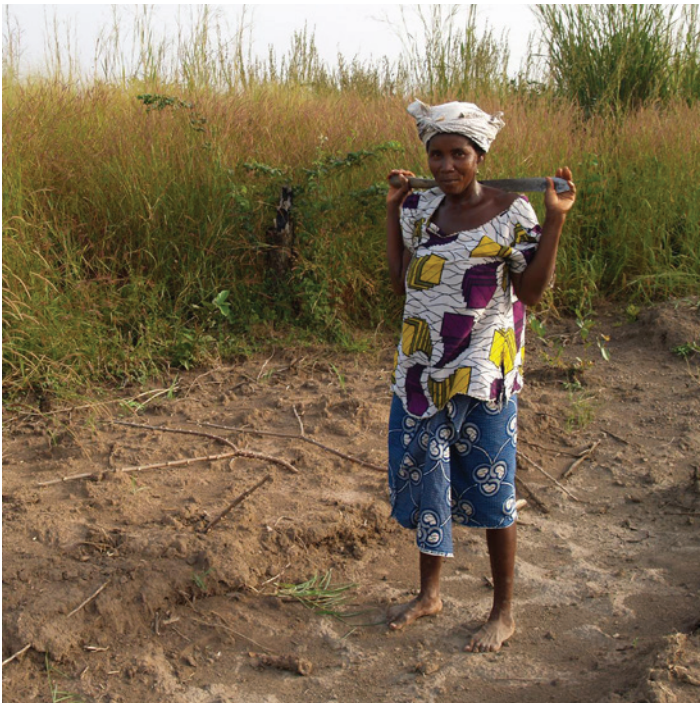
Campesina en Sierra Leone, sobre la tierra alquilada por una corporación suiza.