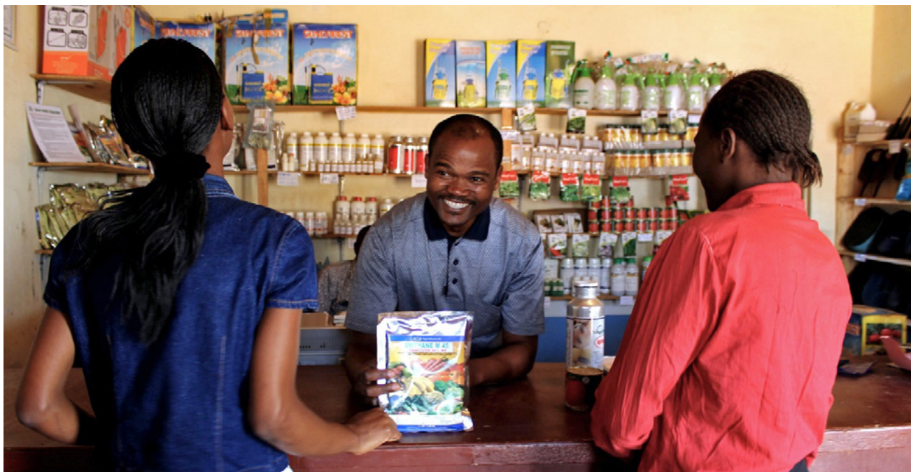
Un agro distribuidor en Malawi