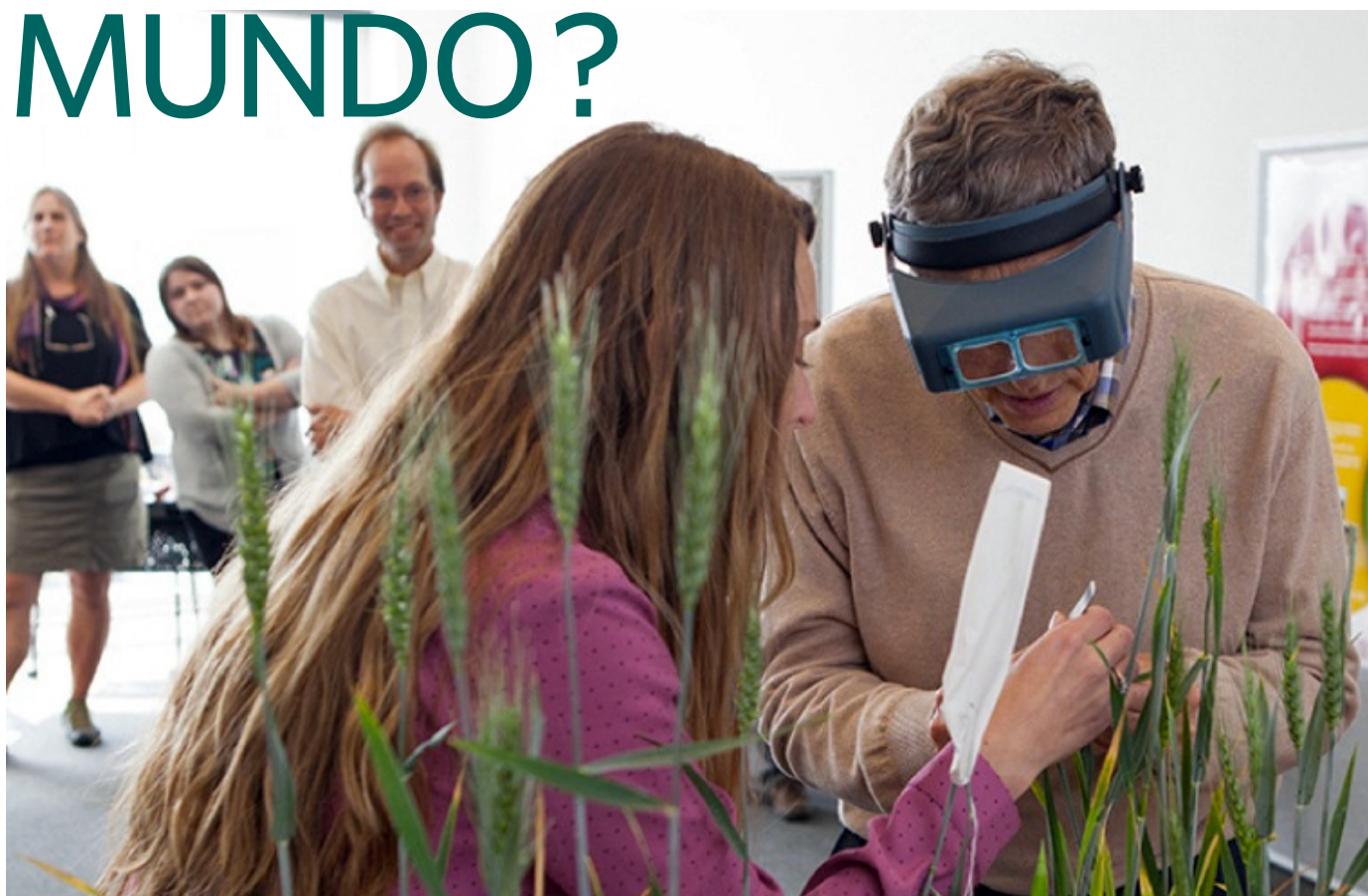
Bill Gates en la Universidad de Cornell intentando hacer polinización cruzada de trigo .