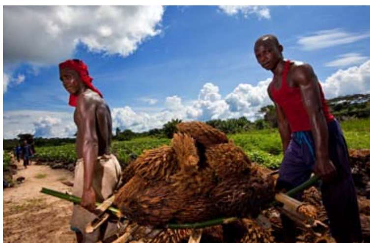
Trabajadores en una plantación de palma aceitera en Lokutu.

Feronia tiene una política de “tolerancia cero” sobre la corrupción. Las garantías operacionales del Banco Africano de Desarrollo sobre el reasentamiento involuntario requiere que sus cliente demuestren que tienen un amplio apoyo de la comunidad para las actividades que los desplazan o los exilian de sus tierras. La institución financiera partera del desarrollo del Reino Unido, mejor conocida como Grupo CDC [antes Commonwealth Development Corporation y antes Colonial Development Corporation], por su parte, tiene un detallado Código de Responsabilidad de Inversiones que exige que se “promuevan las acciones correctivas apropiadas” cuando cualquiera de sus compañías estén involucradas en cualquier incidente serio que resulte en “un impacto ambiental o social adverso, o el incumplimiento material de las leyes relacionadas con materias ambientales, sociales o integridad de los negocios”.