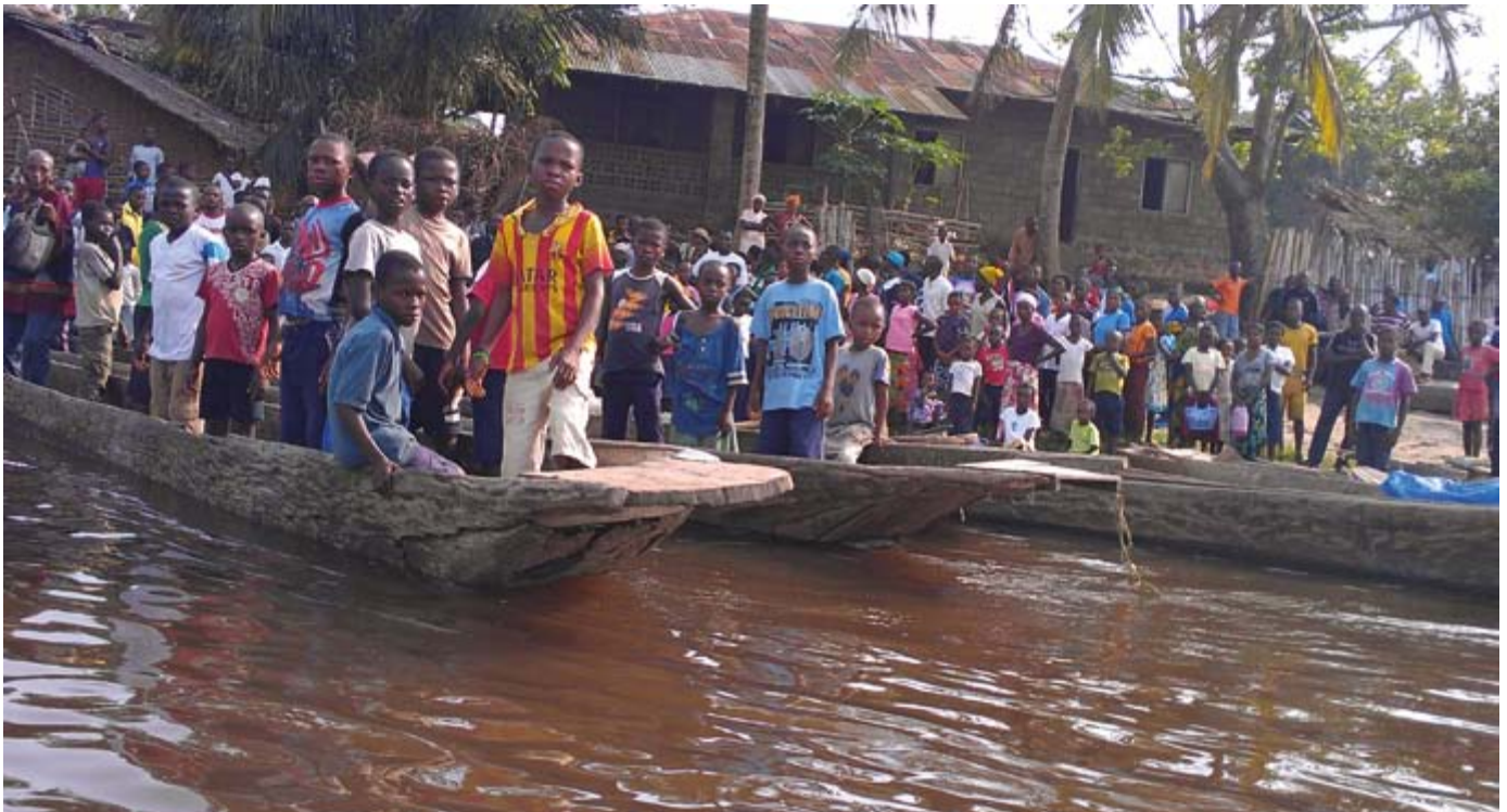
Niños en el desembarco de Lokutu en el río Congo.

Agencias de desarrollo de Estados Unidos y Europa financian una nueva ola de colonialismo en la RDC