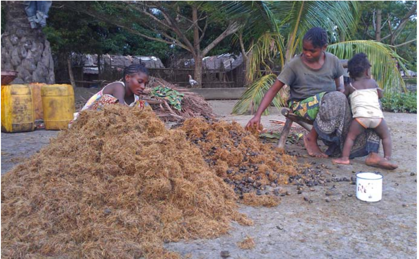
Producción artesanal de aceite de palma en Yalifombo: escogiendo granos de palma.

deudas, conocido como “ikotama”, para forzar a los trabajadores a laborar los fines de semana y en días de descanso para pagar los altos intereses de sus deudas.