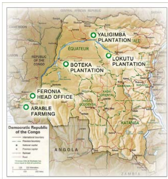
Mapa de las plantaciones y fincas de Feronia