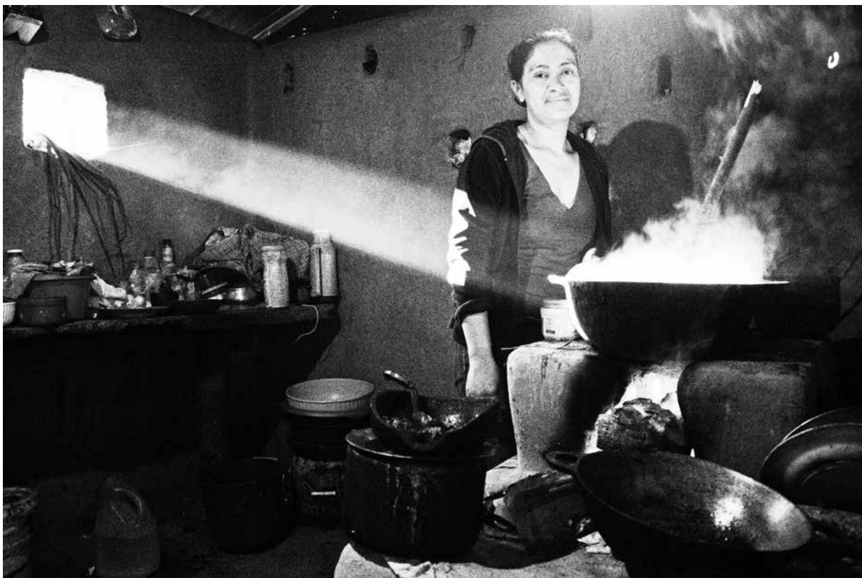
Algún lugar de Nicaragua