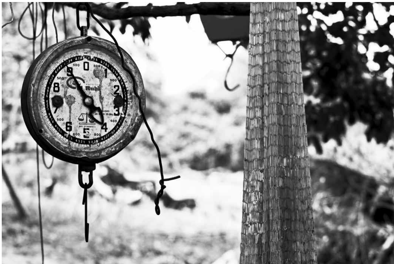
Vereda La Guajira Tibú, Colombia.

Recompensar a las grandes compañías con derechos de propiedad exclusivos ha impulsado la consolidación de la industria semillera, y hoy tres firmas—Monsanto, DowDupont y Syngenta— controlan la mayoría del mercado de semillas transgénicas, y continúan la compactación del mercado.