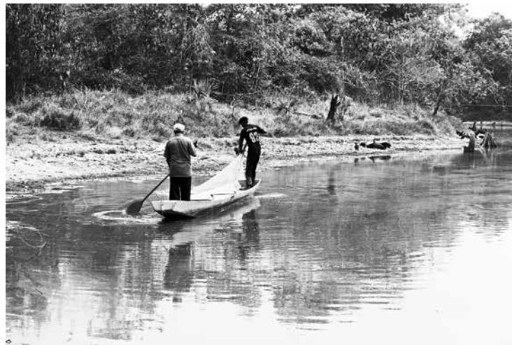
Vereda La Guajira Tibú, Colombia

En el ataque dos Sin Tierra fueron asesinados, siete resultaron heridos —aunque el número exacto aun no fue confirmado—, y dos fueron detenidos para declarar y ya fueron liberados. El local donde ocurrió la emboscada fue aislado por la policía, impidiendo a los familiares de las víctimas, abogados y periodistas, amenazando a las per-