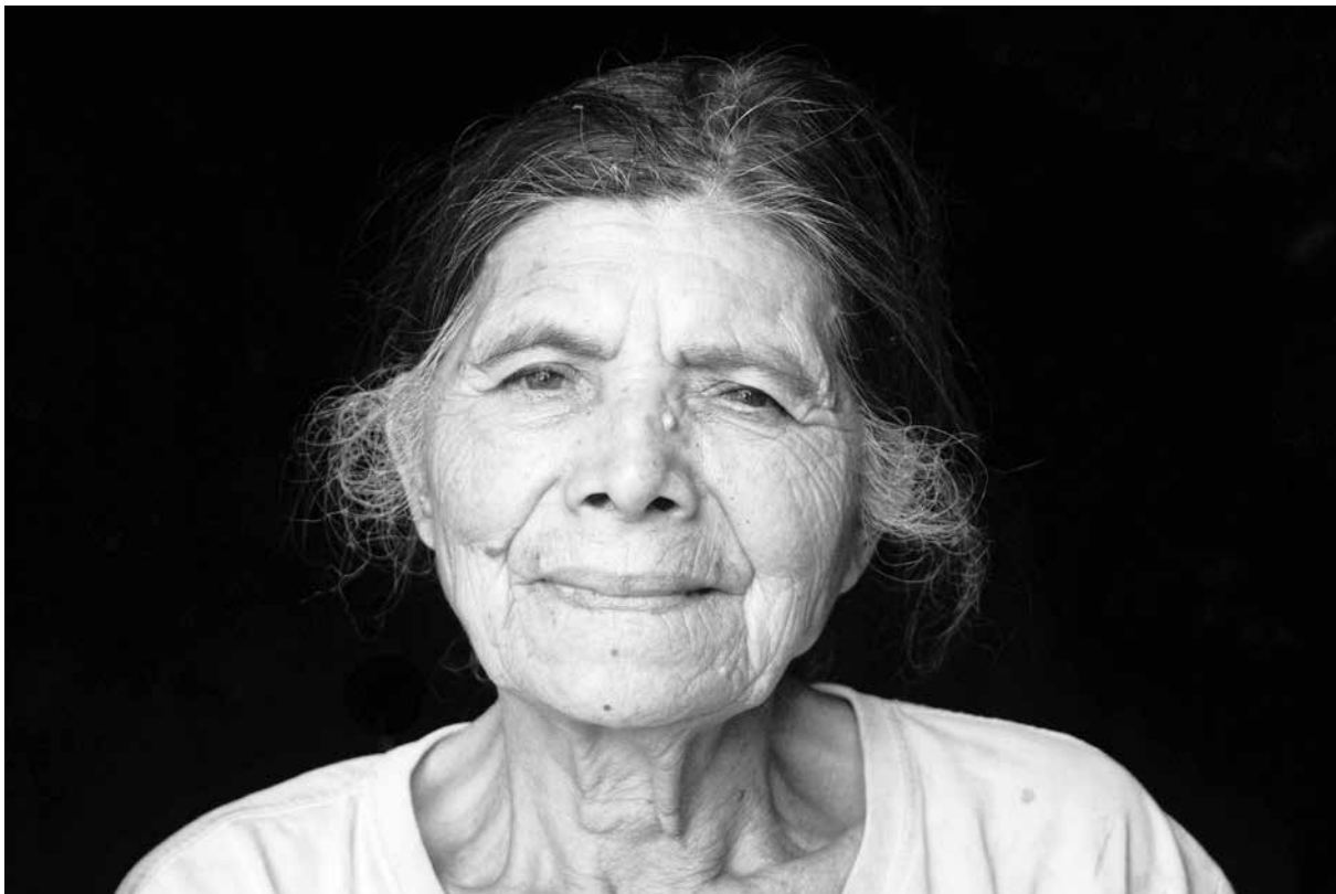
Algún lugar de Nicaragua

de bienes para el intercambio. La mujer, expulsada del universo económico creador de plusproducto, cumplió no obstante una función económica fundamental. La división del trabajo le asignó la tarea de reponer la mayor parte de la fuerza de trabajo que mueve la economía, transformando materias primas en valores de uso para su consumo directo. Provee de este modo a la alimentación, al vestido, al mantenimiento de la vivienda, así como a la educación de los hijos. Este tipo de trabajo, aun cuando consume muchas horas de rudo desgaste, no ha sido considerado como valor. La que lo ejerció fue marginada por este hecho de la economía, de la sociedad y de la historia. El producto invisible del ama de casa es la fuerza de trabajo”. 5