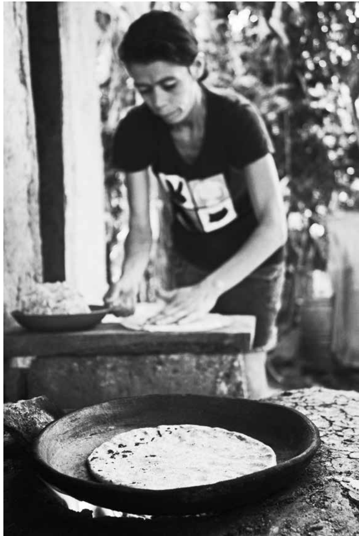
Algún lugar de Nicaragua

Están pensando en modos de acceso a la tierra que partan del reconocimiento a las luchas históricas de las mujeres por garantizar un modo de vida que no arrase con la cultura y la identidad de los pueblos, y que no acepta la destrucción de los bienes comunes en pos de las gigantescas ganancias del agronegocio y del capitalismo mundial.