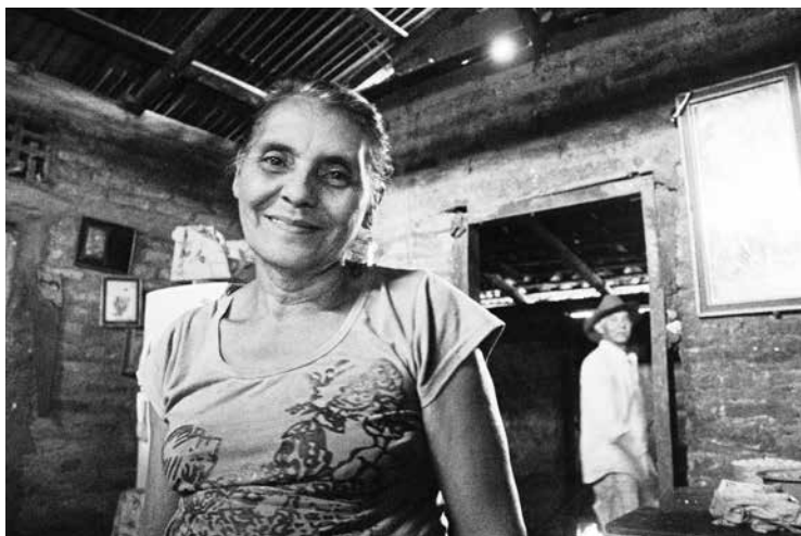
Algún lugar de Nicaragua

urbanas, todo lo que se denomina pequeña producción, pero que sólo disponen cerca del 20% de la tierra. Mientras tanto la publicitada agricultura industrial usa el 80% de la tierra, y el 80% de toda el agua y los combustibles que se usan en la agricultura 3 . Esto desmiente los mitos de la “Revolución Verde”, que generó la creencia de que el agronegocio, los transgénicos y el uso masivo de agroquímicos