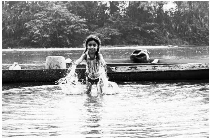
Vereda Tres Bocas Catatumbo, Colombia.