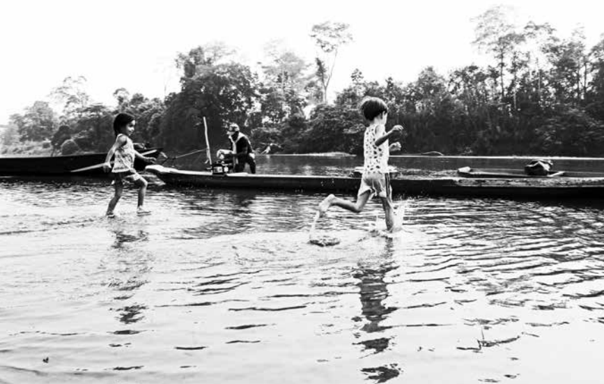
Vereda Tres Bocas Catatumbo, Colombia

Esta vez hemos querido compartir con ustedes varios pronunciamientos que tienen una vigencia surgida de la legitimidad de sus miradas, en momentos en que por todo el mundo se desatan agravios y ataques directos contra la integridad de la vida, los saberes, los territorios, las semillas. Estas declaraciones son en mucho resúmenes de visiones y reflexiones que provienen de varias regiones y que se articulan buscando coincidencia de posturas, para cuestionar, reivindicar, presionar, impugnar o denunciar los atropellos continuos de que son objeto personas, comunidades, pueblos enteros.