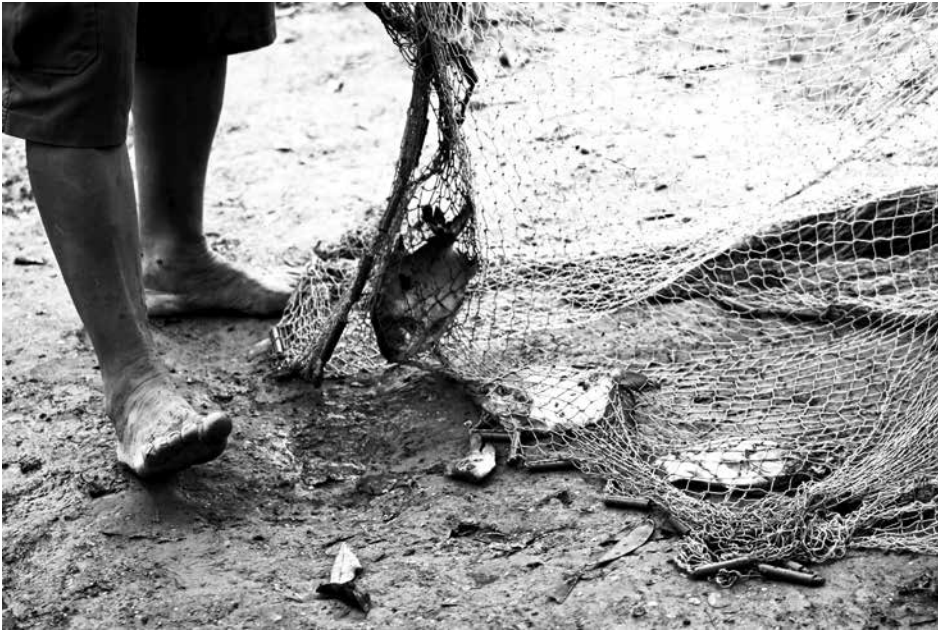
Vereda La Guajira Tibú, Colombia

(JMPR), se reúne periódicamente para examinar los residuos de plaguicidas en los alimentos y otros aspectos analíticos, para estimar los niveles máximos de residuos, y para revisar los datos toxicológicos y estimar la ingesta diaria admisible (IDA) para los seres humanos”. La idea del grupo es emitir recomendaciones que pasan al Codex Alimentarius de la FAO/OMS que supuestamente “armoniza las normas alimentarias internacionales, para proteger la salud de los consumidores y promover prácticas equitativas en el comercio de alimentos, pero en realidad el énfasis está más en el comercio que en la salud.”