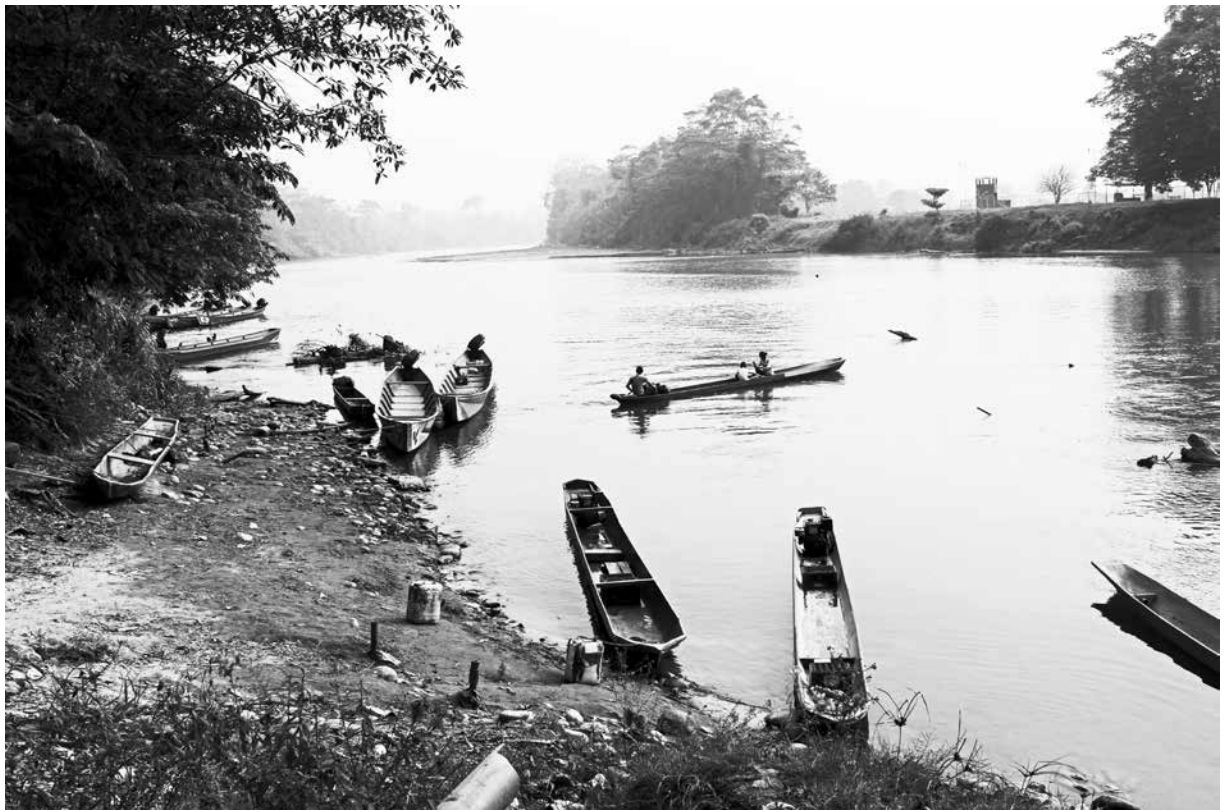
Vereda Tres Bocas Catatumbo, Colombia

Tememos que la versión objeto de consulta sea muy diferente que la ley elaborada por la Conferencia Plurinacional e Intercultural de Soberanía Alimentaria (Copisa), en la que, entre otras cosas, se establece como obligación del Estado promover los sistemas autónomos de semilla campesina y nativa, regular la semilla industrial y prohibir la se-