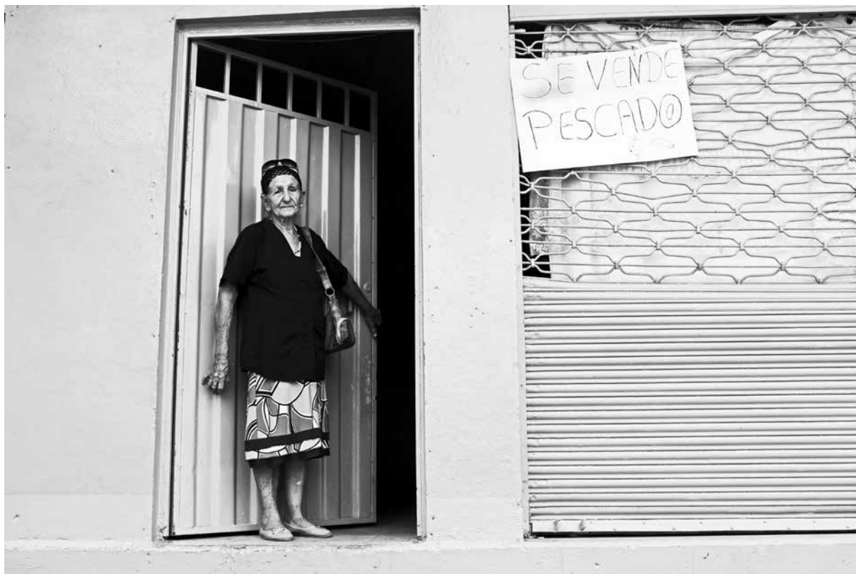
Vereda Tres Bocas Catatumbo, Colombia

una generación de niños ha crecido como palestinos, entre retenes hostiles, balaceras, toques de queda, operativos policíacos e incursiones de bandas asesinas. Pero estos niños también nacieron en regiones o pueblos donde sus padres y abuelos ya venían organizándose y resistiendo, agotando las vías legales y legítimas. Donde la idea de autonomía (autodeterminación, soberanía comunal) está viva y encuentra cómo manifestarse. Hermann Bellin-ghausen, “Cuando la conciencia es colectiva y hace comunidad”, Postales de la Revuelta, columna de Desinformémonos, 19 de junio, 2016.