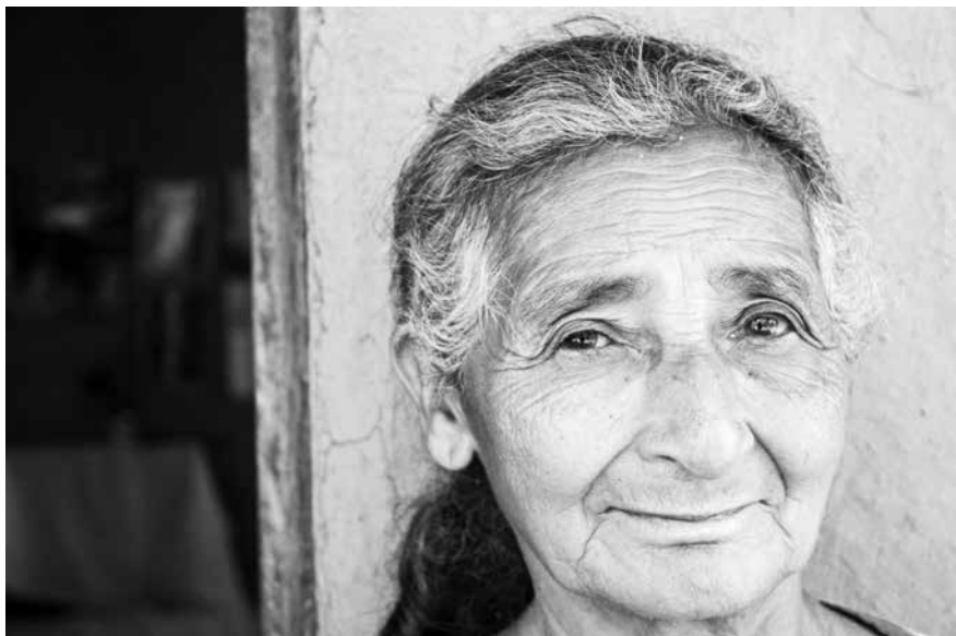
Algún lugar de Nicaragua