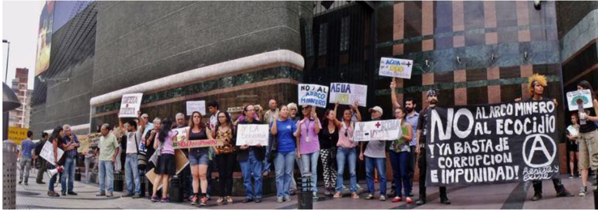
Imagen No. 10 Parte de los diseños de la campaña contra el AMO.

Imagen No.9 Protesta contra el AMO frente al Ministerio de Finanzas, 22 de Julio de 2016.