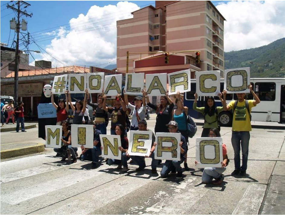
Imagen No.4. Voceros de las Organizaciones indígenas COIAM y ORPIA se movilizan hacia Caracas para protestar contra la minería ilegal y se pronuncian sobre el AMO.