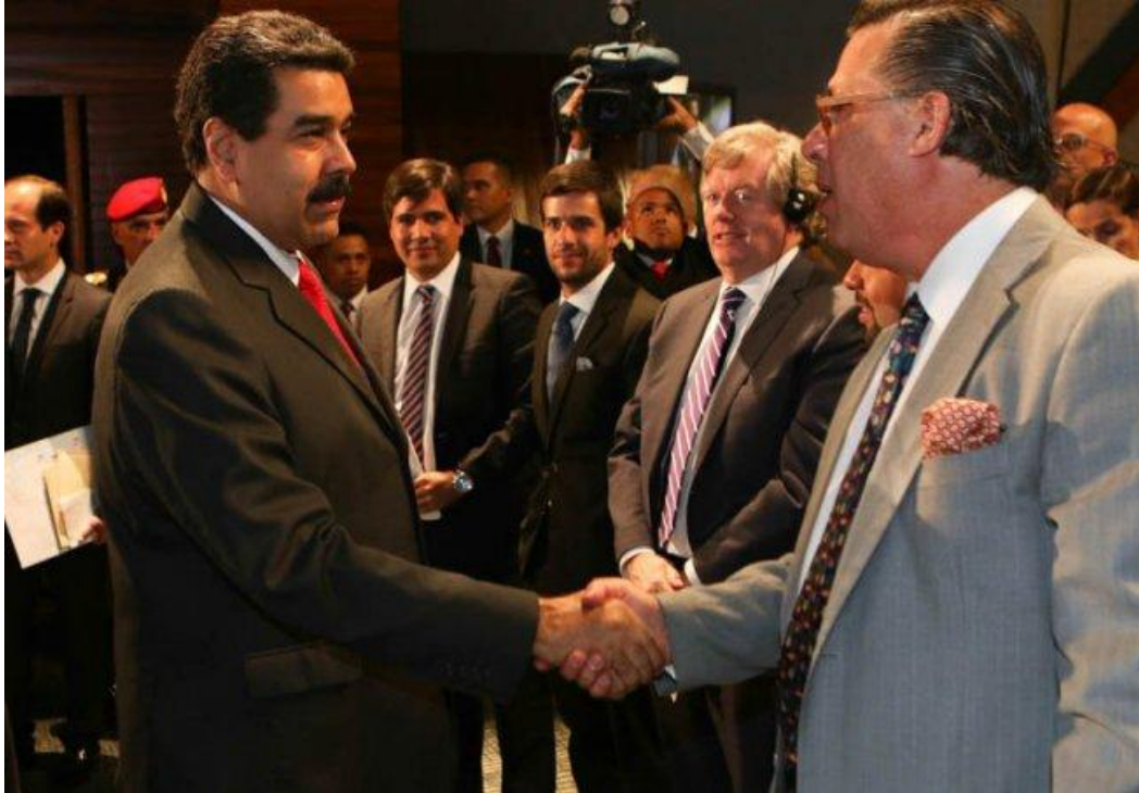
Imagen No.8 Expresiones de apoyo Internacional a la lucha contra el Arco Minero.