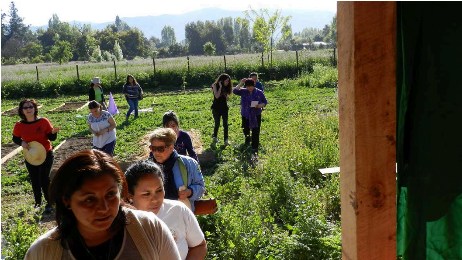
Fotos de la publicación de Escuela Nacional de Agroecología, IALA, Chile. ANAMURI