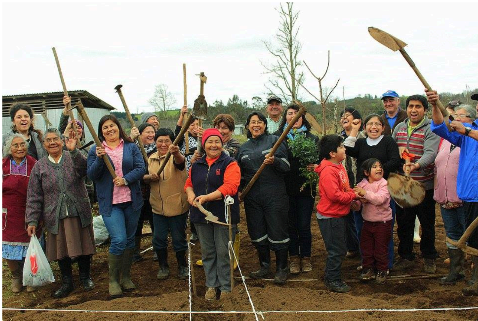
Jornada y Taller de Agroecología y Diseño de Huertas en Geometría Sagrada en Tierras del Fvtawillimapu, Purranque.