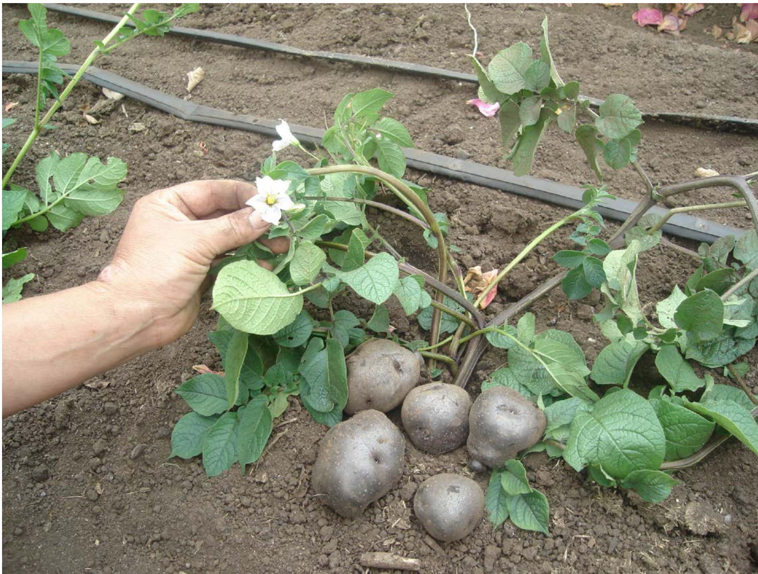
Producción de papas, Asociación de Agricultores Orgánicos de Chiloé, Ancud.