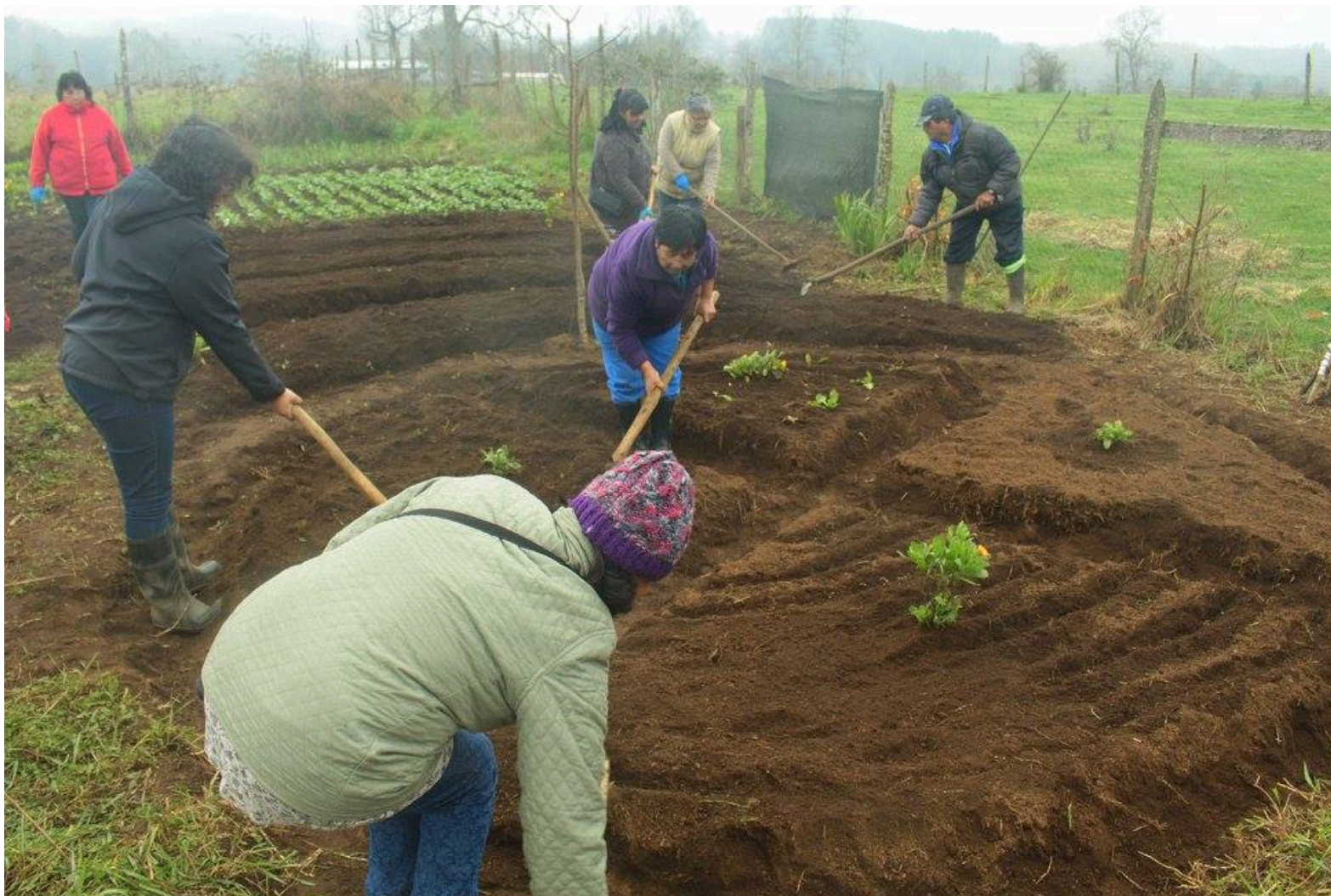
Jornada y Taller de Agroecología y Diseño de Huertas en Geometría Sagrada en Tierras del Fvtawillimapu, Purranque.