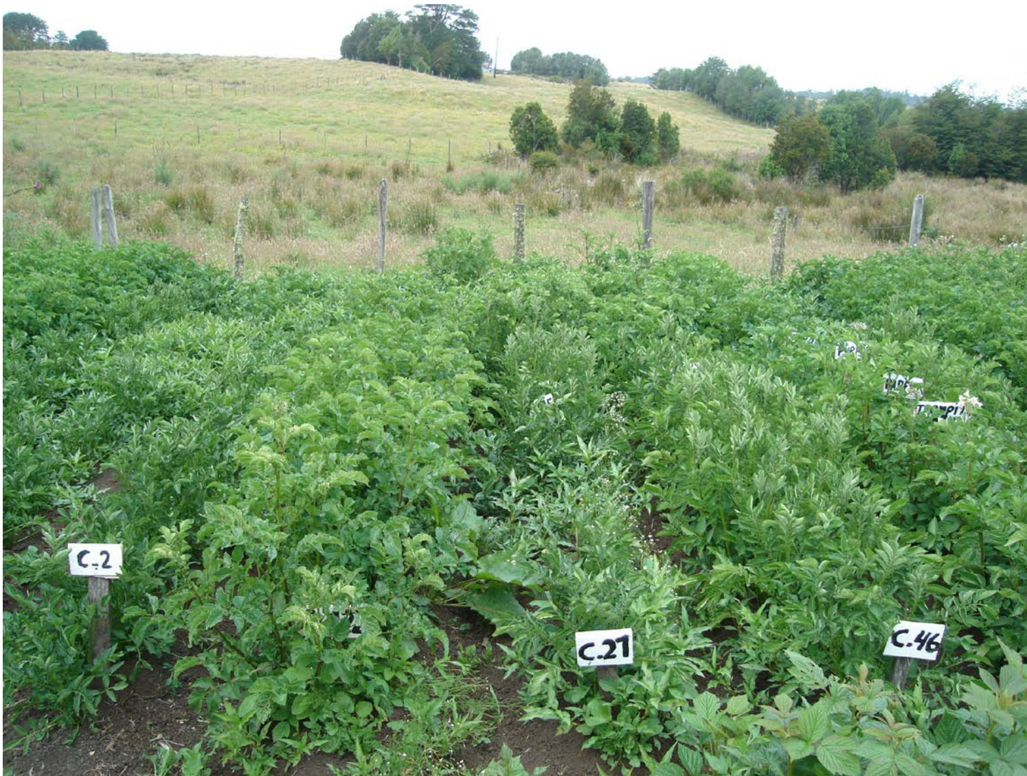
Producción de papas, Asociación de Agricultores Orgánicos de Chiloé, Ancud.