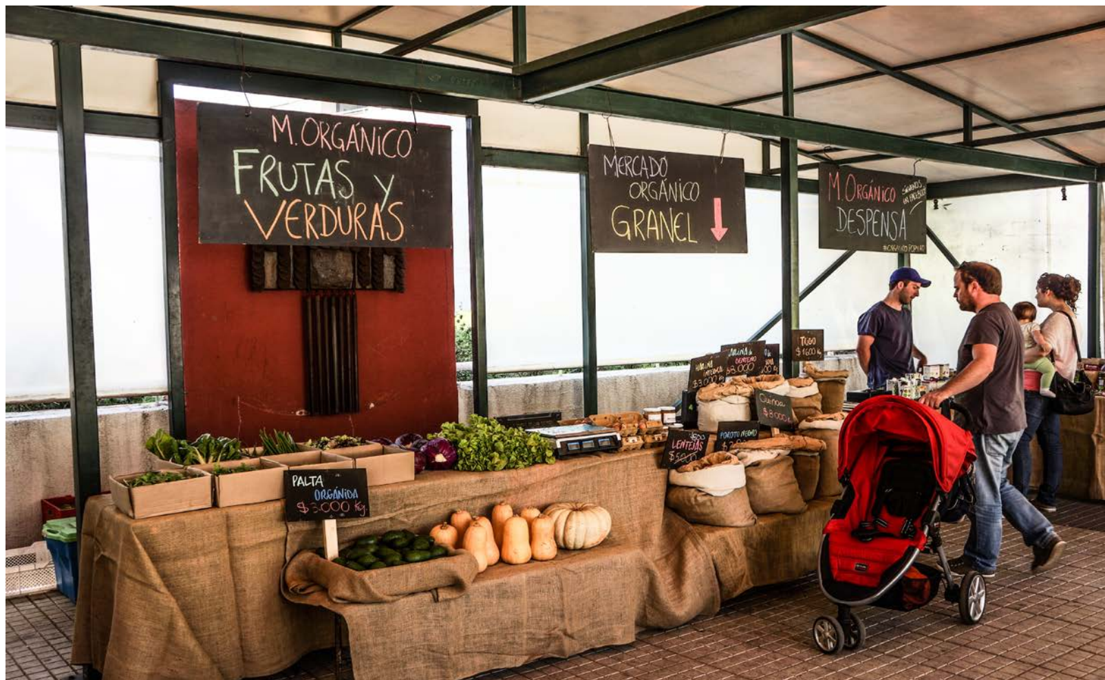
Mercado Orgánico Plaza Perú, Las Condes.