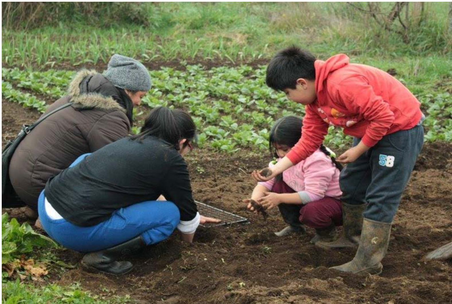
Jornada y Taller de Agroecología y Diseño de Huertas en Geometría Sagrada en Tierras del Fvtawillimapu, Purranque.