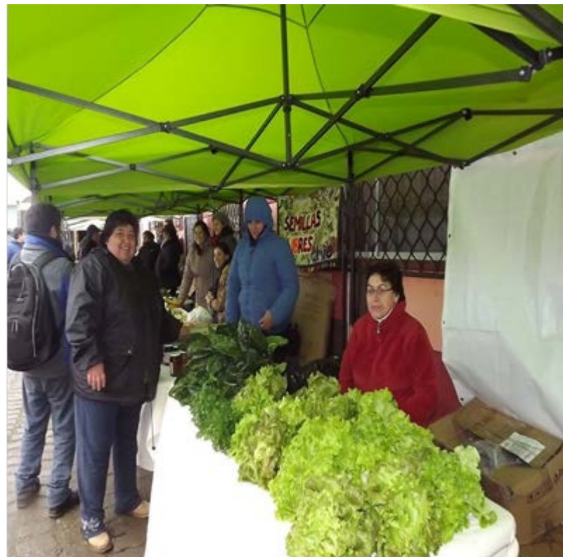
Mercados de la Tierra, región de Los Ríos.