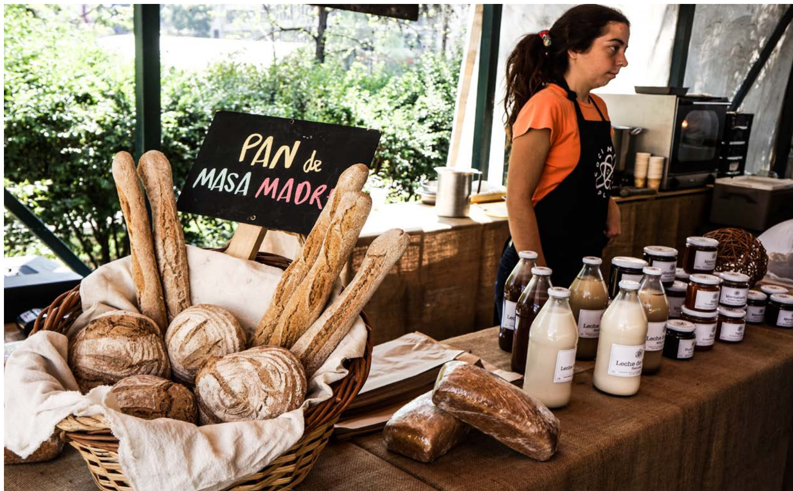
Mercado Orgánico Plaza Perú, Las Condes.