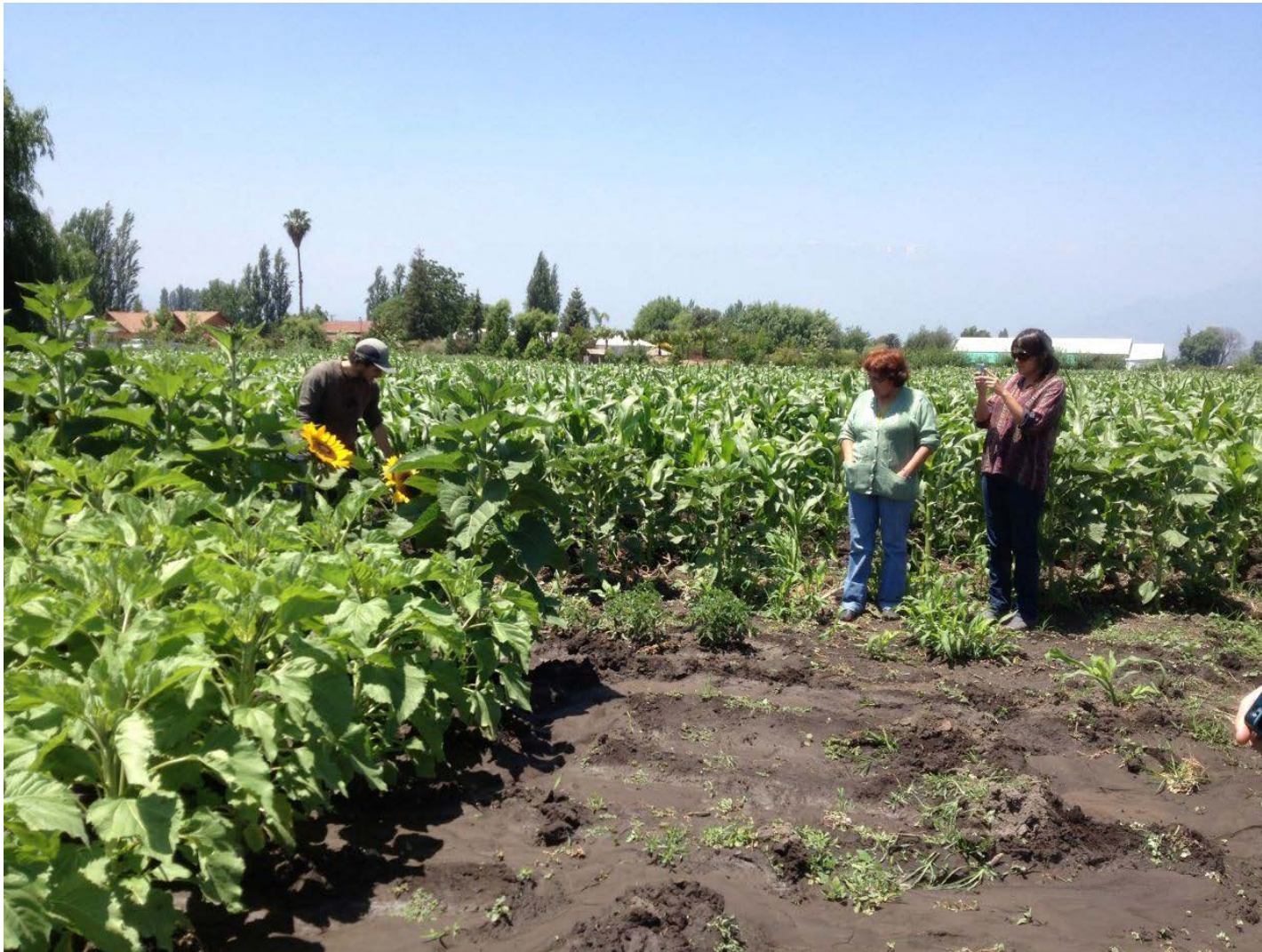
región central