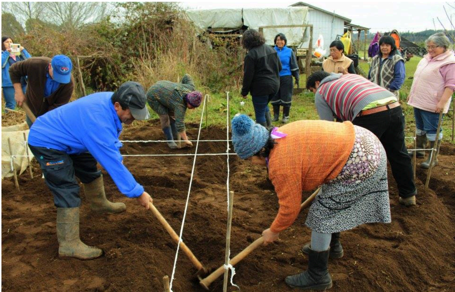
Jornada y Taller de Agroecología y Diseño de Huertas en Geometría Sagrada en Tierras del Fvtawillimapu, Purranque.