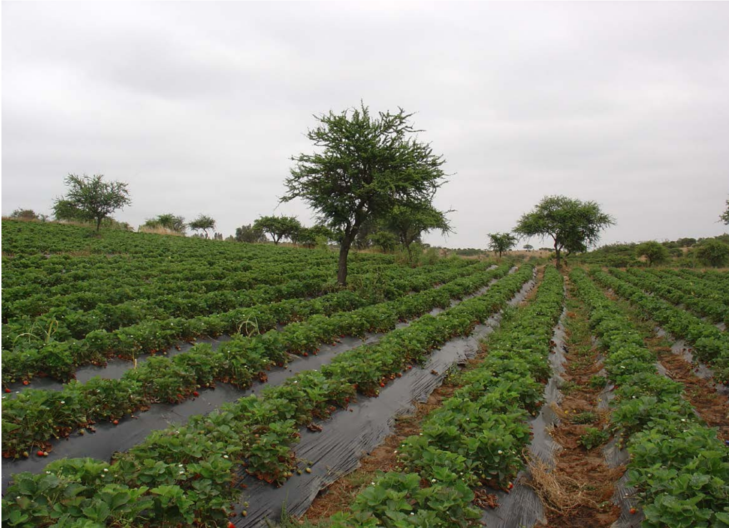
Cultivo orgánico de frutillas, María Pinto.