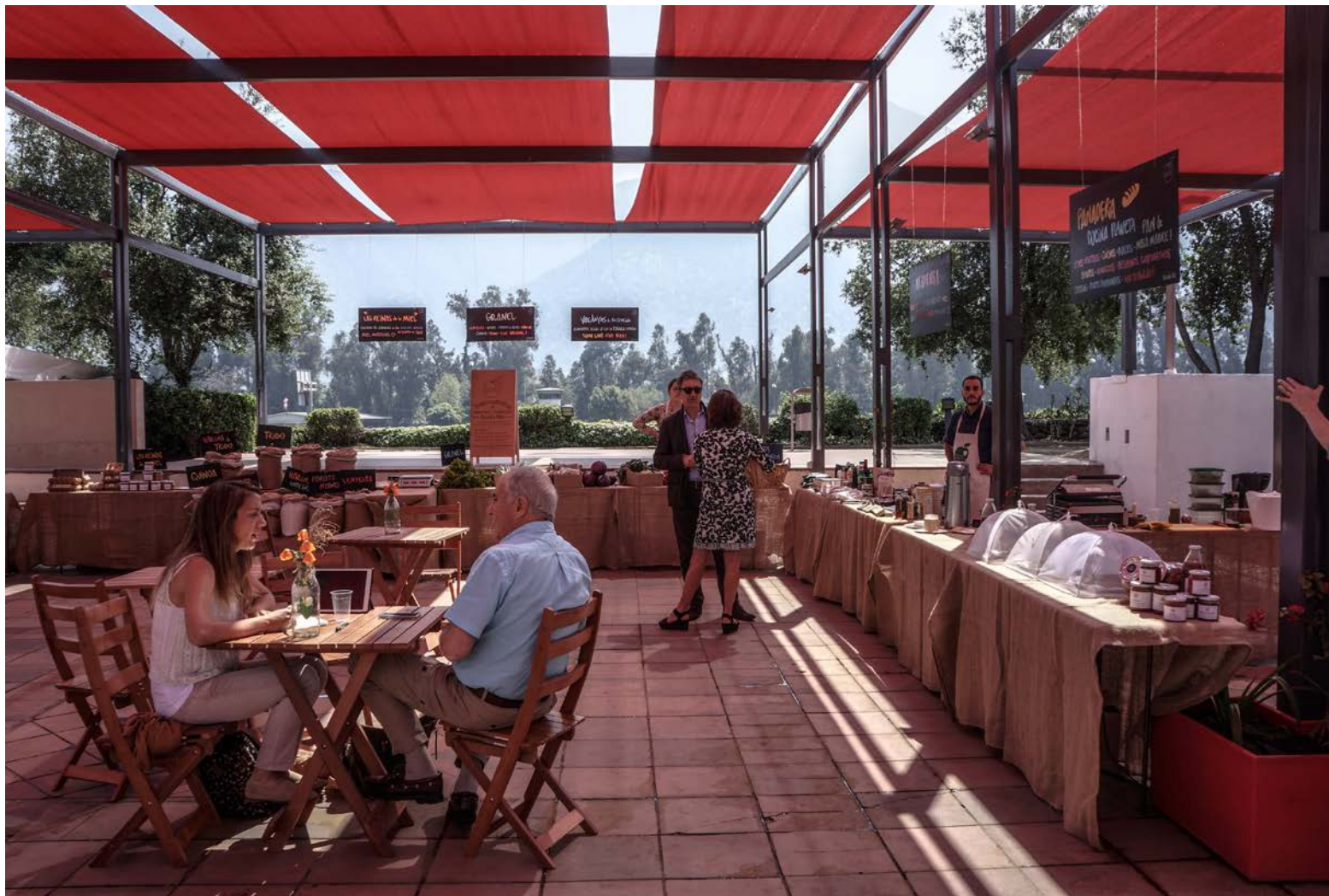
Mercado Orgánico Borde Río, Vitacura.