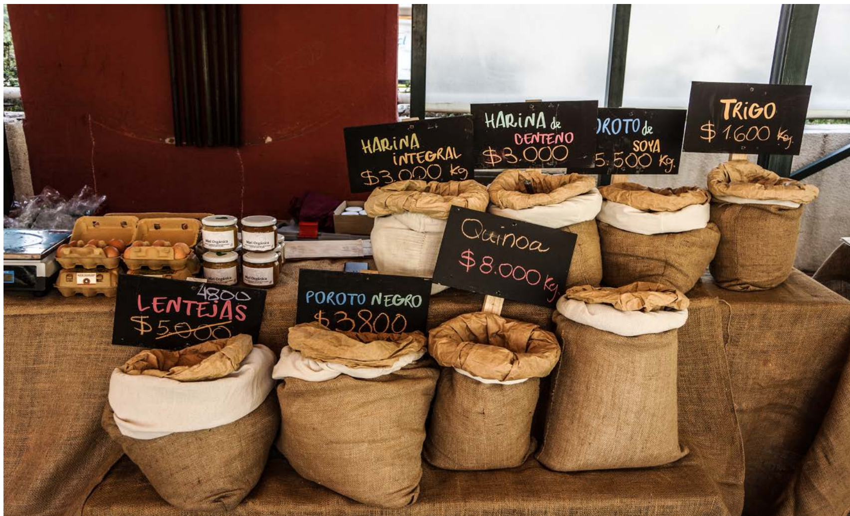
Mercado Orgánico Plaza Perú, Las Condes.