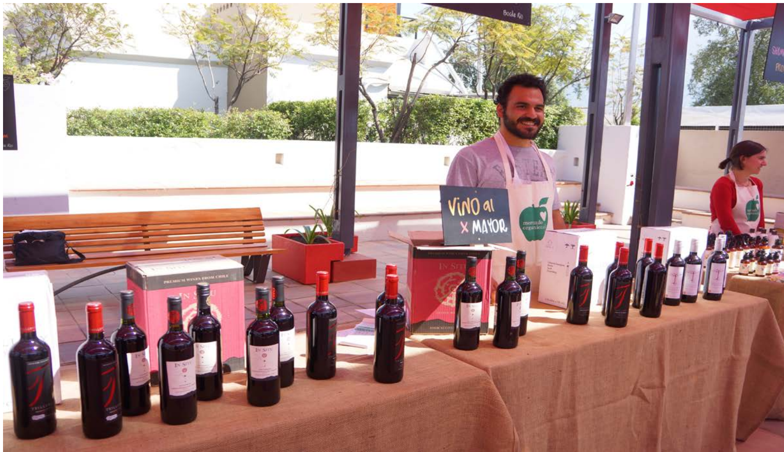
Mercado Orgánico Bordo Río, Vitacura.