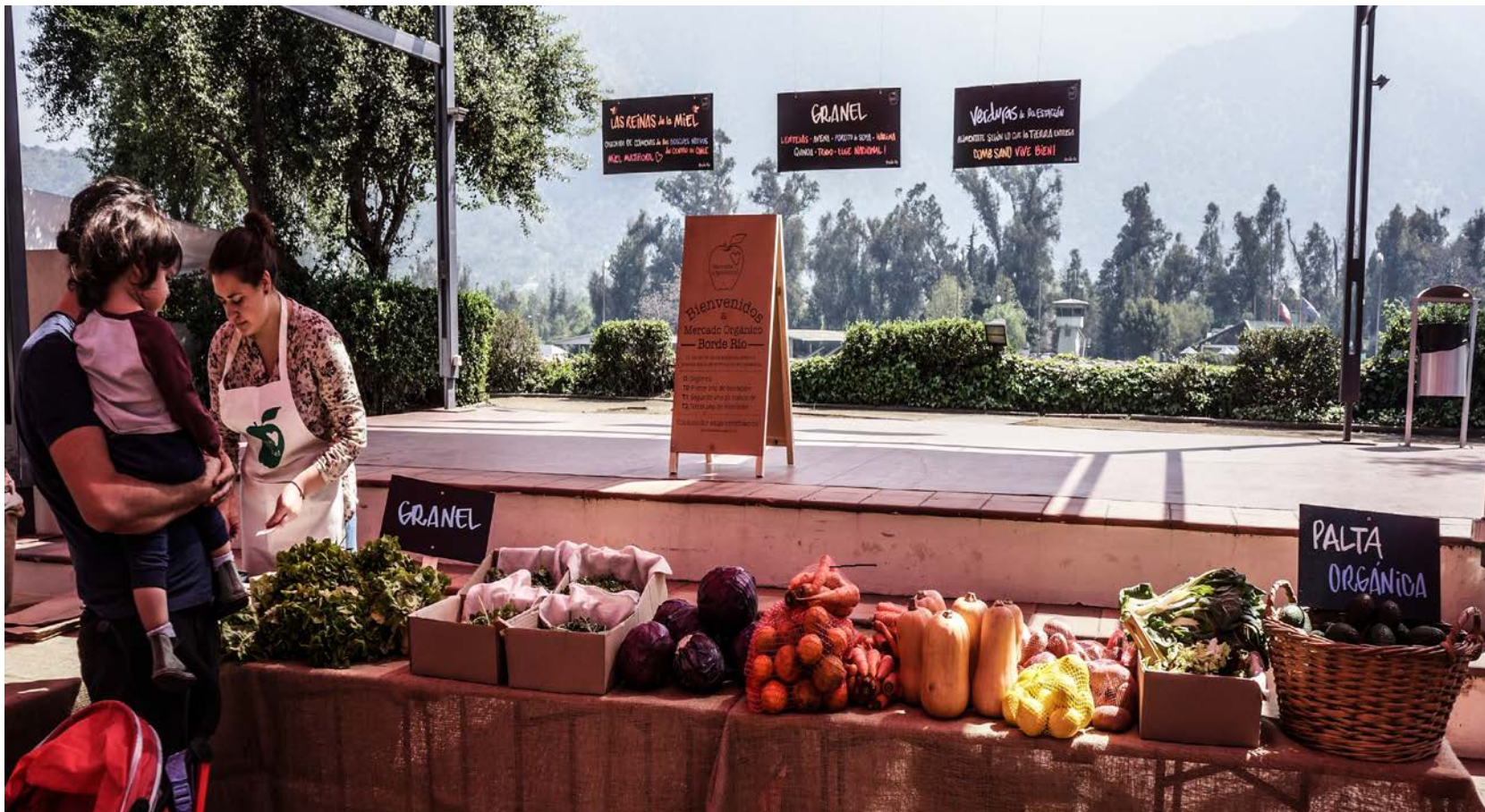
Mercado Orgánico Borde Río, Vitacura.