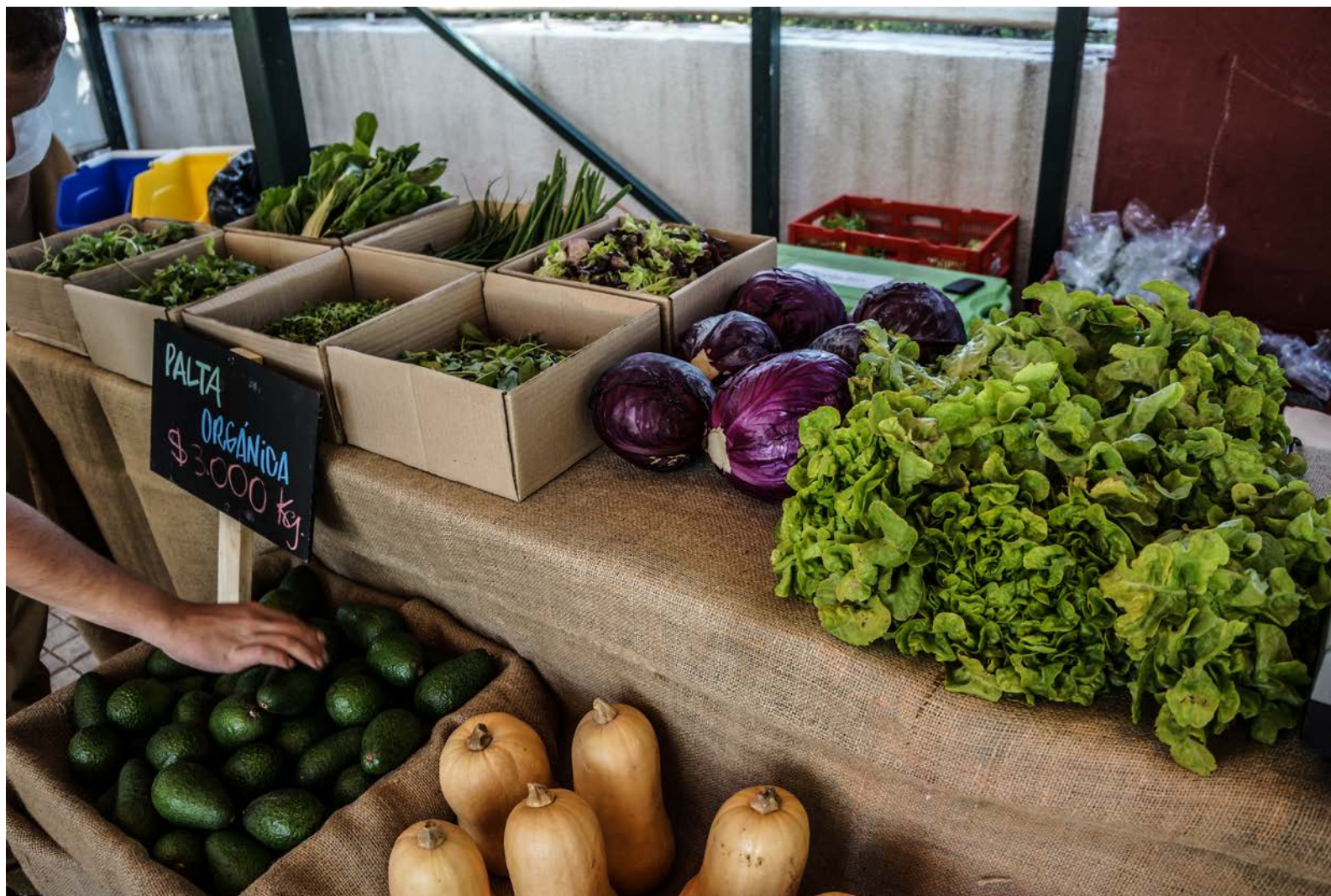
Mercado Orgánico Plaza Perú.