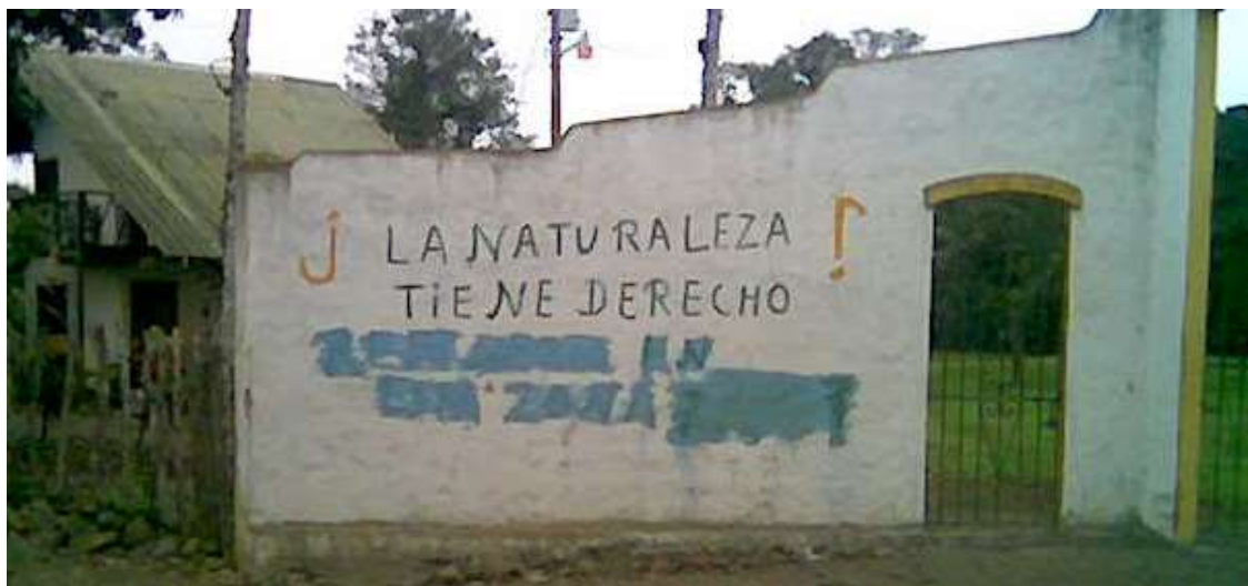
Foto: grafiti en el Aromo, costa ecuatoriana

¿Se puede realmente romper el paradigma dominante, occidental-colonial, que mira a la naturaleza como recursos a ser explotados o como un espacio a ser dominado y controlado, con una herramienta en un sistema legal o de justicia que proviene y está intrínsecamente ligado a un pensamiento que pertenece al mismo paradigma?