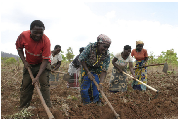
Campesinos trabajando la tierra, Mozambique. De Nick Pajet

A pesar de las presiones políticas y económicas a las que se enfrentan, las personas continúan gestionando y fomentando los ecosistemas de su entorno para garantizar el suministro de alimentos. Durante miles de años, las campesinas y campesinos, pastoras y pastores y otras personas que viven de la tierra y del mar, han desarrollado y definido sistemas agrícolas y pesqueros resilientes, variedades de cultivos y razas de animales que aseguran su continuidad y sostenibilidad a largo plazo.