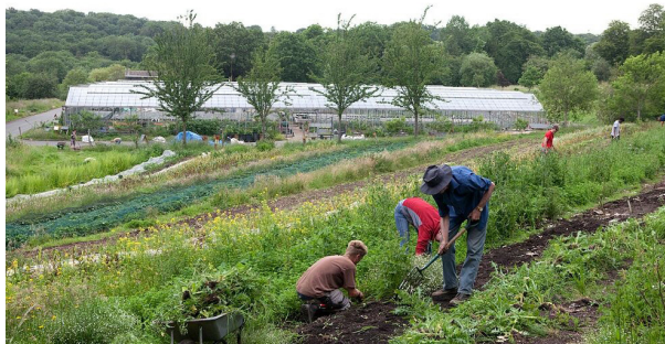
Organiclea: Trabajadores co-operativos en Londres, Reino Unido.

Internacional sobre Agroecología que sirve como una definición del término;