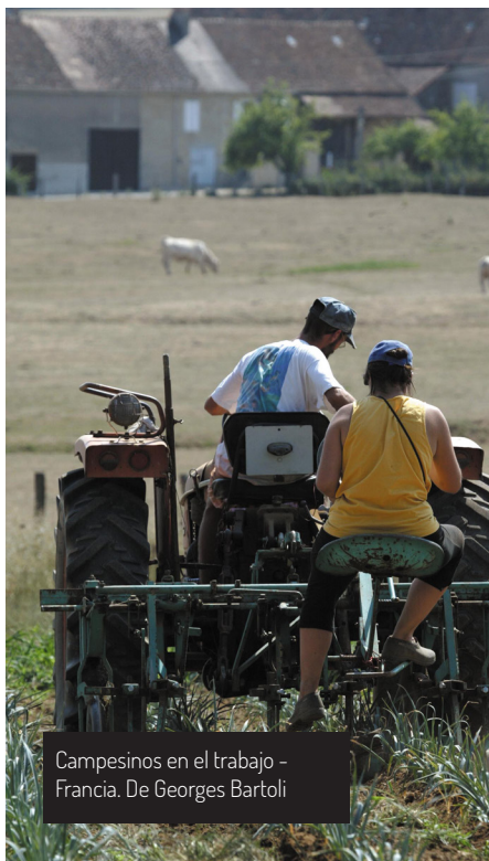
Campeños en el trabajo - Francia.