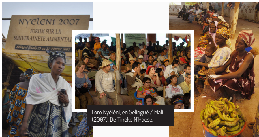
Foro Nyéléni, en Selingué / Mali (2007). De Tineke N'Haese.

ambientalistas, movimientos de mujeres y demás grupos. Esta diversidad también se reflejó en los seis sectores representados en el foro: pequeños agricultores y pequeñas agricultoras, pescadores y pescadoras, pastores y pastoras, pueblos indígenas, trabajadores y trabajadoras migrantes y movimientos urbanos y de consumidores y consumidoras.