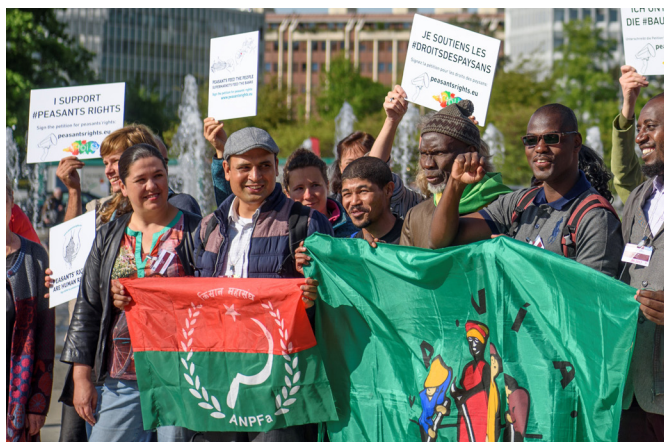
Manifestación por la Declaración de los derechos de los campesinos, en Ginebra (Mayo 2017). De Eric Roset