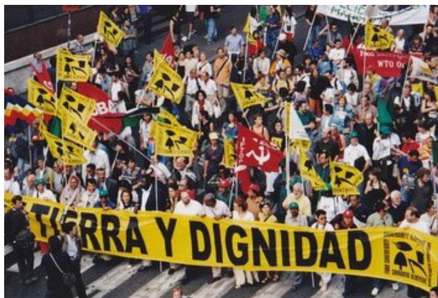
Manifestación por la tierra y la dignidad con el CIP en Rome (2002).