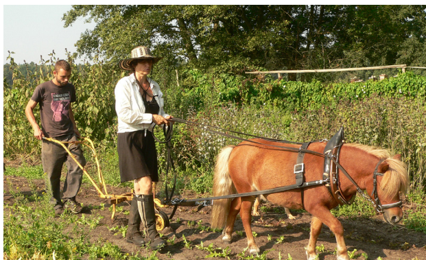
Bienenwerder: la agricultura colectiva en Alemania. OLiB Archivos e.V

La agricultura debería ser una profesión respetada donde los agricultores y agricultoras puedan asegurar su modo de vida con su producción en un medio rural próspero y vivo. Sólo así el trabajo agrario podrá ser atractivo para los agricultores y las agricultoras jóvenes. Para conseguir esto, habría que dar un giro radical a los programas de enseñanza agrícola y a los organismos responsables de investigación, desarrollo y formación, así como ampliar el apoyo al desarrollo rural, social y económico.