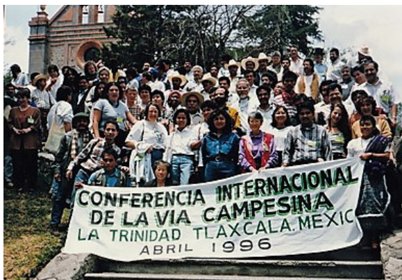
Segunda Conferencia Internacional de LVC en Tlaxcala/México (1996), donde la soberanía alimentaria fue discutida por primera vez.

la transformación de la gobernanza internacional en torno a los alimentos y la agricultura.