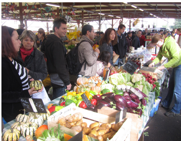
Mercado de agricultores en Francia. Archivos de Campañas de Solidaridad

La Soberanía Alimentaria implica usar las medidas comerciales, subsidios y apoyos para construir sistemas alimentarios y agrícolas basados en el interés de la ciudadanía europea, sin efectos negativos en terceros países. La UE ya aplica medidas comerciales, apoyos y subsidios, aunque muchos de ellos están dirigidos a mantener el modelo agroindustrial de producción agrícola que está dañando a las personas y al planeta.