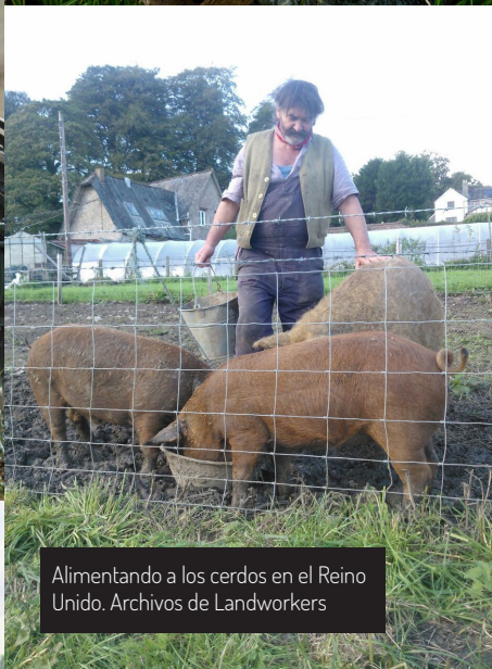
Alimentando a los cerdos en el Reino Unido. Archivos de Landworkers