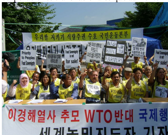
Manifestación contra la OMC y por la Soberanía Alimentaria en Corea (enero de 2003).

control sobre la producción, la distribución y el comercio de alimentos.