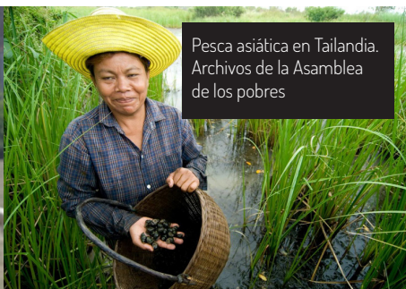
Pesca asiática en Tailandia. Archivos de la Asamblea de los pobres