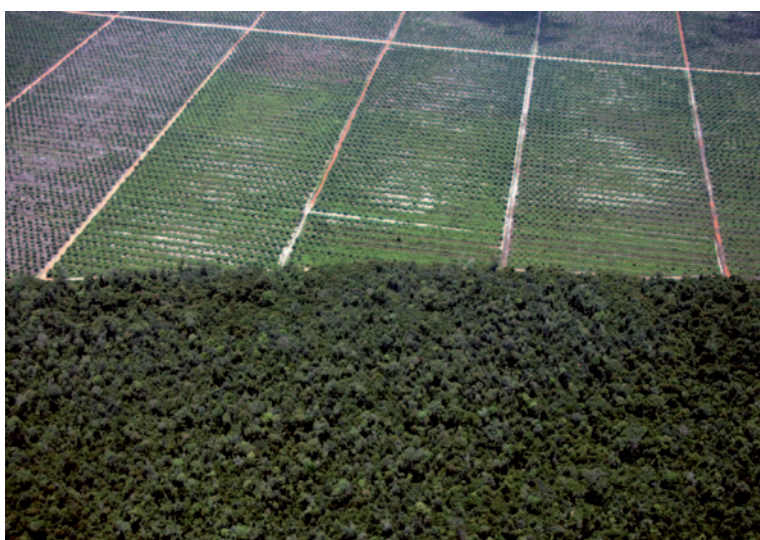
Las plantaciones de palma son una de las principales causas de deforestación en Indonesia.

Las compañías de palma aceitera tienden a ocupar las tierras más favorables para el crecimiento de dicha planta, y no “tierras degradadas y praderas que han perdido su valor ambiental y económico como resultado de la explotación forestal intensiva y otras actividades humanas que dejan el suelo expuesto a la lluvia y la erosión por el viento, reduciendo así su productividad”. 1 La fertilidad del suelo y la disponibilidad de agua son factores determinantes para elegir dónde establecer las plantaciones. Entre las tierras preferidas figuran los bosques, que son destruidos masivamente, a pesar de ser ecosistemas de importancia fundamental para el bienestar físico y cultural de las poblaciones locales que de ellos dependen.