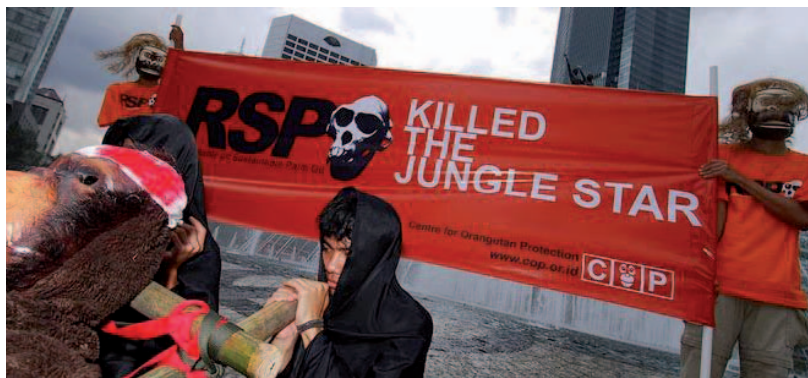
Portestas en ocasión de la reunión anual de la RSPO, Jakarta, Indonesia.

La Mesa Redonda para el de Aceite de Palma Sostenible (RSPO) definió una serie de principios y criterios que debe respetar toda empresa para poder afirmar que produce “aceite de palma sostenible”. Sin embargo, la RSPO adolece de problemas estructurales que vuelven imposible el cumplimiento de esa promesa. El principal problema es que la mayoría de sus miembros son grandes protagonistas mundiales del sector. Otro problema es que la RSPO no distingue entre operaciones de diferente escala, y aplica los mismos criterios a una pequeña plantación y a un monocultivo de decenas o cientos de miles de hectáreas, si bien, por definición, esta última no resulta nunca sostenible para la población local y la naturaleza.