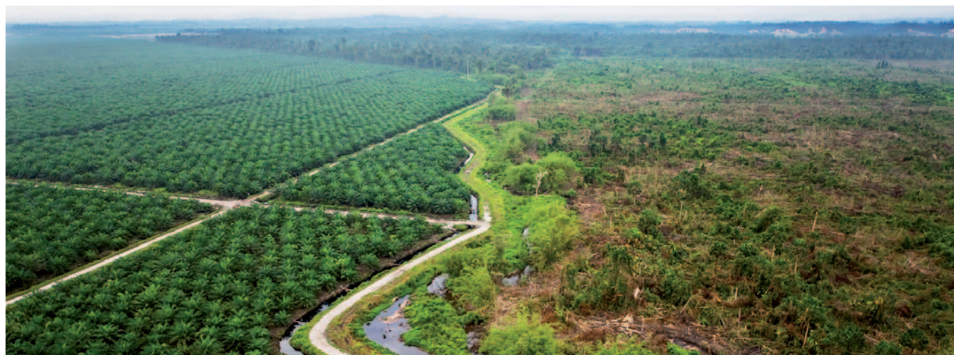
Plantación de palma aceitera al este de Miri, Borneo, Indonesia.

Es necesario que haya alianzas más fuertes entre las comunidades y organizaciones de los países consumidores y las de los países plantadores, para enfrentar más eficazmente la expansión actual de las plantaciones de palma aceitera. Esto implicará, entre otras cosas, denunciar las mentiras y promesas vacías de las compañías de palma aceitera, solidarizarse con quienes defienden los territorios y bosques de los que dependen las comunidades de países asiáticos, africanos y latinoamericanos, y que están en peligro de ser invadidos por plantaciones de palma aceitera. También será necesaria la solidaridad de quienes promueven modelos diferentes de producción y consumo, no basados en una destrucción aún mayor de los bosques y medios de vida de los pueblos del Sur.