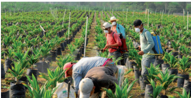
Trabajadores rurales fumigan con agrotóxicos un vivero de palma aceitera. Departamento de Alta Verapaz, Guatemala.

Todo monocultivo depende de agrotóxicos y fertilizantes para garantizar el alto rendimiento que buscan las compañías. Incluso esa cantidad supuestamente “mínima” 4 puede tener impactos significativos en los habitantes de la zona. Principalmente los agrotóxicos -aunque también los fertilizantes- utilizados en las plantaciones contaminan el agua de la que depende la población. Además, también las plantas procesadores son fuente de contaminación: el efluente llamado POME (Palm Oil Mill Effluent) contamina los ríos y arroyos donde la gente obtiene agua para beber, bañarse y lavar la ropa. Cuando las plantaciones se expanden, el volumen de frutos de palma procesados aumenta y, con él, la contaminación, a veces a tal punto que el agua se vuelve inutilizable.