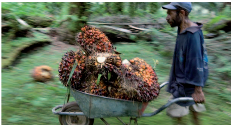
En las plantaciones de palma aceitera, las condiciones de trabajo son muy precarias.

Si bien la mayor parte de las tareas en una plantación de palma aceitera siguen siendo manuales, no pueden competir con la cantidad de trabajo y de empleos que pueden crearse en una pequeña explotación agrícola (y forestal) manejada y controlada por comunidades campesinas.