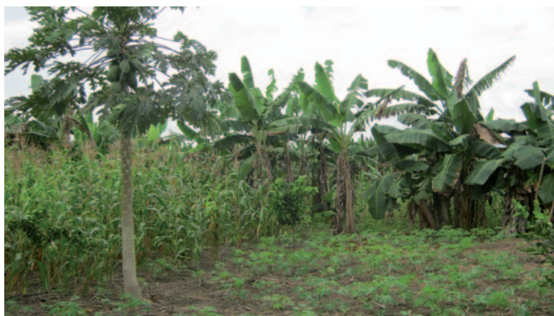
Huerta comunitaria en Comunidad Nueva Vida, Rigores, Honduras.

Aun en los casos en los que las personas ceden su tierra o parte de ella a una compañía de palma aceitera a cambio de una indemnización que consideran adecuada, sigue existiendo el riesgo de inseguridad alimentaria futura: si hubieran conservado sus tierras, habrían podido seguir plantando productos alimenticios, pero eso ya no es posible. Así, su seguridad alimentaria y la de la región que abastecían se ven comprometidas, ahora y en el futuro, y también la de la región que los agricultores abastecían con los productos que cultivaban. Cuando se despoja a alguien de su tierra, se lo pone en riesgo de pasar hambre en el caso de que no consiga un trabajo o alguna otra alternativa laboral, independientemente de que la indemnización recibida al inicio sea o no adecuada; pero además, como decíamos antes en la respuesta a la 2ª mentira, en la mayoría de los casos el pago es insuficiente.