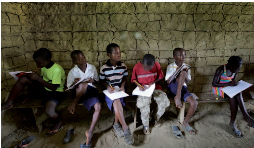
Alumnos estudian en una “escuela” construida por Equatorial Palm en Grand Bassa, Liberia.

A fin de cuentas, es mucho más lo que la compañía gana con las medidas gubernamentales para “atraer inversiones” (concesiones a bajo precio o gratuitas, rebaja de impuestos, subsidios, préstamos a bajo interés, etc.) que lo que gana la comunidad con las iniciativas de la compañía. En Gabón, por ejemplo, el acuerdo entre el gobierno y el productor de palma aceitera Olam incluye exención fiscal durante 16 años, exoneración de IVA y aranceles de aduana para maquinaria e insumos importados, combustible, gas y fertilizantes. 21