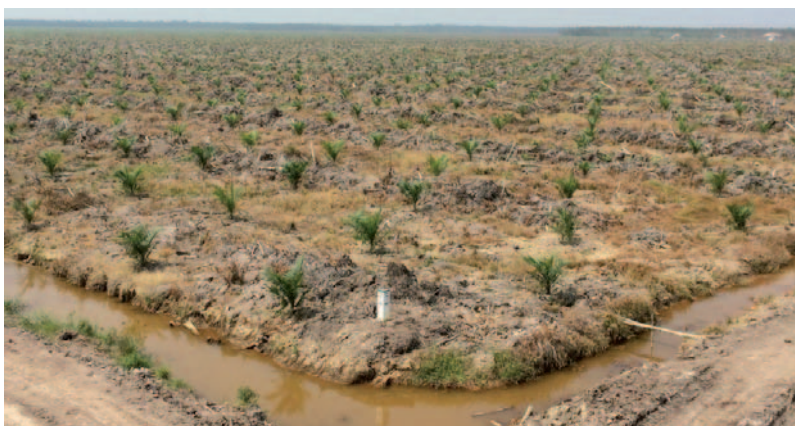
Plantación de palma aceitera en Indonesia.

Según datos de 2010/2011, la India sería ahora el principal importador de aceite de palma, seguido por China y la Unión Europea. No obstante, Europa sigue siendo el mayor consumidor per cápita de aceite de palma y aceites vegetales en general, incluyendo aceite de otras semillas, como la soja y la colza. Esto se debe a su modelo de consumo excesivo que incluye el uso de aceite de palma en una amplia gama de productos de venta en supermercados, mientras que China e India lo usan principalmente para cocinar. El consumo per cápita de aceite vegetal de la UE en 2010 fue 2,6 veces mayor que el de China y 4,5 veces mayor que el de la India 23 . Los objetivos de la UE en cuanto al uso de agrocombustible son también, desde hace algunos años, un factor determinante de consumo de palma aceitera.