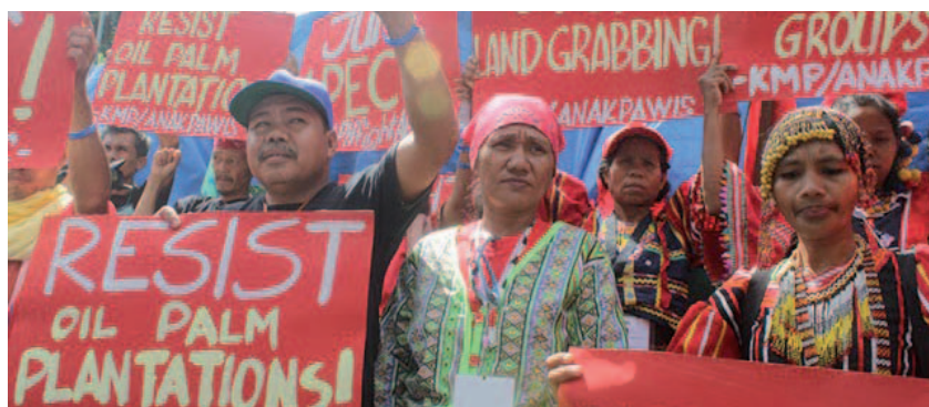
Campeños y pueblos indígenas protestan contra los planes de expansión de las plantaciones de palma aceitera en Filipinas.

Cuando una compañía llega a las tierras y territorios tradicionales de una comunidad y comienza a tratar con ella, en general ya tiene un permiso o un respaldo de algún tipo del gobierno nacional para realizar la plantación. El proceso se realiza siempre de arriba hacia abajo, nunca de abajo hacia arriba, y es raro que la opción de no realizar la plantación forme parte de las opciones en discusión.