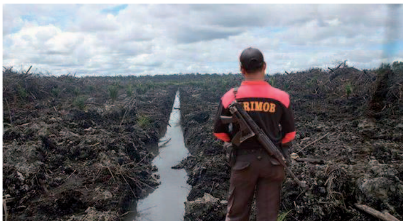
En Indonesia, las empresas de palma aceitera contratan guardias armados para proteger sus plantaciones.

En la mayoría de los casos, quienes pierden el acceso a la tierra debido al establecimiento de una gran plantación de palma aceitera no reciben indemnización alguna. Eso es debido a que, en muchos países del Sur, los pobladores no tienen títulos de propiedad formal de las tierras que utilizan y en las que han vivido, a menudo durante muchas generaciones. Sin embargo, sí poseen derechos consuetudinarios sobre esas tierras. Cuando los gobiernos nacionales fijan las reglas para calcular las “indemnizaciones”, las tierras de derecho consuetudinario suelen verse excluidas. Las empresas afirman que pagan indemnizaciones “adecuadas” o “correctas”, pero los cálculos no tienen en cuenta los sistemas tradicionales y, por consiguiente, los montos son muy bajos y suelen referirse sólo a los cultivos realizados en una parte del territorio utilizado por la comunidad.