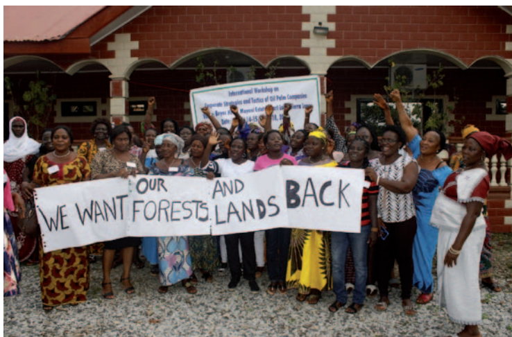
“Queremos que nos devuelvan nuestros bosques y tierras”, dicen las mujeres organizadas en Sierra Leona (2017).

La violencia no sólo es ejercida sobre las mujeres cuando trabajan para las empresas; también la sufren en su vida diaria alrededor de las plantaciones. Las compañías acaparan las tierras y contaminan, desvían o secan los ríos. Como consecuencia, las mujeres y niñas son forzadas a andar mucho más para encontrar agua y te-