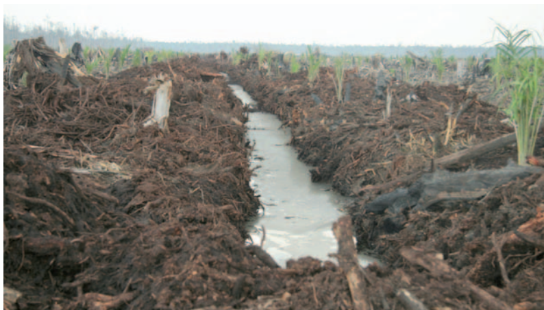
Área recientemente deforestada y ocupada con palma aceitera, provincia de Sumatra del Sur, Indonesia.

Los gobiernos de los países productores de palma aceitera y las compañías productoras de aceite de palma presionan a nivel internacional para que las plantaciones de palma sean consideradas como bosques (la organización FAO de las Naciones Unidas sigue definiéndolas como un cultivo agrícola). Si consiguieran que se les llamara “bosques”, las empresas podrían participar en mecanismos de comercialización de ecosistemas, como REDD+ 10 , el MDL 11 u otros similares, y obtener ingresos suplementarios vendiendo créditos de carbono generados en sus plantaciones. Sin embargo, la idea de que las compañías de palma aceitera reciban dinero por el almacenamiento (temporario) de carbono en sus