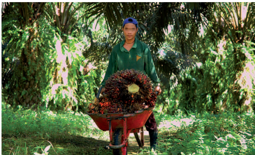
Algo muy común: un niño trabajando en una plantación de palma aceitera en Indonesia.

Sin embargo, la realidad de la conducta del sector del aceite de palma en países como Indonesia no confirma esas afirmaciones. Las compañías del sector no son ejemplos de buena conducta ética; al contrario, han estado implicadas en casos de corrupción, gratificación y soborno, así como de búsqueda de renta por parte de político 26 y funcionarios gubernamentales. Además, muchos casos de violencia han sido denunciados 27 en los centenares de conflictos entre las comunidades locales y las empresas.