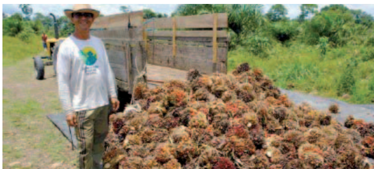
Pequeño agricultor trabajando con Biopalma Vale, en Brasil. Aún gasta más de lo que gana.

Otro problema es que, para realizar las plantaciones, los pequeños agricultores deben obtener préstamos que suelen resultarles difícil de reembolsar. Los gobiernos y las compañías suelen exagerar los beneficios que las plantaciones de palma aceitera aportan a la población. En cambio, raras veces informan adecuadamente a los pequeños agricultores sobre los costos y sobre el riesgo que conlleva el asumir una deuda que, según el tipo de acuerdos, contraen directamente o deben reembolsar a la compañía por la preparación y la plantación de sus parcelas de 2 hectáreas. El sistema que se aplica hoy en día en Indonesia puede condenar a los agricultores a pasar el resto de su vida endeudados. Muchos de ellos carecen de contrato con la empresa y disponen de muy poca información sobre el plan financiero en el que se implican. Como los ingresos que producen las dos hectáreas quedan muy menguados debido al pago de la deuda y de los gastos generales, la gente debe completarlos realizando actividades en otros lugares.