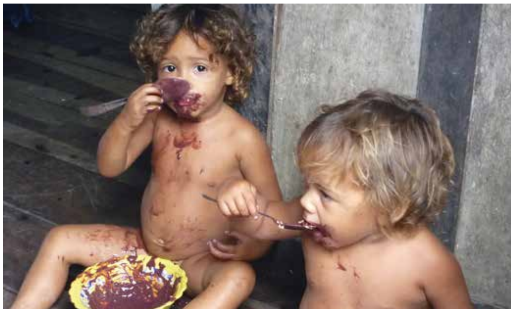
Niños comiendo frutas de Palma de Euterpe oleracea (Açaí) recolectadas por los padres, Reserva Jutai, Selva Amazónica