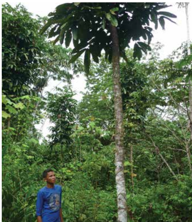
Sistema agroforestal Manihot esculenta (yuca) con Carapa guianensis (Andiroba), Reserva Jutai, Selva Amazónica

Resaltamos las iniciativas campesinas en la zona norte de Costa Rica, acompañadas por Coecoceiba – Amigos de la Tierra Costa Rica, donde cientos de familias se han unido desde hace décadas para habitar y proteger territorios comunes bajo los principios aquí citados para el MCB y la agroecología: diversidad, autonomía