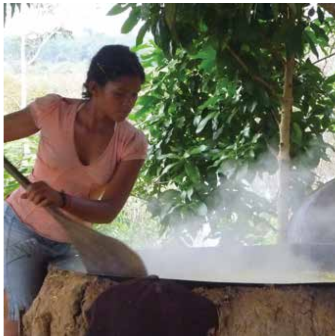
Prensado de Manihot esculenta (yuca) para extraer toxinas y producir sub-productos, Reserva Jutai, Selva Amazónica