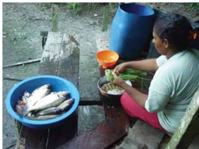
Pescador preparando anzuelos con semillas de Carapa guianensis (Andiroba árbol) como carnada, Reserva Jutai, Selva Amazónica