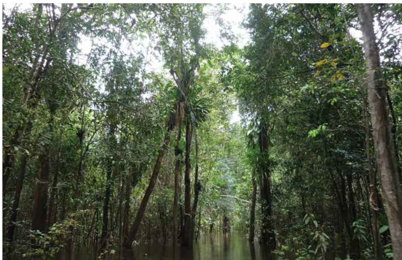
Bosque de Várzea en Reserva Jutai, Selva Amazónica

Tanto el MCB como la agroecología se caracterizan por mantener e incrementar la diversidad biológica y cultural. Numerosas investigaciones ahondan en las estrategias mediante las cuales los Pueblos Indígenas y comunidades locales contribuyen a incrementar la diversidad biológica, tanto de especies forestales como agrícolas, al tiempo que mantienen sistemas de pensamiento, cultura y educación heterogéneos.