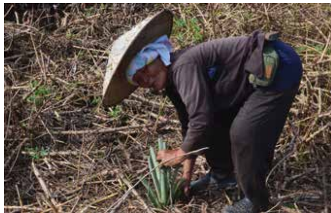
Centro de proyectos de agroecología de Sarawak, construido por comunidades recursos forestales naturales, apoyado por SAM/AT Malasia