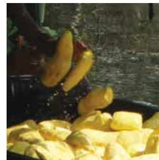
Transporte de Manihot esculenta (yuca) de la cosecha a la casa de farinha, por río, Reserva Jutai, Selva Amazónica