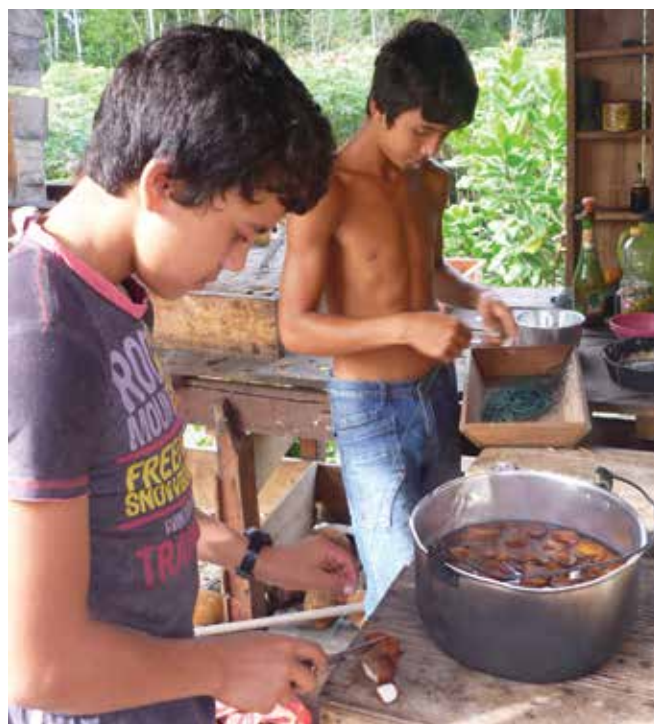
Niños jóvenes preparando más de 100 anzuelos con Carapa guianensis (Andiroba) como cebo, Reserva Jutái, Selva Amazónica

Ahora bien, en lo que atañe a la protección de bosques, nada más distante de la realidad. Si se revisan los diagnósticos forestales de la mayor parte de países, especialmente aquellos donde se concentran los bosques más biodiversos, la agroindustria aparece como una de la primeras causas directas de deforestación. La expansión de la ganadería extensiva y de la agricultura, incluida la intensiva, talan cada año millones de hectáreas para