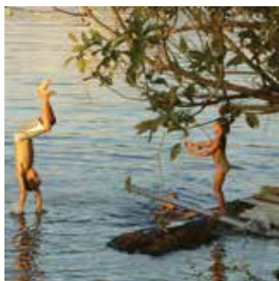
Niños jugando en una de las comunidades de la Reserva de Jutai, Selva Amazónica

En 2016, NAPE y los pequeños agricultores afectados presentaron una queja ante otra entidad de la Organización de Naciones Unidas (ONU), la Unidad de Cumplimiento Social y Ambiental, con el objetivo de que se investigaran las actividades de Bidco, empresa responsable de las plantaciones en Kalangala. Se encontraron múltiples irregularidades e incumplimientos, así como controversias por acusaciones de acaparamiento de tierras, deforestación, normas laborales deficientes y problemas con pagos de impuestos. Riesgos que no han sido caracterizados ni seguidos de manera satisfactoria por el Programa de las Naciones Unidas para el Desarrollo (PNUD), (NAPE, 2017).