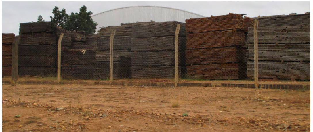
Extração de madeira da área do projeto REDD.

madeira, inclusive áreas de preservação permanente – que deveriam ser estritamente protegidas pela lei – afetadas pelo corte de madeira, e ausência de muitos planos e ações que deveriam fazer parte do chamado “manejo florestal sustentável”. (16)