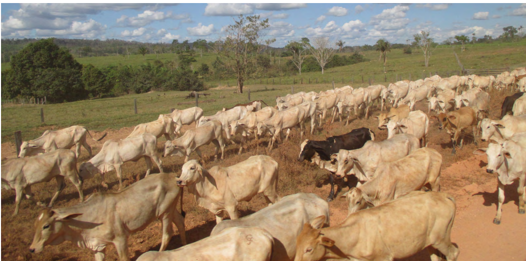
Gado e pastagens na região de Colniza.

Ainda sobre o que de fato aconteceu entre 1975 e 1991, período que não é comentado no relatório do projeto FSM-REDD, moradores da região e também documentação disponível apontam que, em vez da