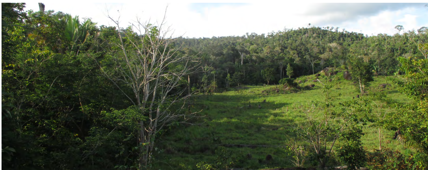
Limite da área do projeto REDD.

O projeto de REDD Florestal Santa María (FSM-REDD) cobre quase 70.000 hectares da Amazônia brasileira e vendeu créditos de carbono a programas de compensação de, pelo menos, duas companhias aéreas: Delta Airlines e TAP. Por trás dele se esconde um aumento no desmatamento na região e um histórico de concentração de terras, uso de certificações que não valem mais e promessas não cumpridas às comunidades locais.