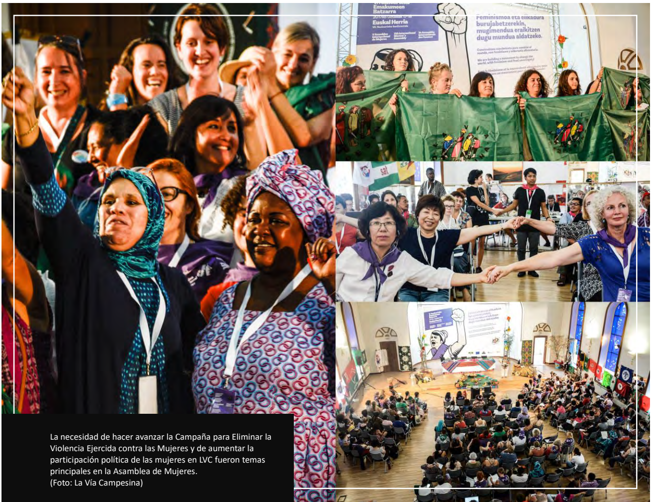
La necesidad de hacer avanzar la Campaña para Eliminar la Violencia Ejercida contra las Mujeres y de aumentar la participación política de las mujeres en LVC fueron temas principales en la Asamblea de Mujeres.

La Articulación de Mujeres de La Vía Campesina se reunió en El Salvador, con la ANTA como anfitriona, para preparar la 5ª Asamblea de Mujeres para evaluar el trabajo de la Articulación y el progreso de la agenda feminista dentro del movimiento. Debatieron también su implicación en ciertos ámbitos de trabajo, como el de los derechos campesinos o el Comité para la Seguridad Alimentaria (CSA), así como la preparación de las jornadas de lucha, como el Día Internacional de la Mujer -8 de marzo-. Se organizó un foro en El Salvador para compartir las diferentes experiencias y reivindicaciones de políticas para con las organizaciones campesinas locales. También se compartieron análisis y orientaciones sobre cómo implicarse en una investigación participativa genuina liderada por