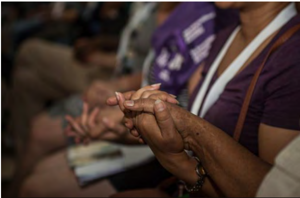
Durante todo el año, y tras la VII Conferencia, emitimos varios comunicados de solidaridad pidiendo a los gobiernos que respeten los derechos humanos.