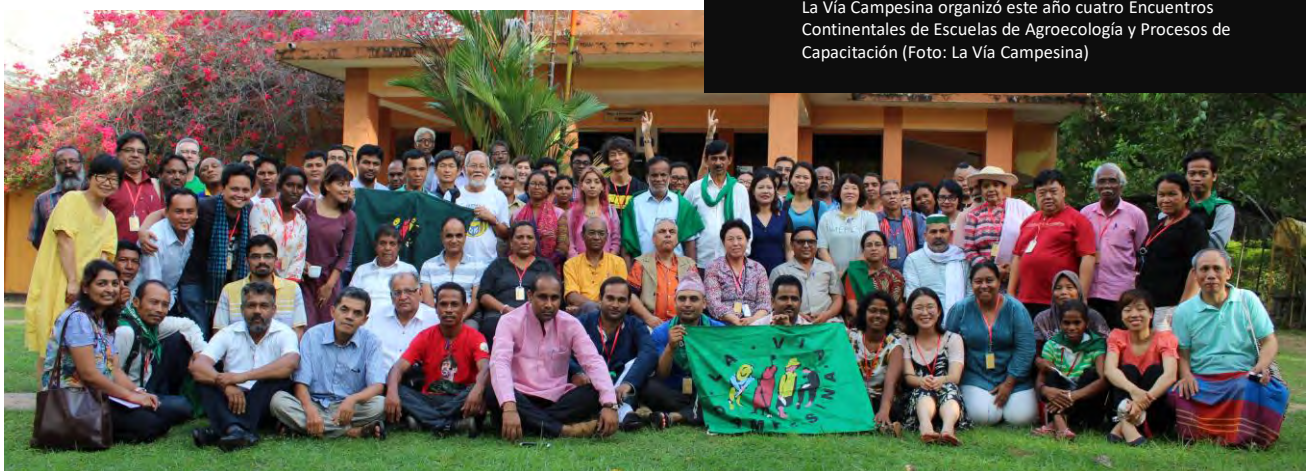
La Vía Campesina organizó este año cuatro Encuentros Continentales de Escuelas de Agroecología y Procesos de Capacitación

Con el fin de reforzar las capacidades de nuestros miembros para servirse del Tratado de las Semillas, La Vía Campesina ha planificado organizar talleres en África y Asia para promover el conocimiento y el uso del Artículo 9 sobre los Derechos de los Agricultores entre campesinos y campesinas. El primer taller regional tuvo lugar en Mali en septiembre pasado.