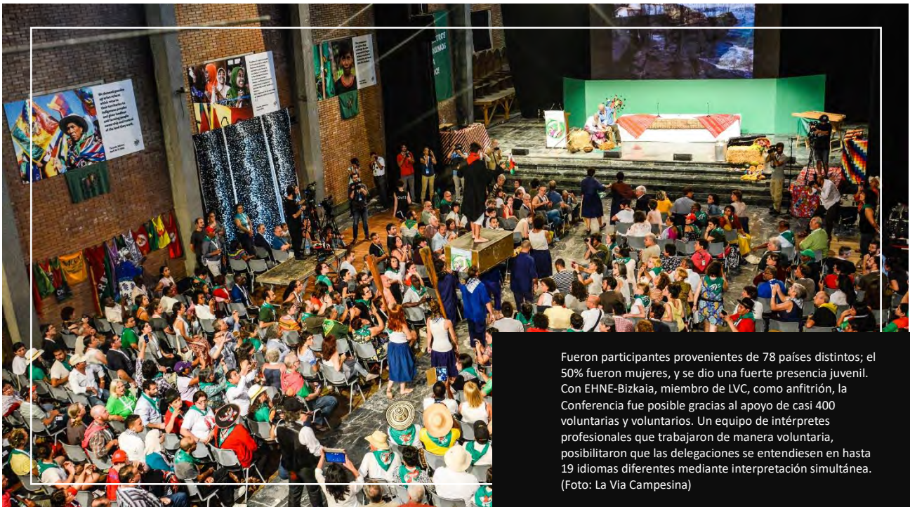
Fueron participantes provenientes de 78 países distintos; el 50% fueron mujeres, y se dio una fuerte presencia juvenil. Con EHNE-Bizkaia, miembro de LVC, como anfitrión, la Conferencia fue posible gracias al apoyo de casi 400 voluntarias y voluntarios. Un equipo de intérpretes profesionales que trabajaron de manera voluntaria, posibilitaron que las delegaciones se entendiesen en hasta 19 idiomas diferentes mediante interpretación simultánea.

“¡Alimentamos a nuestros pueblos y construimos movimiento para cambiar el mundo!” fue la voz que tronó de las gargantas de las delegadas y delegados campesinos de todas las regiones del planeta, reunidos en la localidad de Derio, en el País Vasco (Euskal Herria) dentro del Estado Español, del 17 al 24 de julio de 2017. Fueron participantes provenientes de 78 países distintos; el 50% fueron mujeres, y se dio una fuerte presencia juvenil. Con EHNE-Bizkaia, miembro de LVC, como anfitrión, la Conferencia fue posible gracias al apoyo de casi 400 voluntarias y voluntarios. Un equipo de intérpretes profesionales que trabajaron de manera voluntaria, posibilitaron que las delegaciones se entendiesen en hasta 19 idiomas diferentes mediante interpretación simultánea. Setenta aliados de movimientos como el Foro Mundial de Pueblos Pescadores o la Marcha Mundial de Mujeres, así como ONG comprometidas con el apoyo al movimiento campesino se sumaron a la Conferencia. Durante la jornada de apertura, hubo sesiones públicas con más de 800