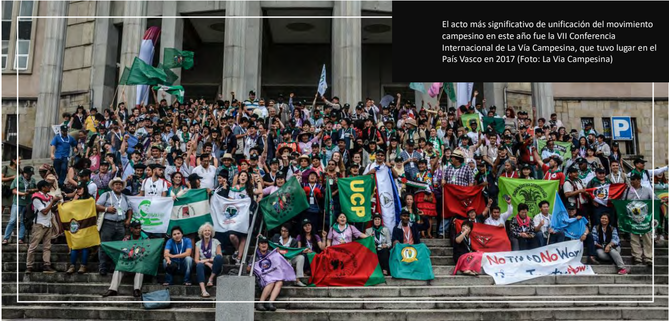
El acto más significativo de unificación del movimiento campesino en este año fue la VII Conferencia Internacional de La Vía Campesina, que tuvo lugar en el País Vasco en 2017

Cada año trae sus nuevas oportunidades y desafíos para “Globalizar la lucha, y globalizar la esperanza”. El acto más significativo de unificación del movimiento campesino en este año fue la VII Conferencia Internacional de La Vía Campesina, que tuvo lugar en el País Vasco en 2017, donde más de 500 representantes de nuestro movimiento y de nuestros aliados, procedentes de todos los continentes, convergieron y apostaron por construir un movimiento para cambiar el mundo. En un año en que los campesinos y campesinas, las personas rurales y los pueblos indígenas tuvieron que enfrentar situaciones de tristeza y desesperación, este encuentro representó un momento de renovación del espíritu de la lucha de los pueblos, de construcción de la solidaridad, y de mutuo intercambio de historias de lucha hecha desde nuestros territorios.