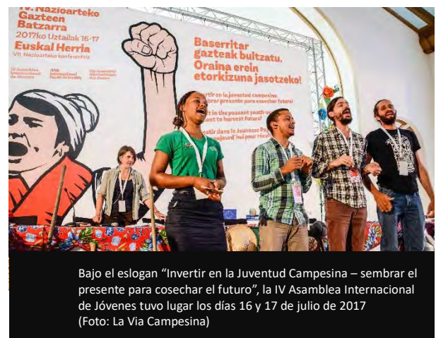
Bajo el eslogan “Invertir en la Juventud Campesina – sembrar el presente para cosechar el futuro”, la IV Asamblea Internacional de Jóvenes tuvo lugar los días 16 y 17 de julio de 2017

participantes y la asistencia de las autoridades locales del País Vasco y otros lugares.