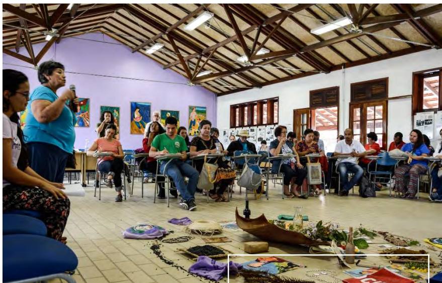
Encuentro de Agroecología de las Américas en Brasil en la Escuela Florestan Fernandes

reconocimiento por parte de las instituciones y de la sociedad civil de la vertiente de transformación social de la agroecología. Las delegadas y delegados de La Vía Campesina han estado activos en el frente de las semillas, con acciones que van desde la construcción de capacidades a nivel de las bases, hasta las acciones de cabildeo e incidencia a nivel regional para proteger a