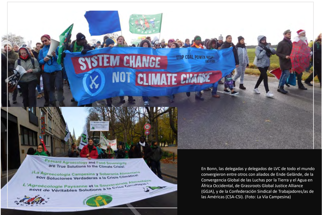
En Bonn, las delegadas y delegados de LVC de todo el mundo convergieron entre otros con aliados de Ende Gelände, de la Convergencia Global de las Luchas por la Tierra y el Agua en África Occidental, de Grassroots Global Justice Alliance (GGJA), y de la Confederación Sindical de Trabajadores/as de las Américas (CSA-CSI).

2017 fue otro año importante para el Colectivo de Trabajo sobre Justicia Ambiental y Climática de LVC. La VII Conferencia confirmó la importancia de la lucha por la justicia climática dentro de nuestro movimiento y en toda la más amplia red de organizaciones populares que están batallando por una transición justa para abandonar los combustibles fósiles, aunando los esfuerzos de campesinos, indígenas y trabajadores rurales.