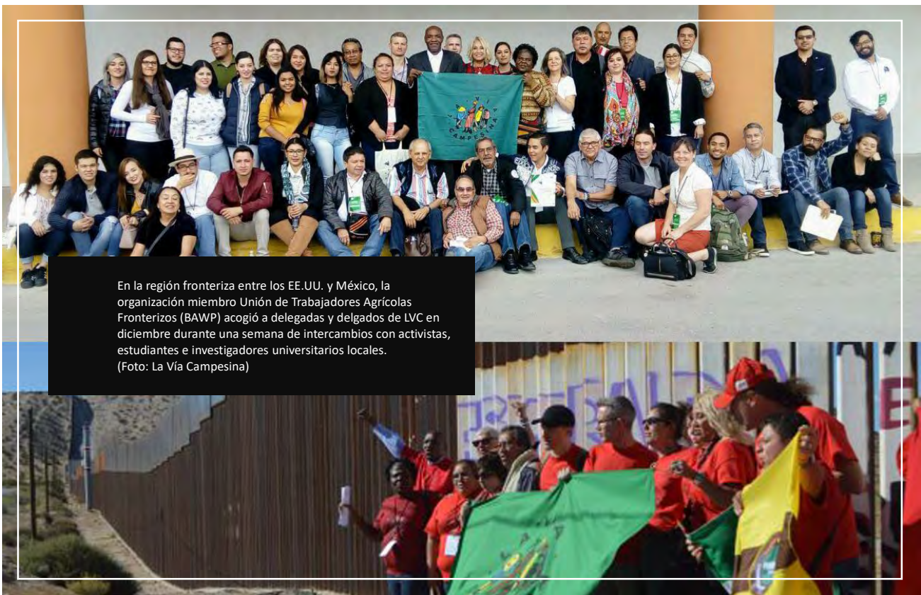
En la región fronteriza entre los EE.UU. y México, la organización miembro Unión de Trabajadores Agrícolas Fronterizos (BAWP) acogió a delegadas y delegados de LVC en diciembre durante una semana de intercambios con activistas, estudiantes e investigadores universitarios locales.

El Colectivo Internacional de Migración y Trabajadores Rurales se implicó en varios momentos de lucha a lo largo de año, entre ellos la Acción Global de los Pueblos (PGA) sobre Migración, Desarrollo y Derechos Humanos (en Berlín, Alemania) y el 5º Encuentro Internacional sobre Migraciones y Trabajo Rural (Ciudad Juárez, México).