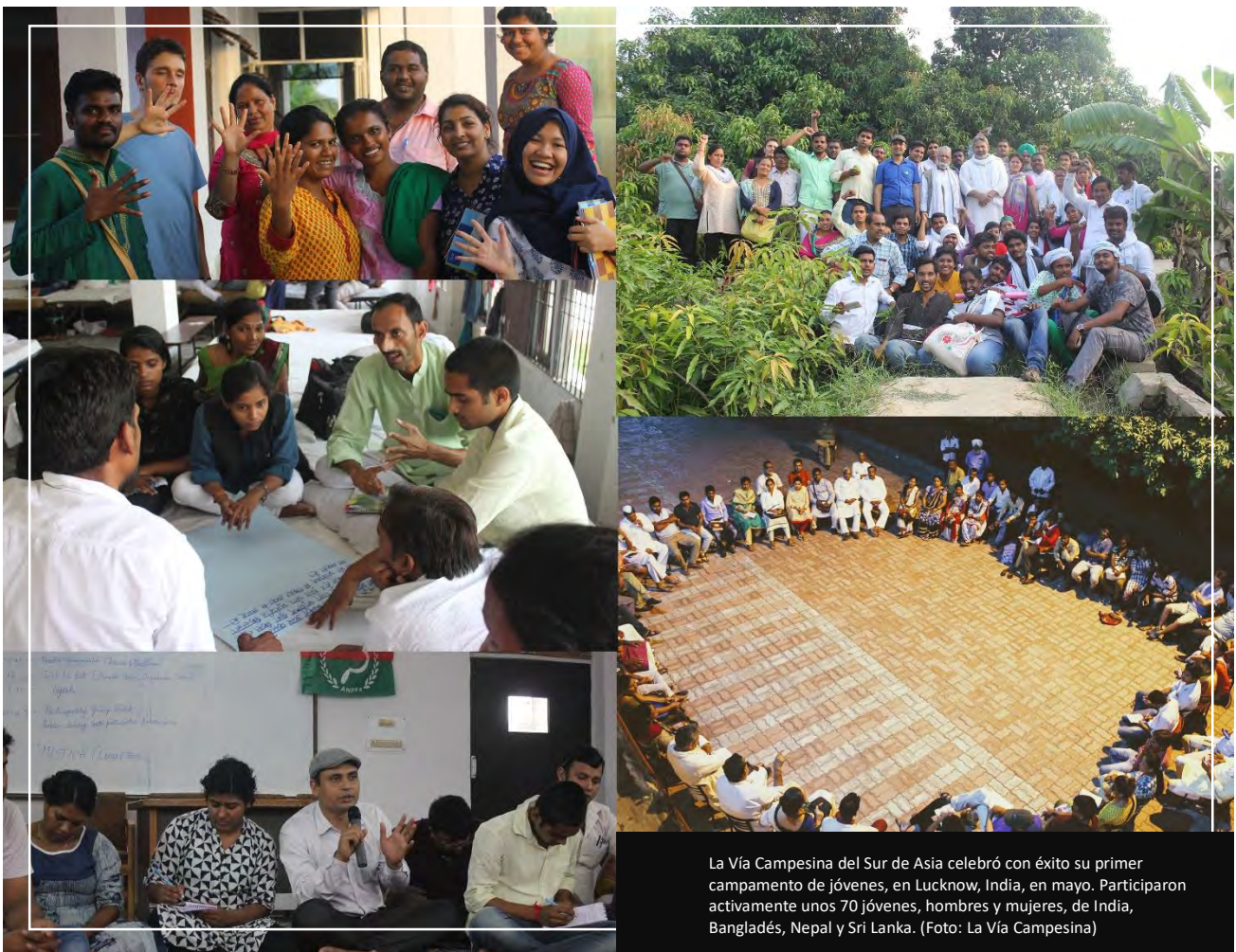
La Vía Campesina del Sur de Asia celebró con éxito su primer campamento de jóvenes, en Lucknow, India, en mayo. Participaron activamente unos 70 jóvenes, hombres y mujeres, de India, Bangladés, Nepal y Sri Lanka.

La Vía Campesina del Sur de Asia celebró con éxito su primer campamento de jóvenes, en Lucknow, India, en mayo. Participaron activamente unos 70 jóvenes, hombres y mujeres, de India, Bangladés, Nepal y Sri Lanka. Debatieron e intercambiaron sobre diferentes temas, tales como la soberanía alimentaria, la agroecología, el género, la clase, el comercio, las comunicaciones y los principales problemas que aquejan a la juventud campesina del Sur de Asia. La región avanzó hacia una mayor inclusividad, una solidaridad campesina con los trabajadores agrícolas, y una mayor solidaridad regional. Desde el liderazgo también se facilitó el acceso de dos jóvenes campesinos al proceso de toma de decisiones.