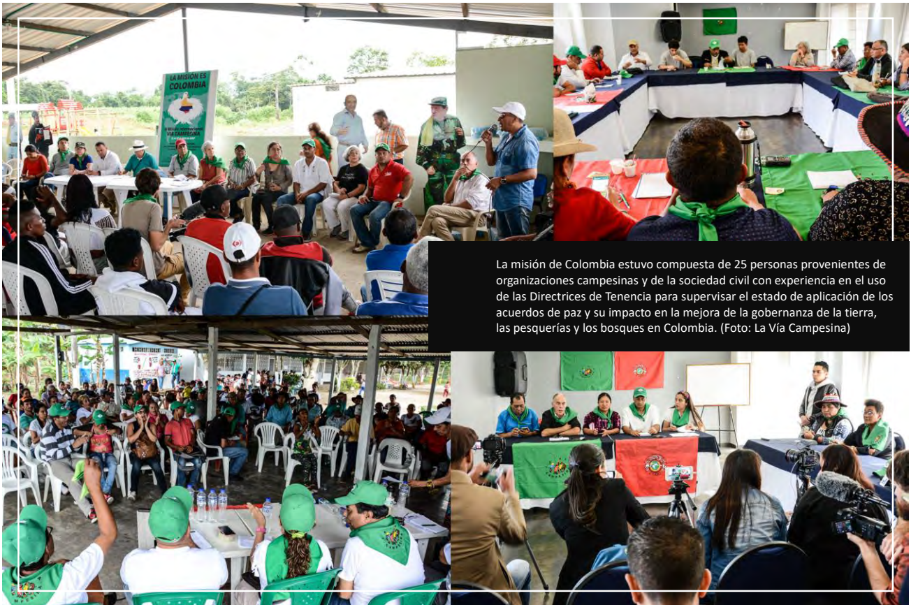
La misión de Colombia estuvo compuesta de 25 personas provenientes de organizaciones campesinas y de la sociedad civil con experiencia en el uso de las Directrices de Tenencia para supervisar el estado de aplicación de los acuerdos de paz y su impacto en la mejora de la gobernanza de la tierra, las pesquerías y los bosques en Colombia.

Las luchas por la tierra, el agua y los territorios, y de resistencia frente al acaparamiento de tierras, agua y bosques, y contra la minería, así como los graves casos de criminalización siguen estando fuertemente presentes en las comunidades campesinas. Por ello, LVC ha efectuado varios llamados a la solidaridad y a la acción a petición de nuestras organizaciones-miembro. Es necesario profundizar este trabajo, para poder ofrecer un apoyo mejor. Este fue también un aspecto importante de debate y compartición durante la VII Conferencia.