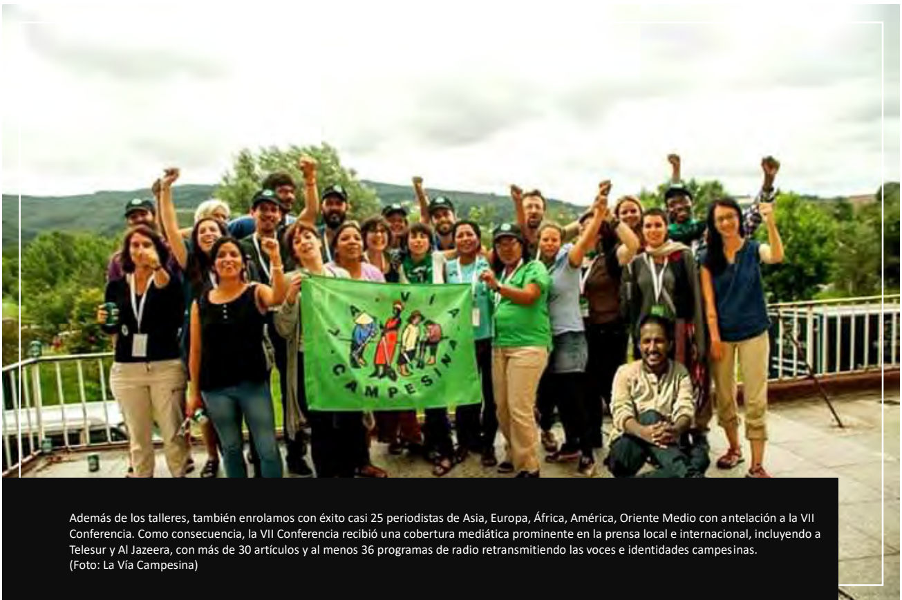
Además de los talleres, también enrolamos con éxito casi 25 periodistas de Asia, Europa, África, América, Oriente Medio con antelación a la VII Conferencia. Como consecuencia, la VII Conferencia recibió una cobertura mediática prominente en la prensa local e internacional, incluyendo a Telesur y Al Jazeera, con más de 30 artículos y al menos 36 programas de radio retransmitiendo las voces e identidades campesinas.

La presencia de La Vía Campesina en los medios de comunicación social ha crecido en plataformas como Facebook y Twitter. Mediante la asociación con webs de contenidos y freelancers, hemos logrado producir y publicar varios videos breves, podcasts, y actualizaciones de fotos de las páginas. También hemos utilizado las últimas herramientas disponibles en Facebook y Twitter (como los artículos Insta o los Momentos y los Hilos de Twitter) para difundir las voces y opiniones de las comunidades y la juventud campesinas.