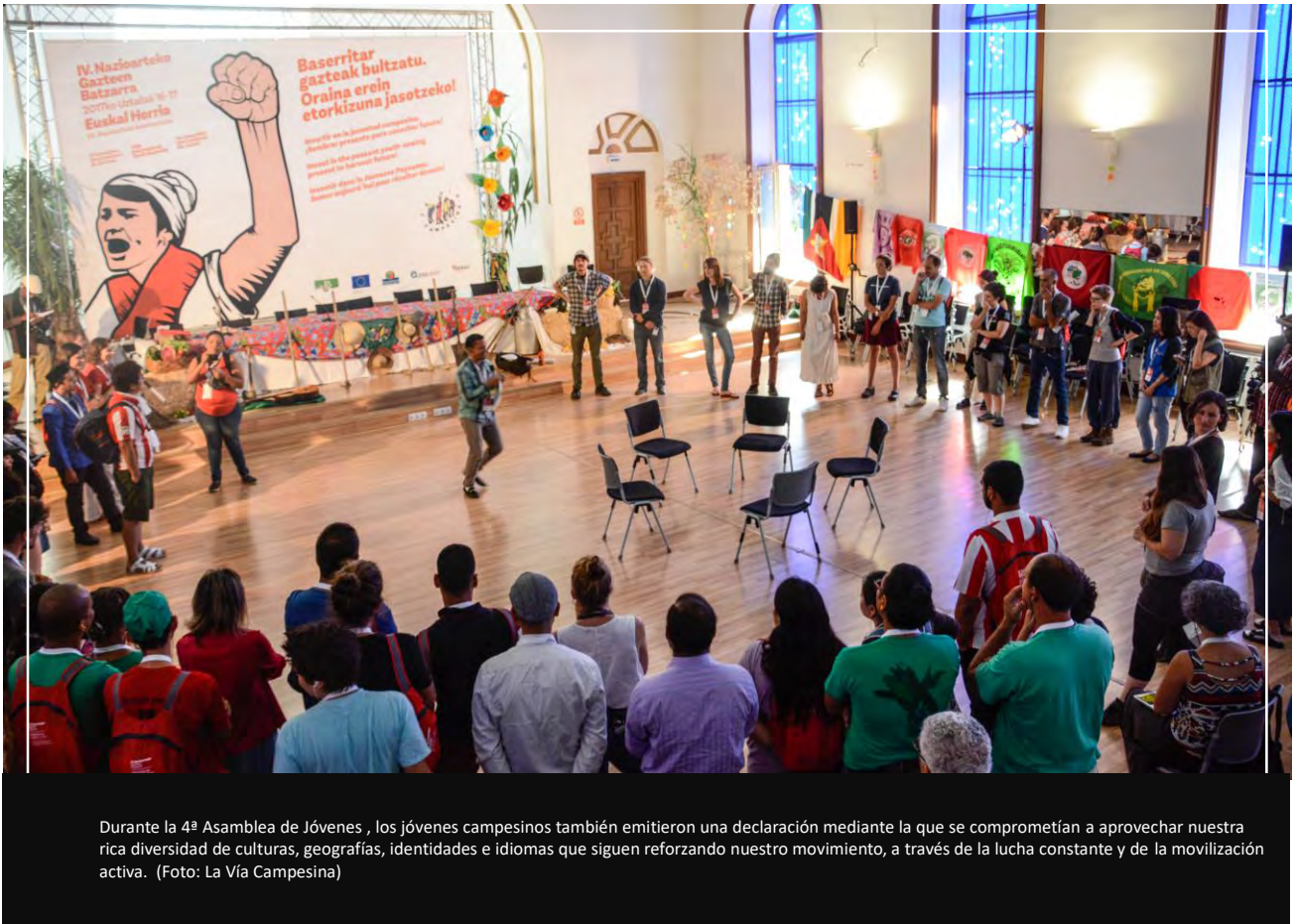
Durante la 4ª Asamblea de Jóvenes, los jóvenes campesinos también emitieron una declaración mediante la que se comprometían a aprovechar nuestra rica diversidad de culturas, geografías, identidades e idiomas que siguen reforzando nuestro movimiento, a través de la lucha constante y de la movilización activa.

La Articulación de Jóvenes de La Vía Campesina consagró buena parte de su trabajo y atención, en la primera parte de 2017, a preparar la IV Asamblea Internacional de Jóvenes, que precedió a la VII Conferencia Internacional en Euskal Herria, País Vasco, en julio de 2017. La Asamblea reunió a jóvenes campesinos, pescadores e indígenas de África, América, Europa, Asia y Oriente Medio, que representaban a organizaciones de 47 países. Durante 2 días, intercambiaron ideas, desarrollaron estrategias, e hicieron oír la voz de las jóvenes y los jóvenes dentro del movimiento.