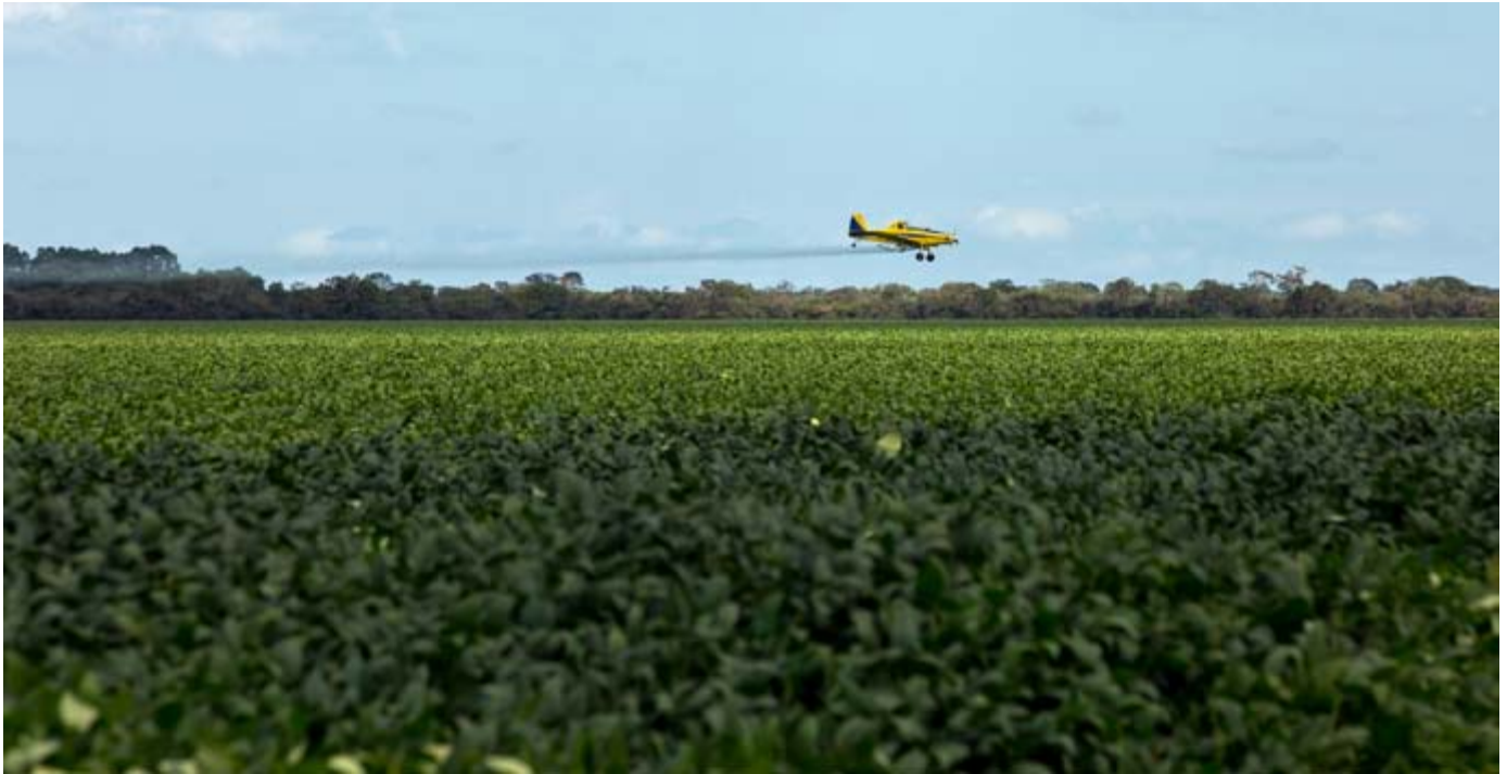
Fumigación aérea de pesticidas a una plantación de soja en Piauí, Brasil.

de tierras de Harvard violan las restricciones brasileñas sobre propiedad extranjera que limitan la cantidad de tierra que una compañía extranjera puede adquirir en un municipio. 27 La oficina del fiscal en el estado de Bahía ahora está considerando si demanda a la subsidiaria de Harvard y anula los títulos. 28