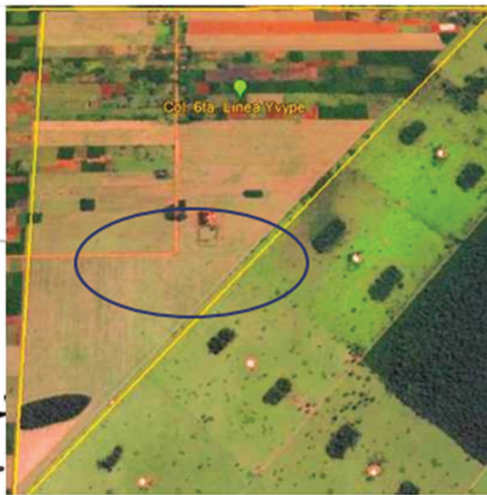
Imagen: elaboración propia en base al plano de habitación inicial de la colonia y Google Earth.

Lo que inicialmente era 6ta. Línea Yvypé, Colonia Campesina. Hoy sólo conserva alrededor de 20% su área de población campesina. El 80% de su área, ya en manos de agro-empresarios y todo mecanizado. (A.A.G.)