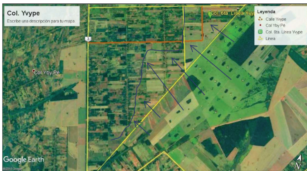
Imagen: elaboración propia en base al plano de habilitación inicial de la colonia.