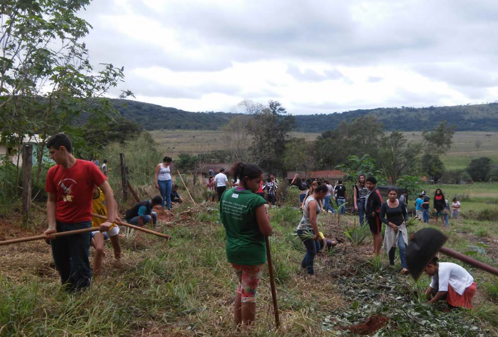
Estudantes da Escola Itinerante Valmir Motta de Oliveira, durante mutirão na horta no tempo trabalho.

Com o desafio da formação técnica em Agroecologia, além de cursos técnicos formais de diferentes modalidades, foram estruturados Escolas/Centros de Formação em Agroecologia. No Paraná, por exemplo, se constituiu uma rede de centros de formação, com o centro de Desenvolvimento Sustentável e Capacitação em Agroecologia-CEAGRO, com duas unidades, uma em Cantagalo e outra em Rio Bonito do Iguaçu; a Escola José Gomes/Instituto Técnico de Educação e Pesquisa na Reforma Agrária-ITEPA, em São Miguel do Iguaçu; Escola Milton Santos-EMS, em Maringá; e a Escola Latinoamericana de Agroecologia-ELAA, na Lapa. Espaços em interface com outras escolas e centros em diversos estados e em outros países do mundo.