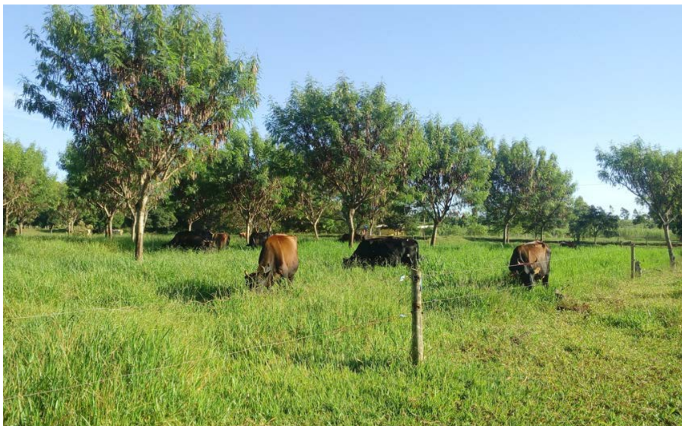
Piquetes usados para o trabalho, com sistema silvipastoril com leucena em março de 2018.

A Cooperativa está organizada nos seguintes setores: a) setor de apoio (administrativo, comércio, padaria e refeitório), b) setor de sustento familiar (horta e pomar agroflorestal) e pecuária leiteira) cana e derivados (responsável pela produção e beneficiamento da cana de açúcar, transformando em melado, cachaça e açúcar mascavo, além de cultivos anuais consorciados junto ao plantio da cana).