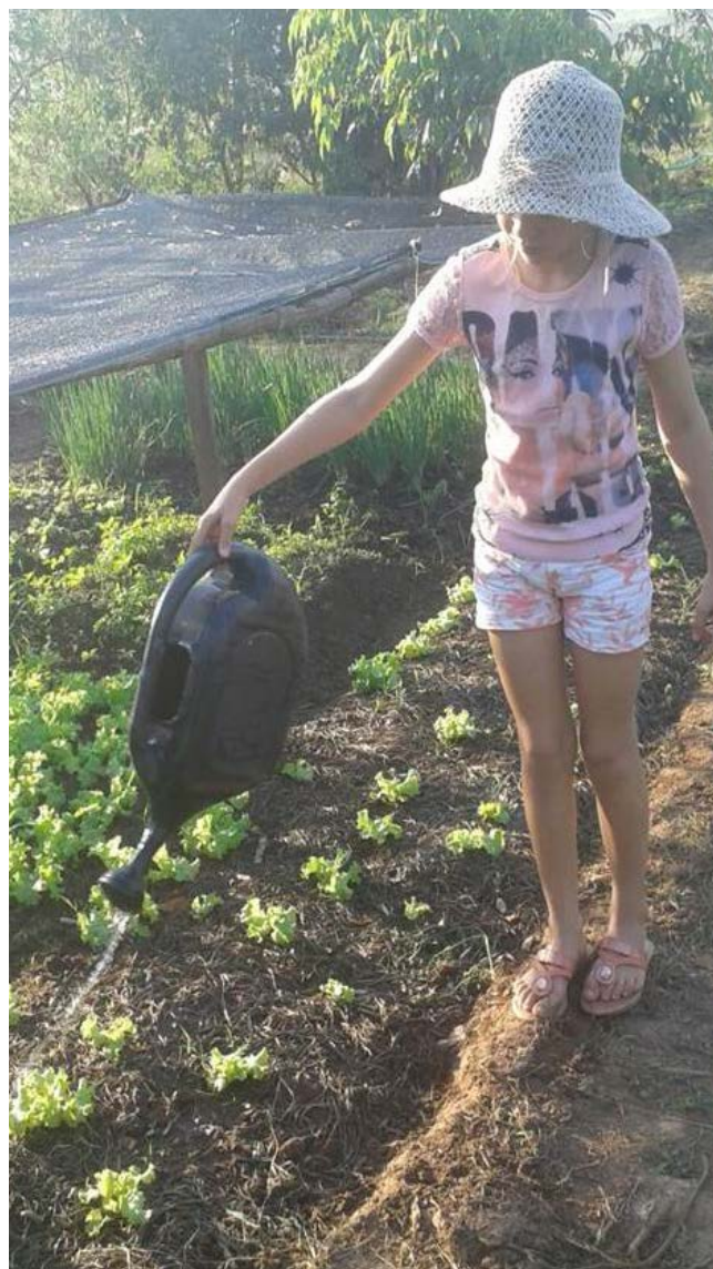
Educanda regando a horta durante tempo trabalho na Escola Itinerante Paulo Freire.

As escolas que tem assumido este desafio coletivo necessário, demonstram que a incorporação da agroecologia enquanto dimensão integrante do projeto político pedagógico, é uma questão de ousadia e de decisão político do coletivo escolar. Pois, nas mais adversas condições não abrem mão do conteúdo socialmente necessário para avançar no processo formativo, combinado com os germens do projeto de sociedade fundado na substantiva justiça social.