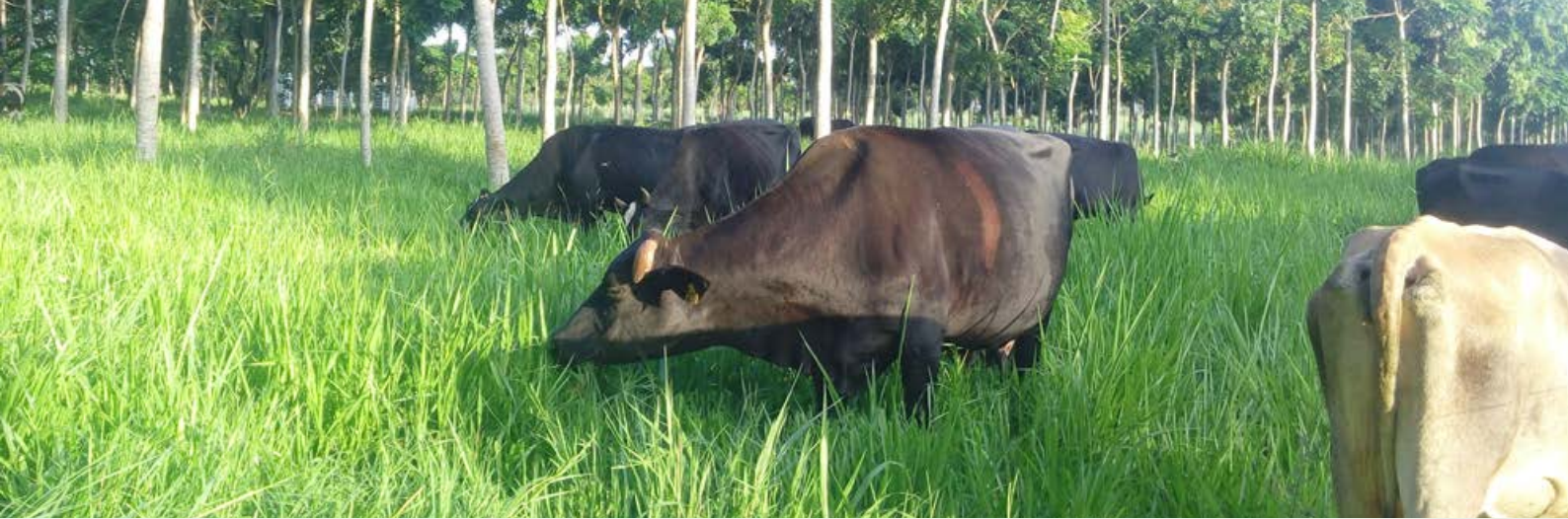
Vacas mestiças em lactação no pastoreio em área de silvipastoril com Mogno Africano ( Kaya senegalensis ) em piquetes da Unidade de PRV da COPAVI, em janeiro de 2019.