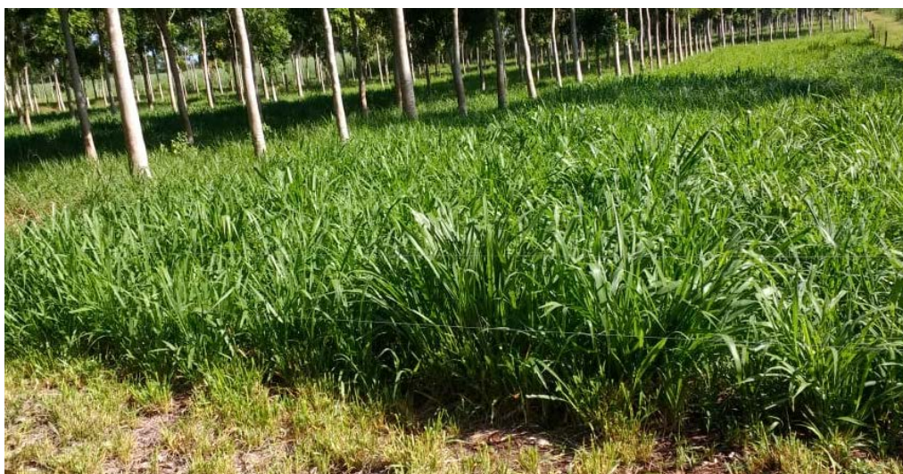
Piquete pastoreado e ao lado piquete em espera para atingir o ponto ótimo de repouso em piquetes da Unidade de PRV da COPAVI, em janeiro de 2019.

4 ° Lei do Rendimento Regular: esse deve respeitar a troca de parcela ou piquete a partir do ponto ótimo de repouso, assim não se utiliza por sequência o piquete ao lado, a não ser que o pasto apresente estar em seu “ponto ótimo de repouso”, ou seja nunca terá uma ordem sequencial do piquete sem considerar o estado da planta, a foto a seguir mostra um pouco desse manejo e respeito às leis do PRV.