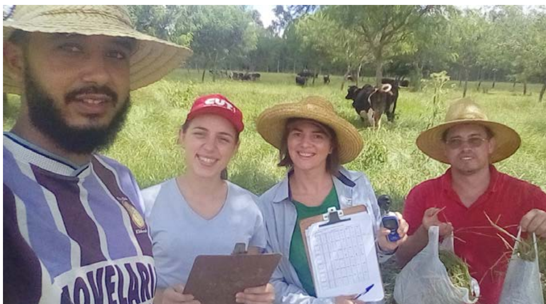
Jovens assentados(as), estudantes durante início de coleta de dados da pesquisa de mestrado sobre o efeito do sistema silvipastoril de leucena Leucaena leucocephala nos parâmetros fisiológicos, produtivos e comportamentais de vacas mestiças.