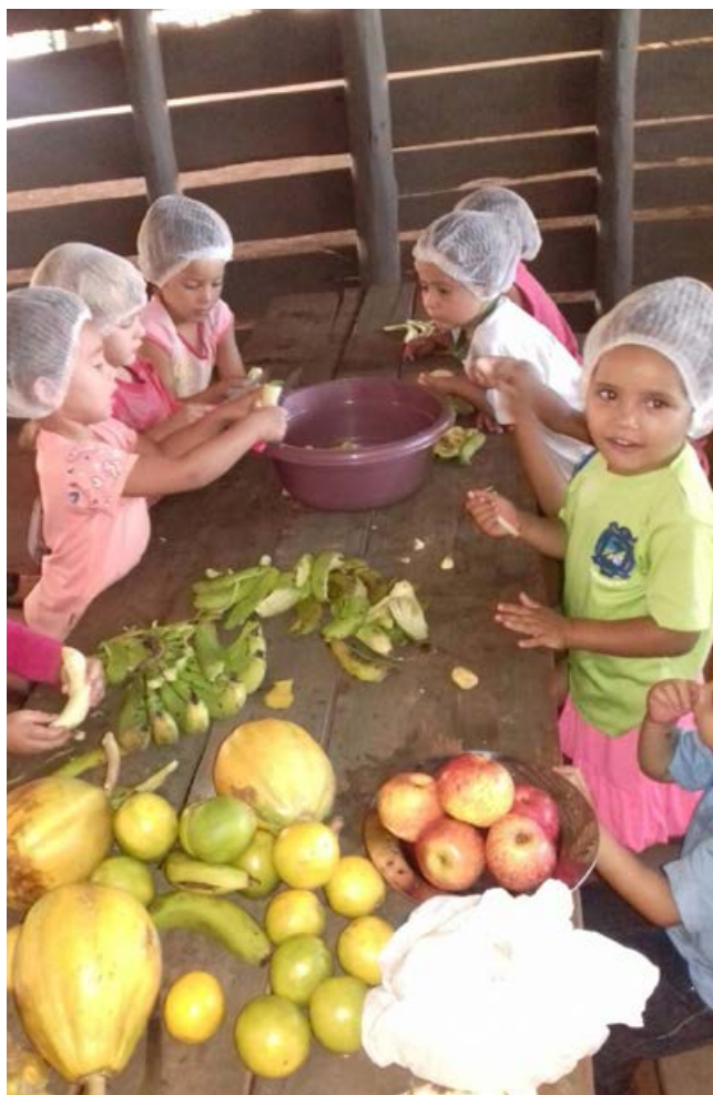
As crianças El Semeando Saber preparando salada de frutas posterior ao debate da alimentação saudável

É necessário que os coletivos escolares concebam cada vez mais a incorporação da agricultura camponesa agroecológica como ponto de partida para a educação de perspectiva politécnica enquanto “[...] um complexo tecnológico, necessariamente conectado a outros complexos, a outras indústrias, no sentido das práticas, dos conhecimentos tecnológicos e científicos de base” (IEJC, 2015, p. 53). A partir da escola, podem ser exercitados processos de estudo e de trabalho com vínculos necessários entre natureza, produção, política e cultura, e igualmente possibilitando a análise e a compreensão das contradições no seio das relações sociais capitalistas.