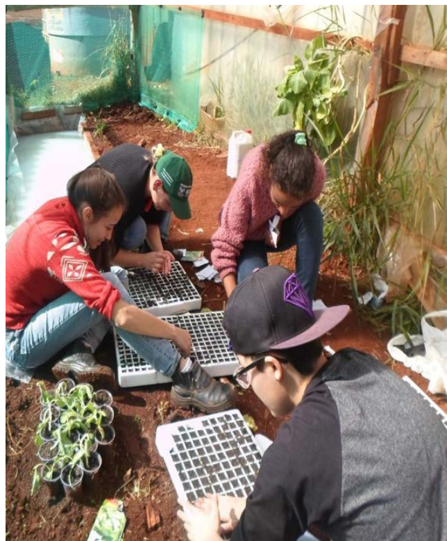
Estudantes do Colégio Iraci Salete durante tempo trabalho

e de acesso à cultura, apropriando-se do movimento e do devir dos fenômenos da natureza, sociais, políticos e econômicos de seu tempo e, pela via das contradições existentes na vida social na interface com os fundamentos da agroecologia, os conteúdos escolares possam adquirir vivacidade formativa. Não significa transferir para escola o papel da formação política ou da formação de agroecológicos, mas desenvolver, dentro dos seus limites, a inserção da escola nesta grandiosa tarefa de humanização, de modo que independente do ambiente e espaço de inserção desses sujeitos, eles possuam consciência, controle e decisão política sobre o consumo de alimento, o seu corpo, suas relações e a produção da vida como um todo, sendo camponês ou não.