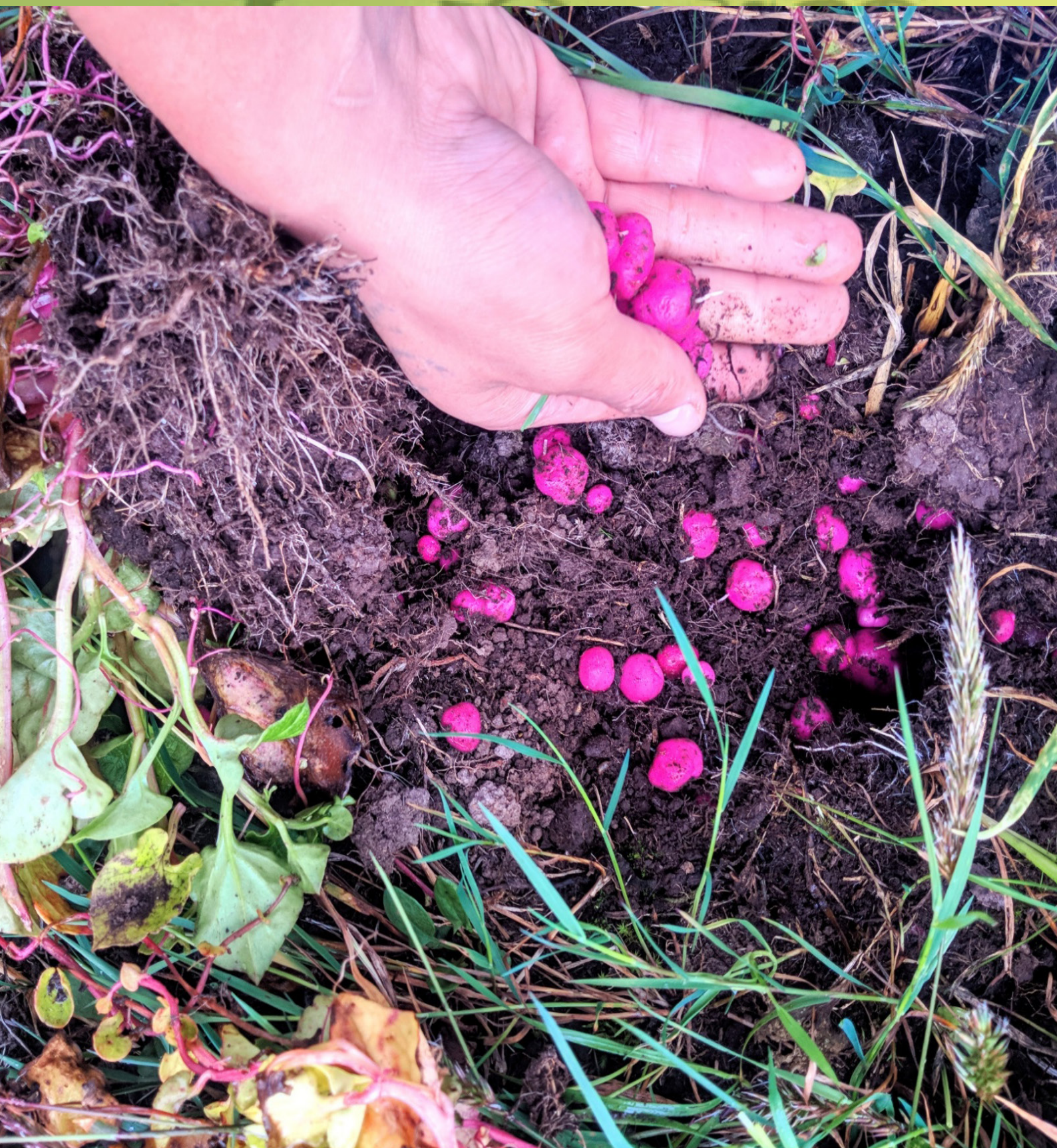
Fotografía:Diego Riveros 2019,Semillas andinas, ZRC Sumapaz.