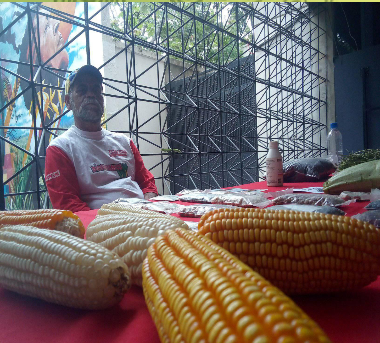
2019, Soberanía alimentaria, Venezuela.