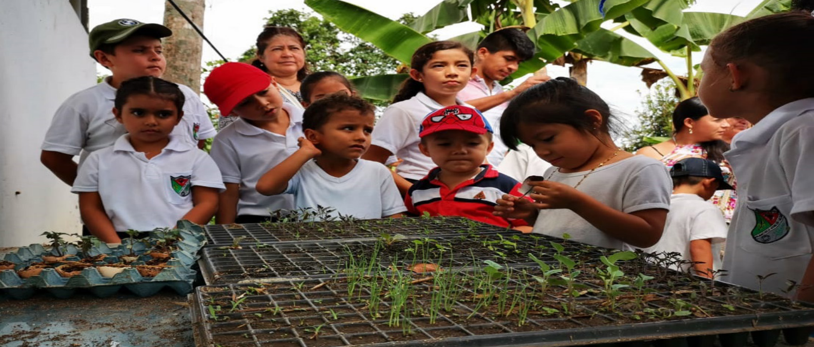
Semillas de resistencia, Viotá, Cundinamarca

mecanismo de libertad y multiplicación en el fortaleciendo de los huertos escolares, familiares y comunitarios, en búsqueda de la verdadera independencia, y construcción de la economía local que determinan la soberanía de los pueblos.