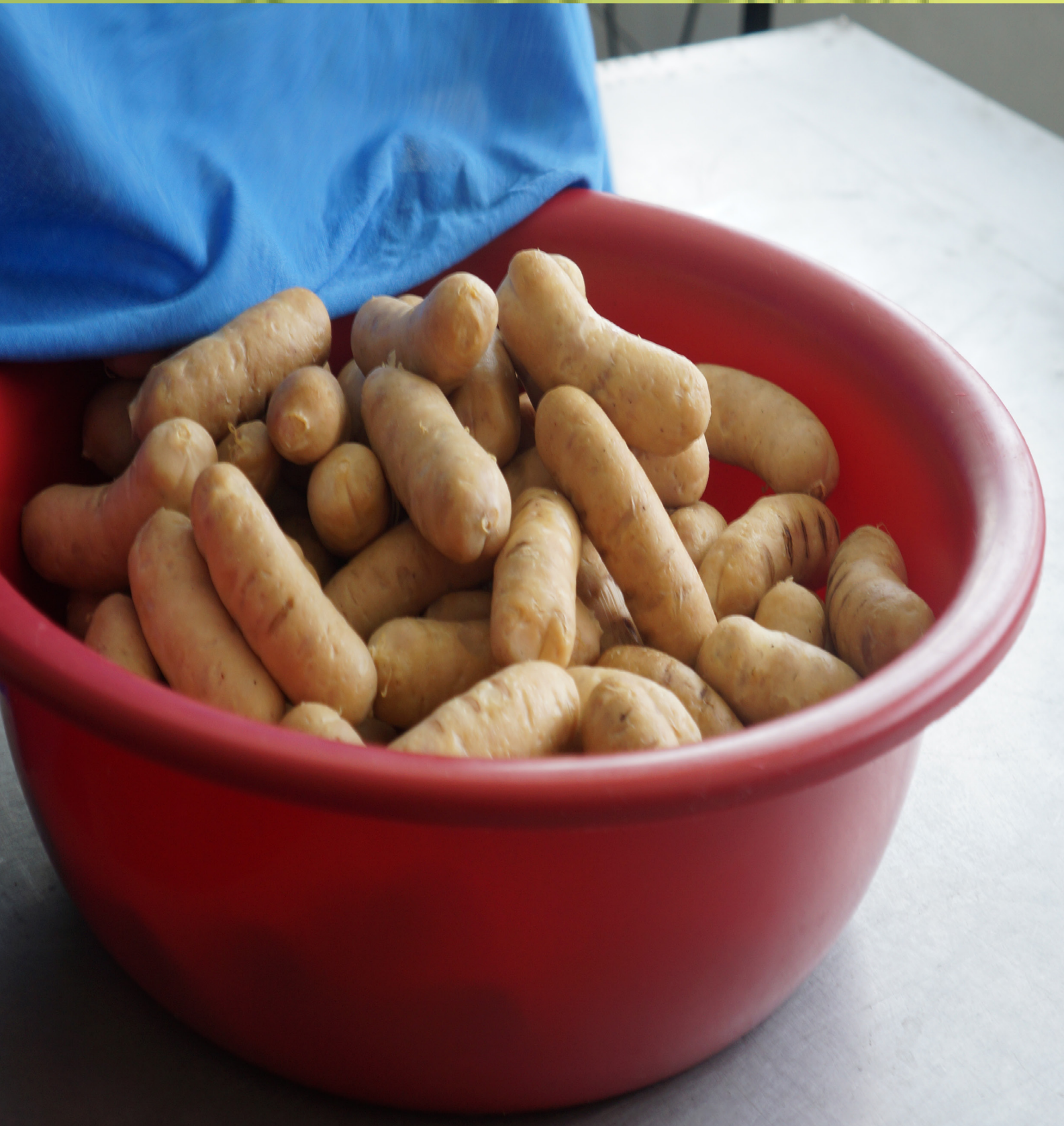
Fotografía: German León 2019, Chorizos de conejo, Fusagasuga, Cundinamarca