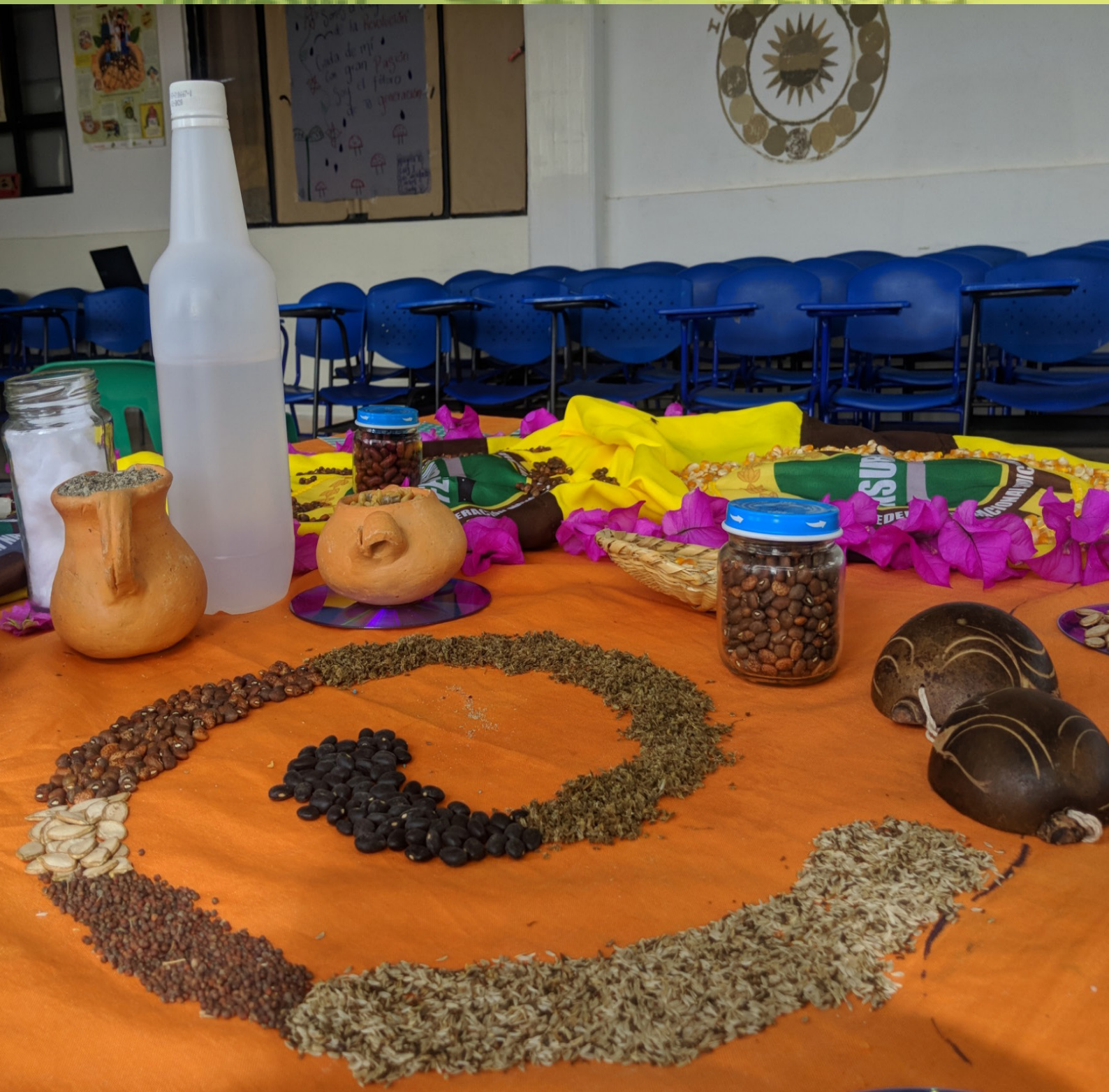
Fotografía:calambas 2019,Seminario semillas,Viotá, Cundinamarca