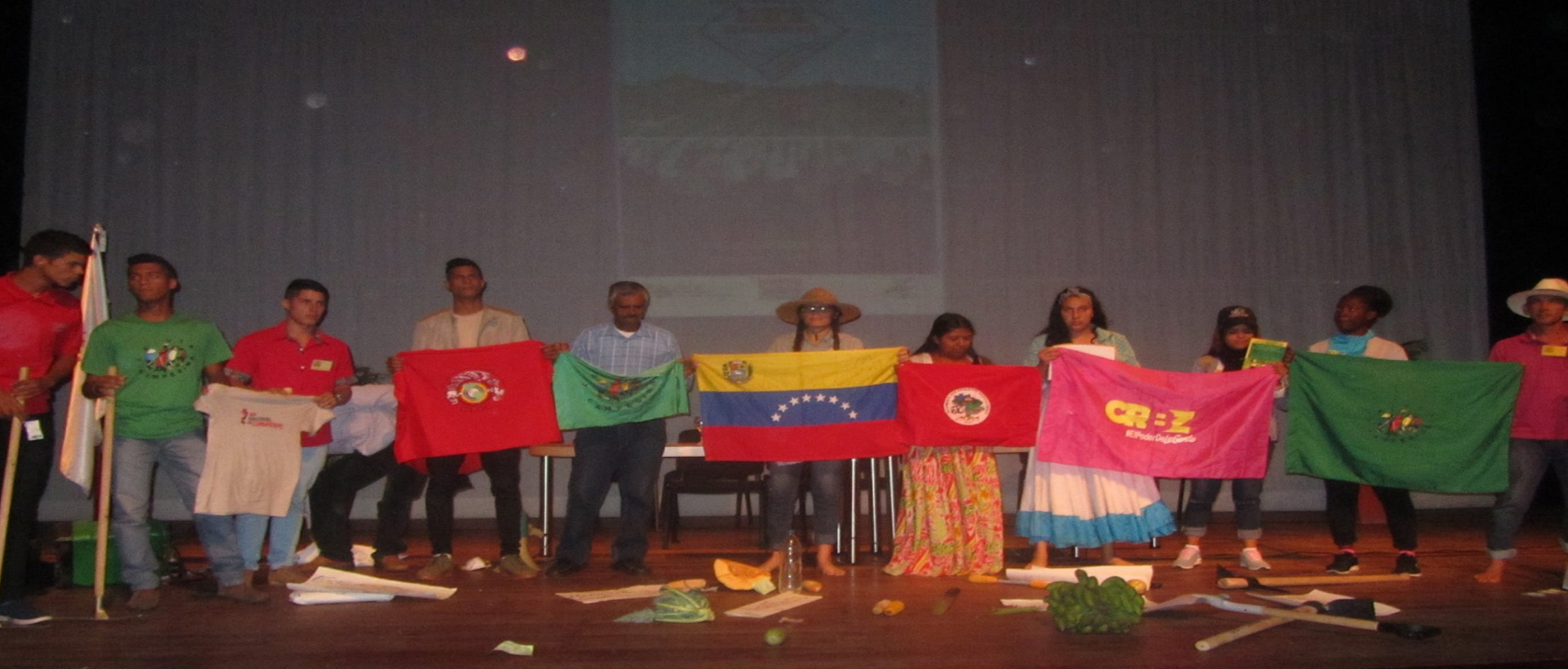
Fotografía: Luiza Preciado 2019, Mística revolucionaria, Venezuela.

Aragua, Monagas, Falcón, y ahora el III Congreso Venezolano de Agroecología del 17 al 19 de octubre en Caracas. En el marco de una coyuntura, producto de la crisis estructural del sistema capitalista que está acabando con el planeta. Venezuela propone una alternativa, con muchos errores, pero también aciertos, se abren brechas y nuevos espacios. Espacios donde la agroecología florece, los invisibles tienen voz, existen y están haciendo una propuesta diferente, pensando en lo no pensado, a partir de creatividad, la organización y los conocimientos culturales.