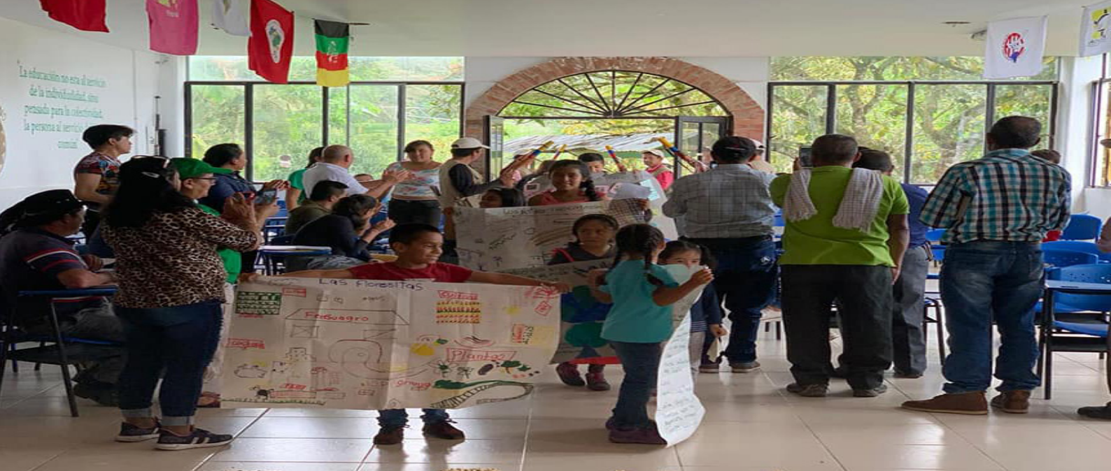
2019, Pre-congreso región centro, Viotá, Cundinamarca

organizativo, las bases del sistema capitalista, en tanto de las relaciones de poder basadas en la subordinación, sujeción y sometimiento, no son ajenos a dichas prácticas.