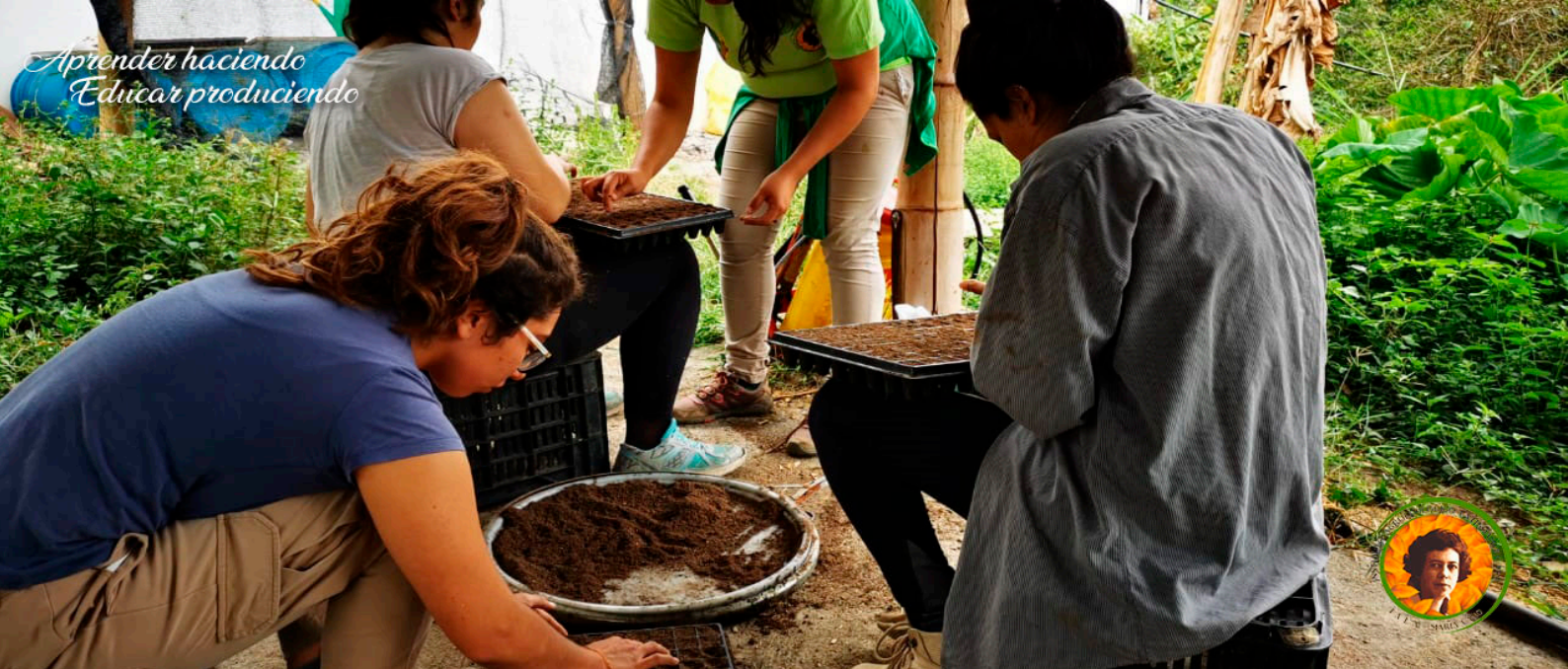
Fotografía:Alerta María Cano 2019,Hora socialmente necesaria, Viotá, Cundinamarca

histórico en todas sus conexiones y que seguimos igualmente el diálogo de las contradicciones porque pasa el progreso histórico”.