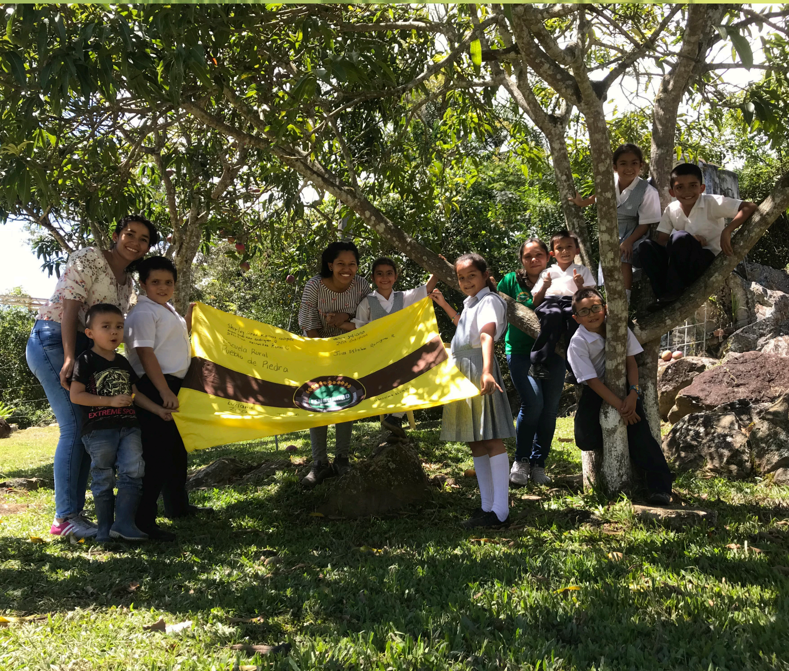
Fotografía:Alerta María Cano 2019,Cantos de esperanza, Viotá, Cundinamarca