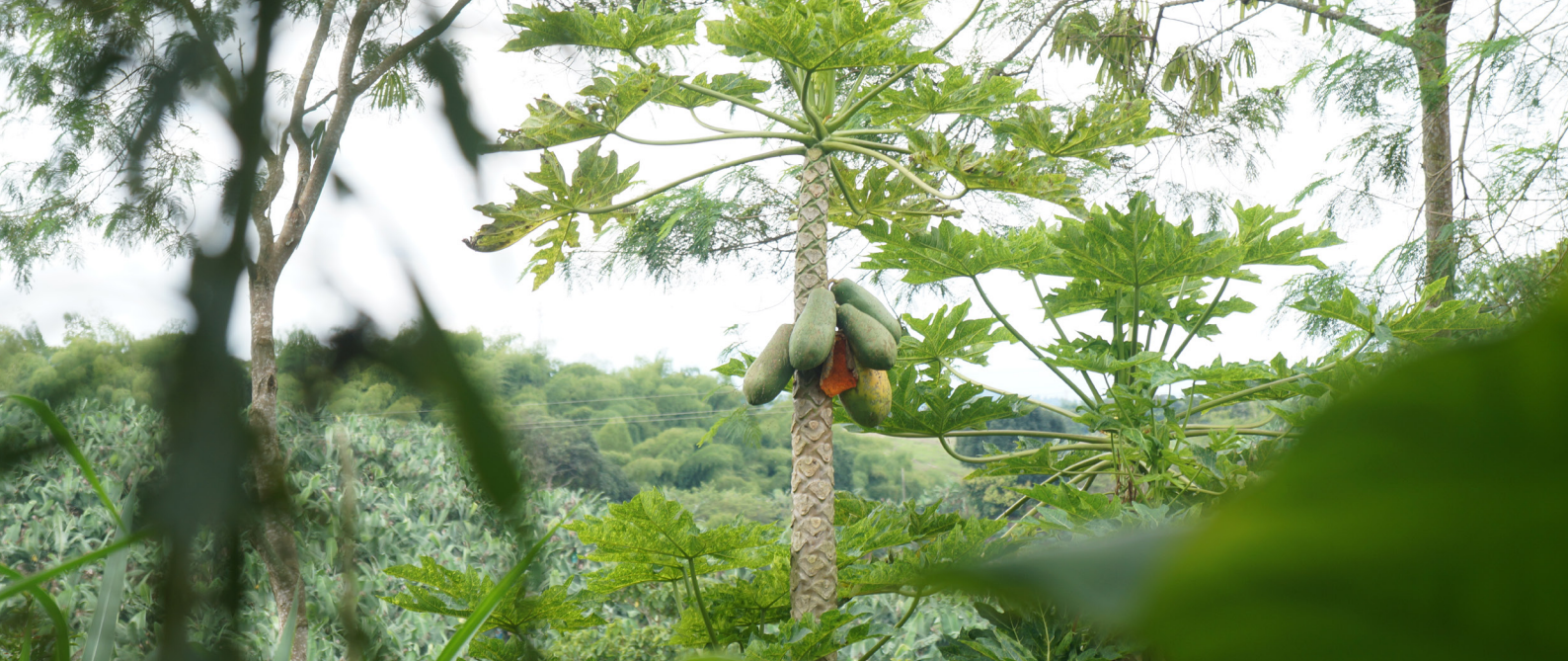
Fotografía: German León 2019, Papaya, Quimbaya, Quindío.

quesos no ha tenido la misma aceptación y apenas empieza a abrirse camino en el país.