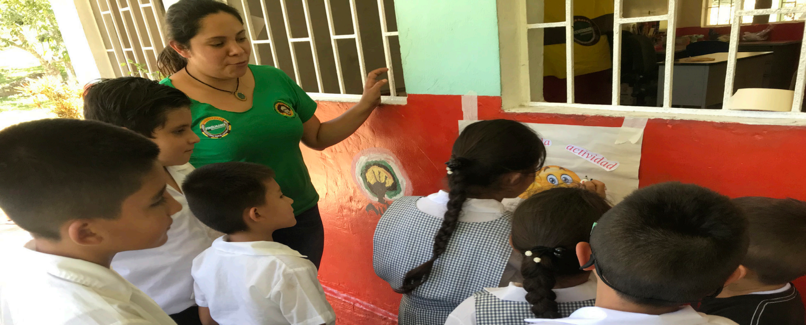
Fotografía:Alerta María Cano 2019,Evaluación participativa, Viotá, Cundinamarca

proteger el medio ambiente porque si no lo hacemos cómo vamos a tener unas plantas que nos den fruto y la tierra donde cultivamos no nos va a poder ayudar.