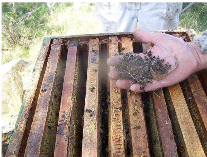
Abejas muertas por intoxicación.

La DGSA, a mediados de diciembre 2019, emitió una resolución (503/019) que fija las condiciones generales para la venta de productos a base de los siguientes ingredientes activos: Clotianidina, Imidacloprid, Tiametoxam y Clorpirifos. Establece las especificaciones para un uso “correcto y seguro” de los productos mencionados; y finalmente reconoce que un uso inadecuado de estos insecticidas puede ser potencialmente riesgosos para abejas, aves y la vida acuática. 27