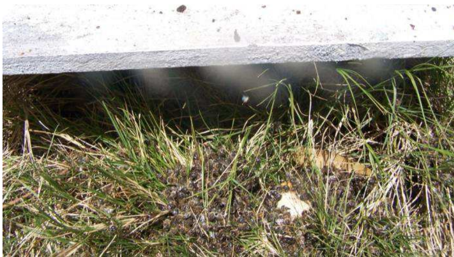
Abejas muertas por intoxicación.

Los puntos b, c y d integran lo que se denomina "Círculo vicioso de los plaguicidas" que obliga a utilizar cada vez mayores dosis con mayor frecuencia y a utilizar nuevos plaguicidas. Las poblaciones de plagas expuestas continuamente a plaguicidas son sometidas a una intensa selección natural por resistencia a los agrotóxicos. Cuando la resistencia en las poblaciones de insectos aumenta, los agricultores muchas veces reaccionan aplicando cantidades mayores en forma más frecuente o usando principios activos diferentes, contribuyendo, así, a las condiciones que promueven mayor resistencia. Por otro lado, en la gran mayoría de los casos, una vez que se aplica el plaguicida se eliminan también los enemigos naturales de las plagas y por consiguiente éstas resurgen con mayor fuerza una vez que desaparece el efecto del plaguicida.