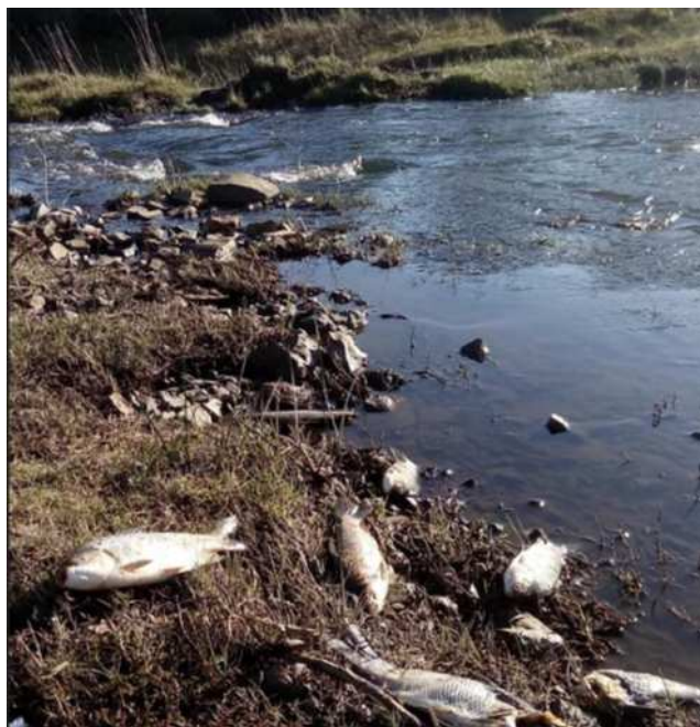
Peces muertos por intoxicación.

Con la salvedad de la Atrazina, los demás productos llevan la etiqueta de Categoría I, correspondiente a los que se catalogan como altamente tóxicos para los humanos, los peces y las abejas, y el ambiente.