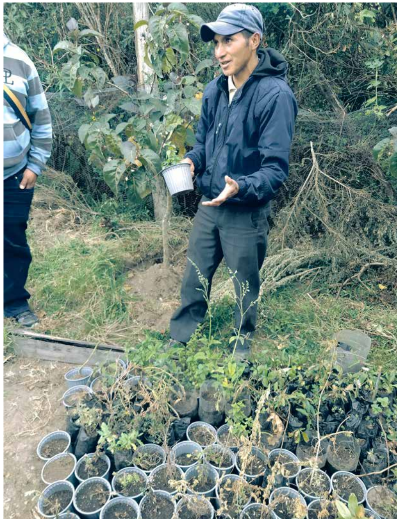
Promotor y líder comunitario de la comunidad de Chuchilán en la provincia de Cotopaxi, quien comparte semillas y plantas nativas de su parcela para otros agricultores, al mismo tiempo de compartir sus conocimientos sobre el cuidado y mantenimiento de las plantas sin el uso de químicos.