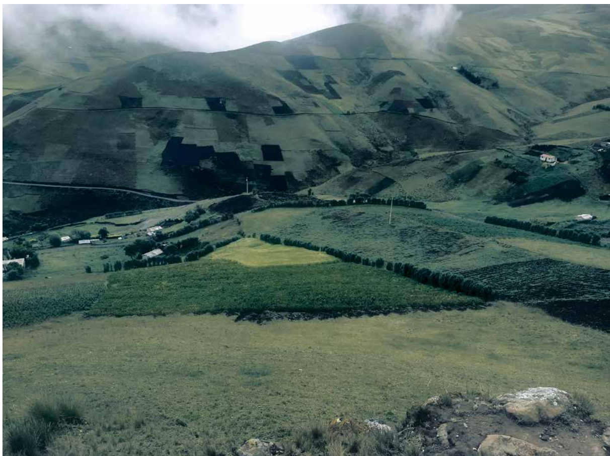
Parcelas de comunidades indígenas en páramos de la provincia de Chimborazo, donde podemos ver cercas vivas usadas como cortina rompevientos, para prevenir los daños de las heladas en los cultivos.

Miramos con preocupación que países como México, Colombia, Perú, Chile, Honduras y El Salvador han sufrido en las últimas décadas un proceso de in-