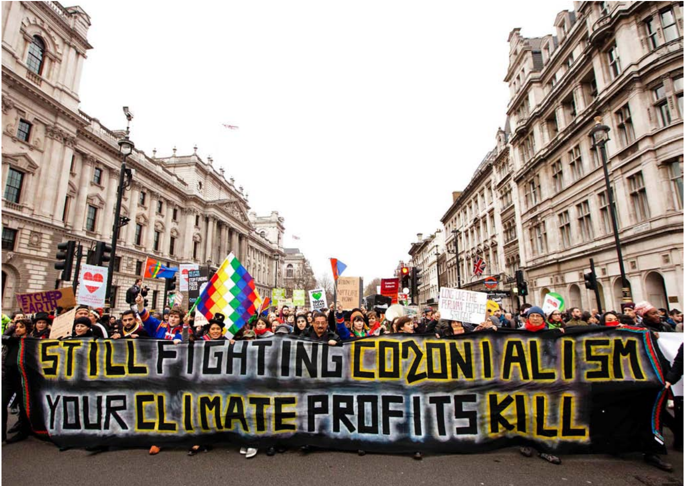
Manifestación por el clima en Londres.

animales producido de manera sustentable. Y en el caso del café y cacao, quiere que los agricultores que los abastecen incorporen una explotación agroforestal y un mejor manejo del suelo. Pero muchas de estas tecnologías, supuestamente amigables con el clima, no están probadas y no hay un plan claro sobre cómo sus proveedores harán la transición hacia las prácticas regenerativas y quién pagará para que esto ocurra.