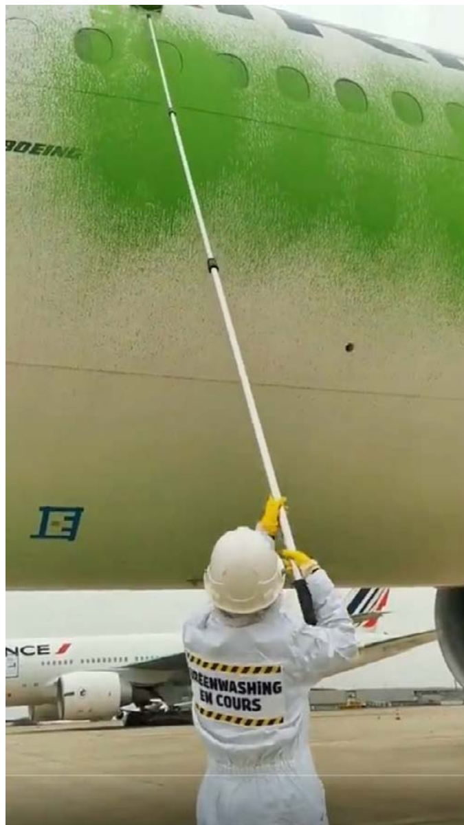
Acción de lavado de imagen verde de Greenpeace contra Air France, 5 de marzo de 2021.

El problema al que nos confrontamos no es cómo lograr que los BlackRocks o Nestlés de este mundo inviertan en soluciones a la crisis climática. Es cómo retomar el control sobre los fondos, los recursos y los gobiernos que hoy son prisioneros de las corporaciones, de tal modo que se apoyen soluciones genuinas a la crisis climática y que sirvan a las necesidades de la gente.