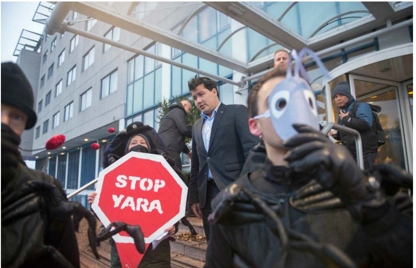
Activistas de la campaña Fossil Free Agriculture protestan frente a la Cumbre Europea de Fertilizantes Minerales.

Las “emisiones netas cero” y “las soluciones basadas en la naturaleza” son un enorme fraude