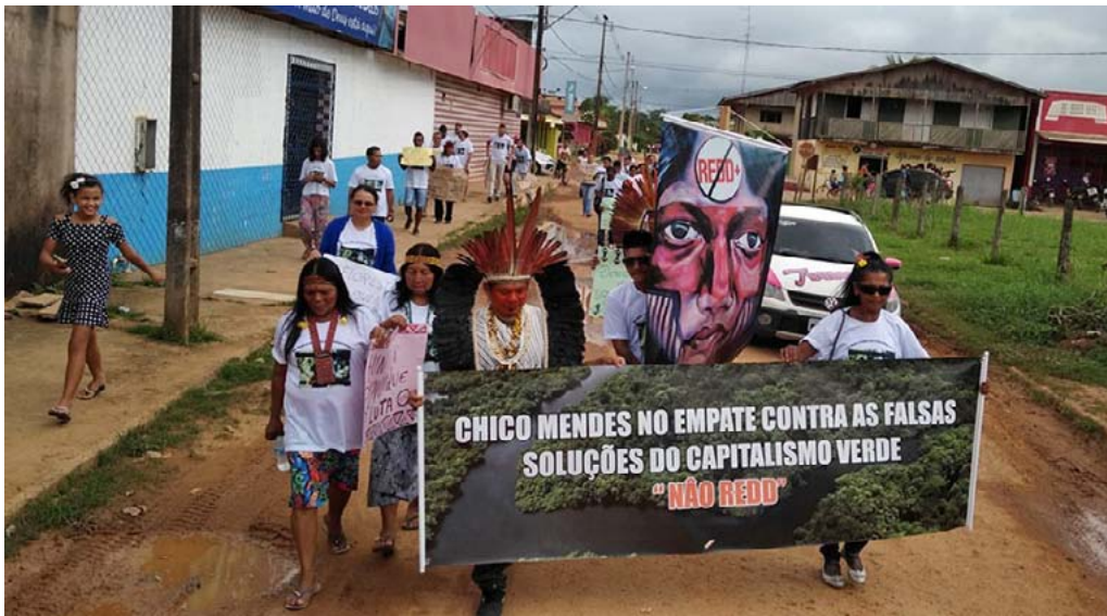
Manifestación contra el capitalismo verde en Xapuri.

corporativo, que se basa sobre todo en compensaciones, se está tornando más peligroso que la negación climática de hace unos meses.