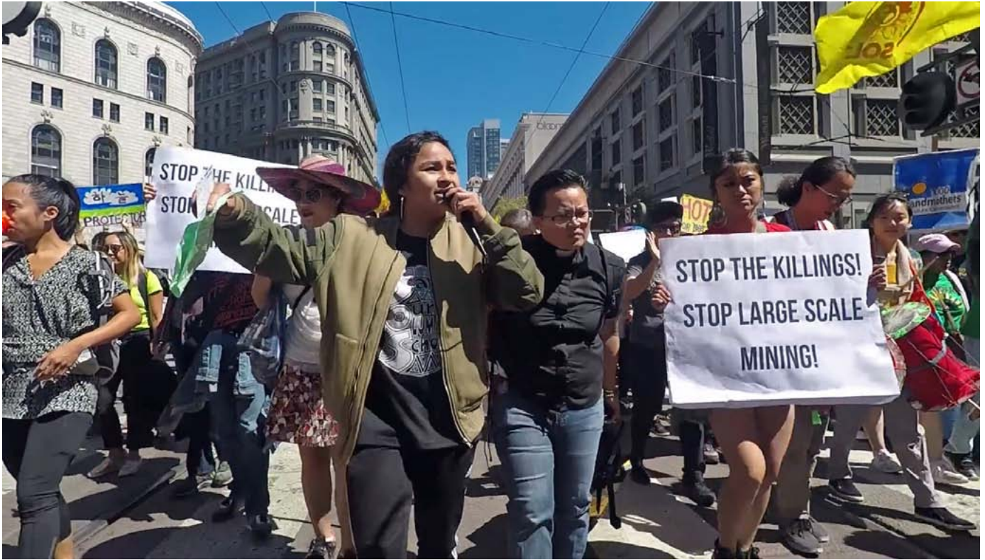
Manifestación por el clima en San Francisco, Estados Unidos, 2019.

a implementar acciones que les impidan obtener sus utilidades y lucharán contra cualquier actor, ya sean gobiernos o comunidades directamente afectadas, que se interpongan en su camino. Sólo cambiarán cuando se vean forzadas a hacerlo.