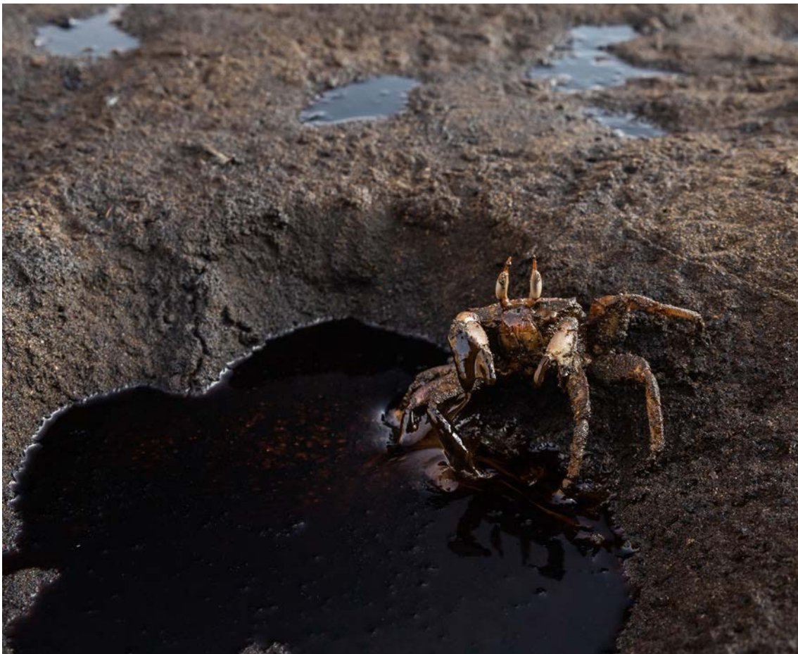
En la retirada playa de San Gaspar, en Aucallama, existen zonas donde no han llegado los equipos de limpieza y donde las especies luchan por sobrevivir.