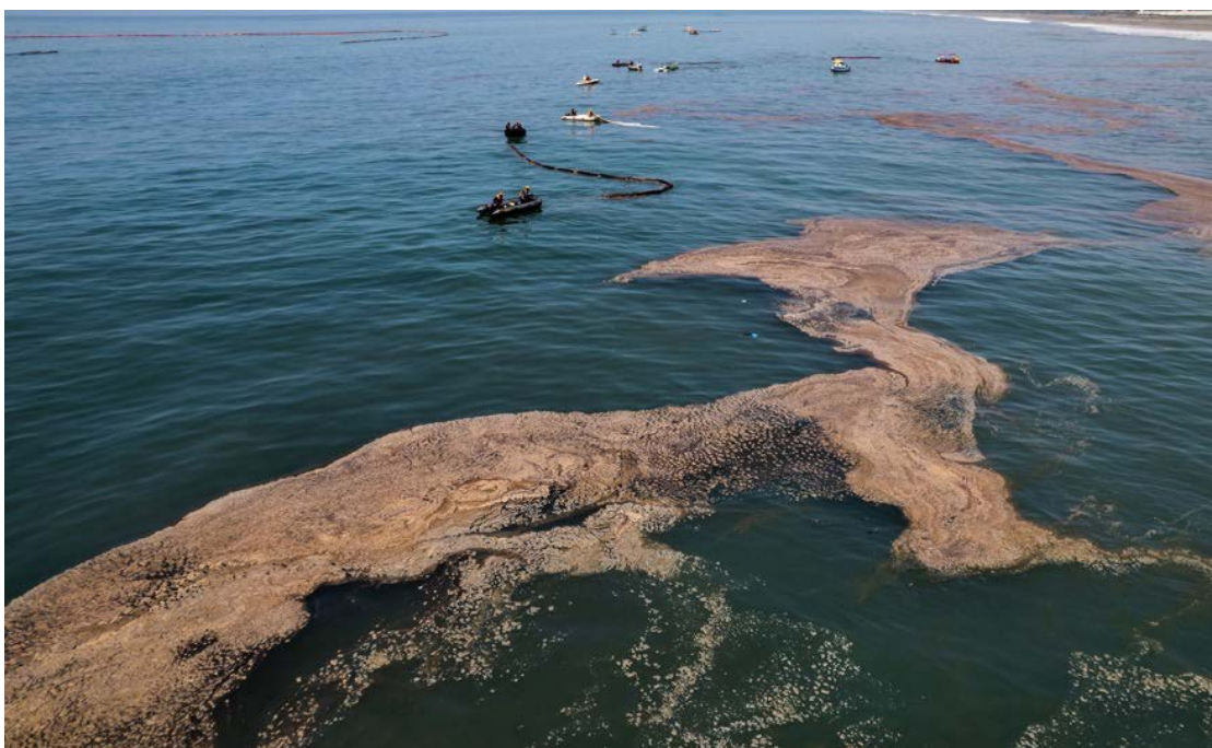
Rastros de petróleo en la playa Chacra y Mar, Aucallama, el 2 de febrero.