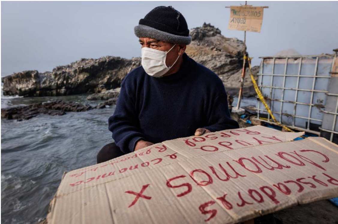
Los pescadores de Callao y Lima región son uno de los grupos afectados directamente por el derrame.