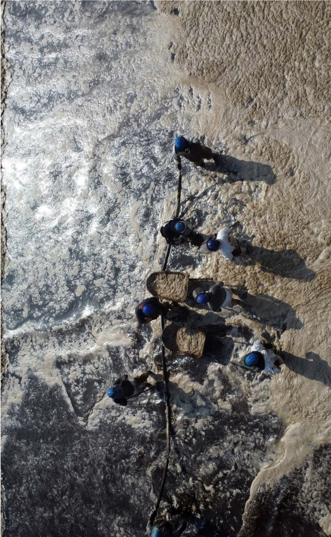
Trabajos de limpieza en la playa Cavero, Ventanilla, el 19 de enero.