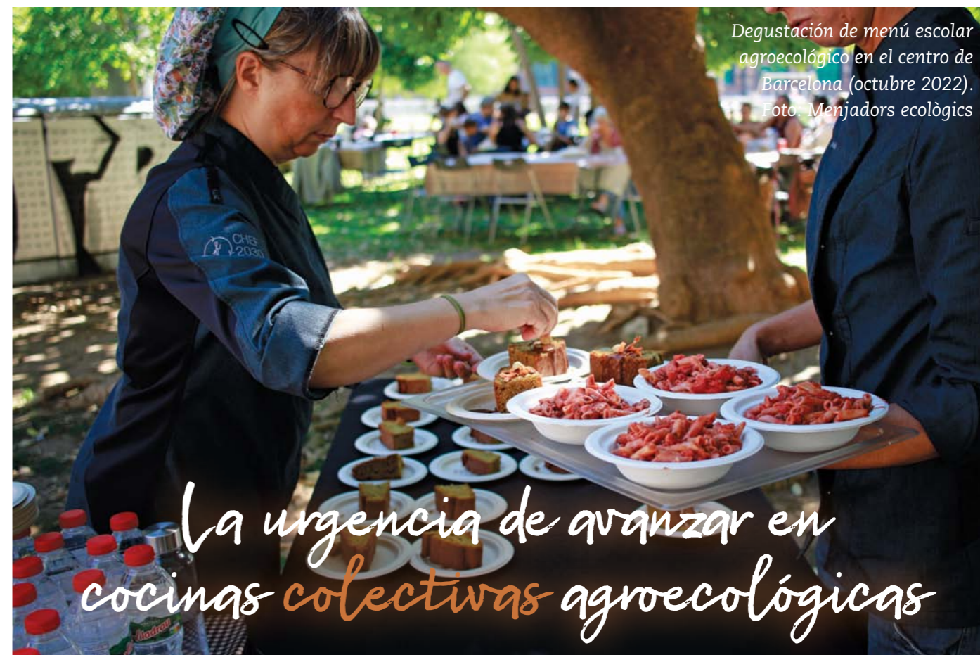
Degustación de menú escolar agroecológico en el centro de Barcelona (octubre 2022).

La urgencia de avanzar en cocinas colectivas agroecológicas