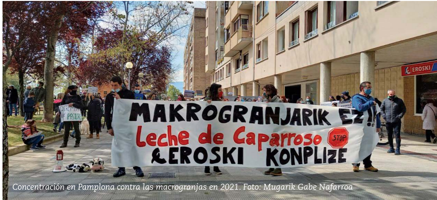
Concentración en Pamplona contra las macrogranjas en 2021.