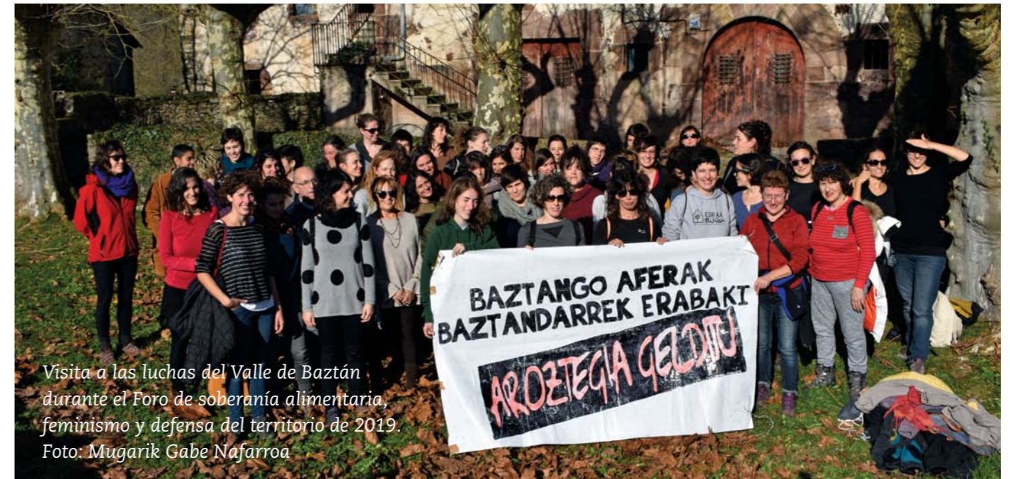
Visita a las luchas del Valle de Baztán durante el Foro de soberanía alimentaria, feminismo y defensa del territorio de 2019.

Con esta primera foto de multitud de iniciativas diversas que se van conociendo y relacionando en diferentes espacios, la siguiente