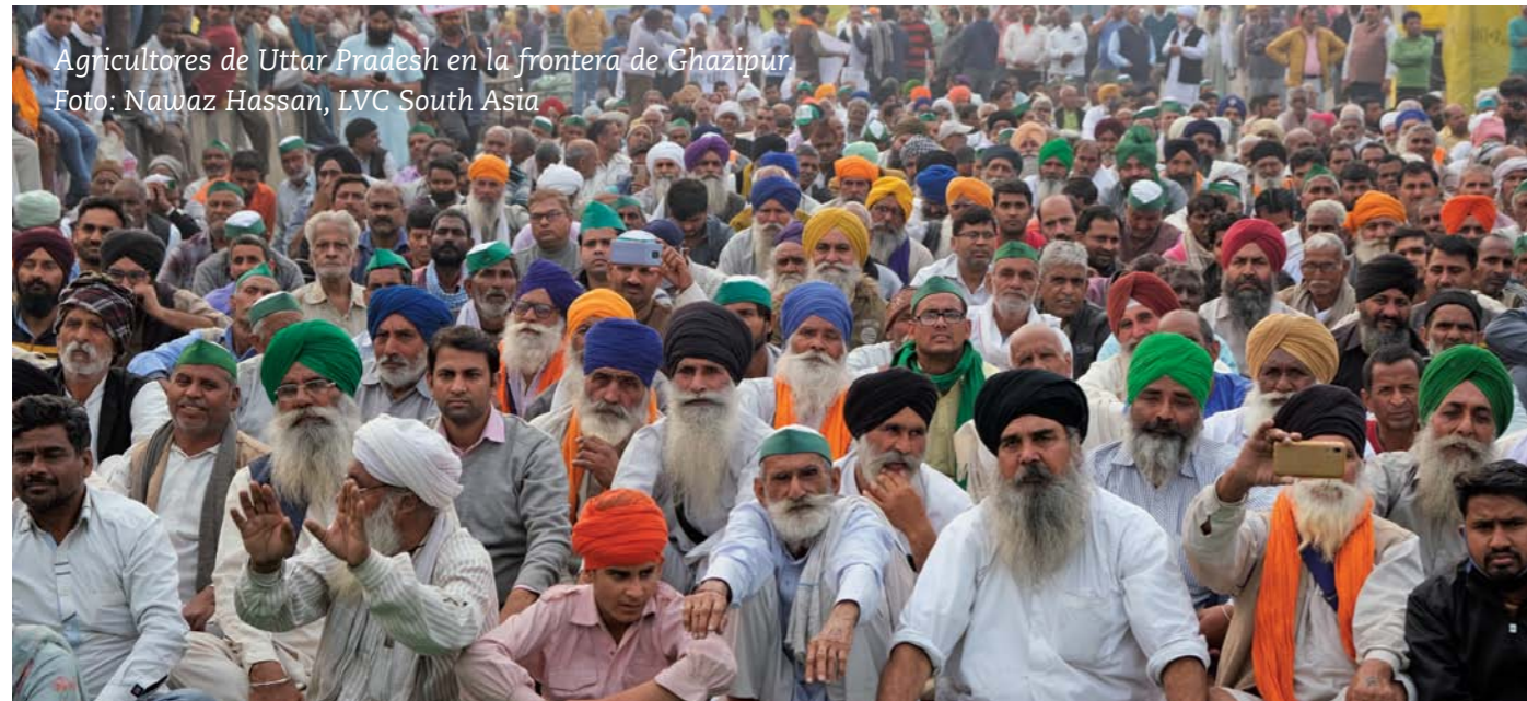
Agricultores de Uttar Pradesh en la frontera de Ghazipur.

exponer al mundo el entramado que se teje entre las empresas agrícolas y el gobierno, con tres leyes concebidas para beneficiar a las grandes corporaciones agrícolas de la India. A pesar de que el gobierno se vanagloria de que India es la economía con el crecimiento más rápido, lo cierto es que uno de cada dos agricultores del país está endeudado y la media de ingresos mensuales por hogar agrícola (con una media de 5 personas) es inferior a 6426 rupias (menos de 80 dólares estadounidenses), mientras que sus gastos ascienden a 6.223 rupias. La oposición a las leyes agrarias era una cuestión de vida o muerte para estas familias, ya que casi el 50 % de los 1.300 millones de habitantes de la India dependen de la agricultura y de trabajos relacionados con ella.