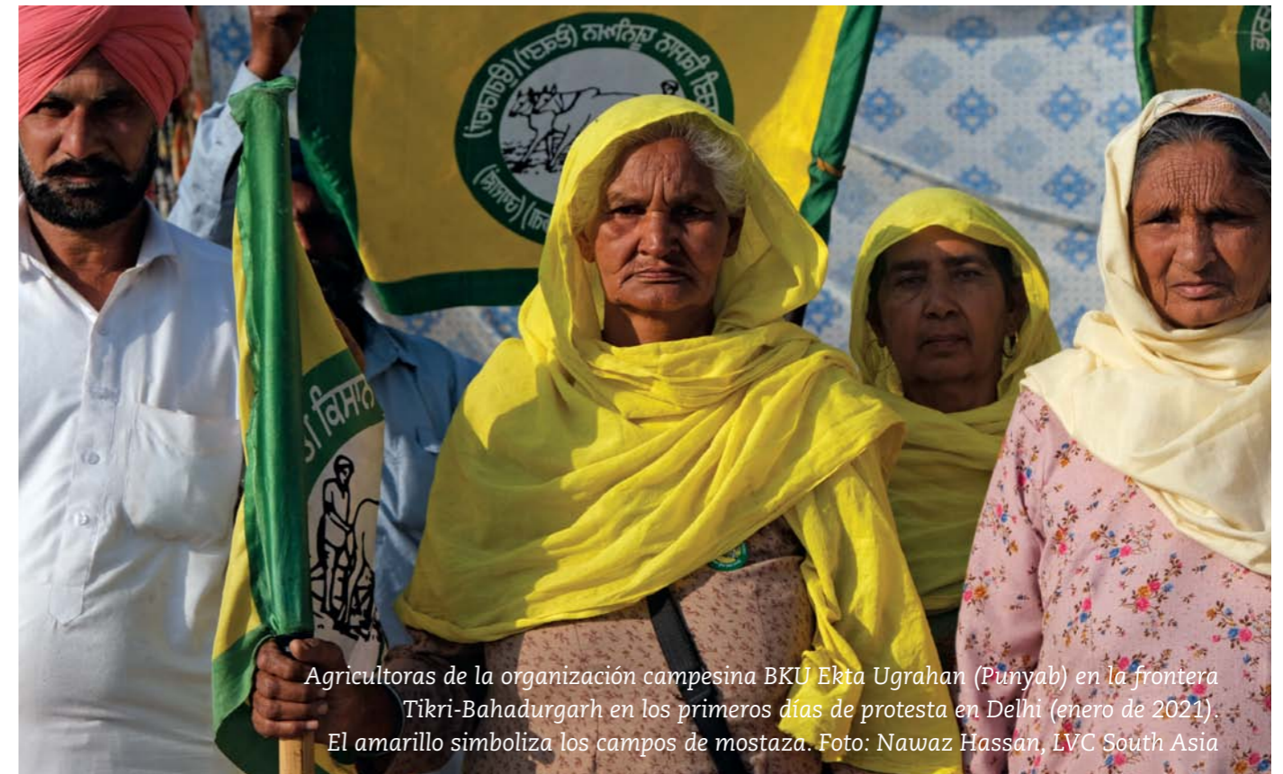
Agricultoras de la organización campesina BKU Ekta Ugrahan (Punjab) en la frontera Tikri-Bahadurgarh en los primeros días de protesta en Delhi (enero de 2021). El amarillo simboliza los campos de mostaza.

¿Por qué y cómo comenzó esta histórica protesta? Aprovechando la pandemia del COVID-19 y el confinamiento, el gobierno de la India promulgó el 5 de junio de 2020 tres ordenanzas que entraron en vigor el mismo día e introdujeron cambios fundamentales en el sistema de comercialización agrícola de la India. A pesar de que la agricultura es una cuestión de Estado según la Constitución india, no se consultó a los gobiernos