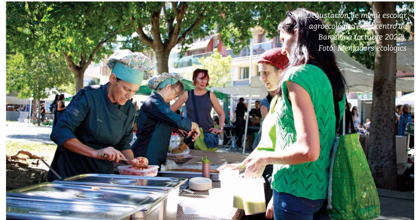
Degustación de menú escolar agroecológico en el centro de Barcelona (octubre 2022).

La competencia de la regulación de los comedores escolares es de las comunidades autónomas; así que cada una de ellas ha elaborado la