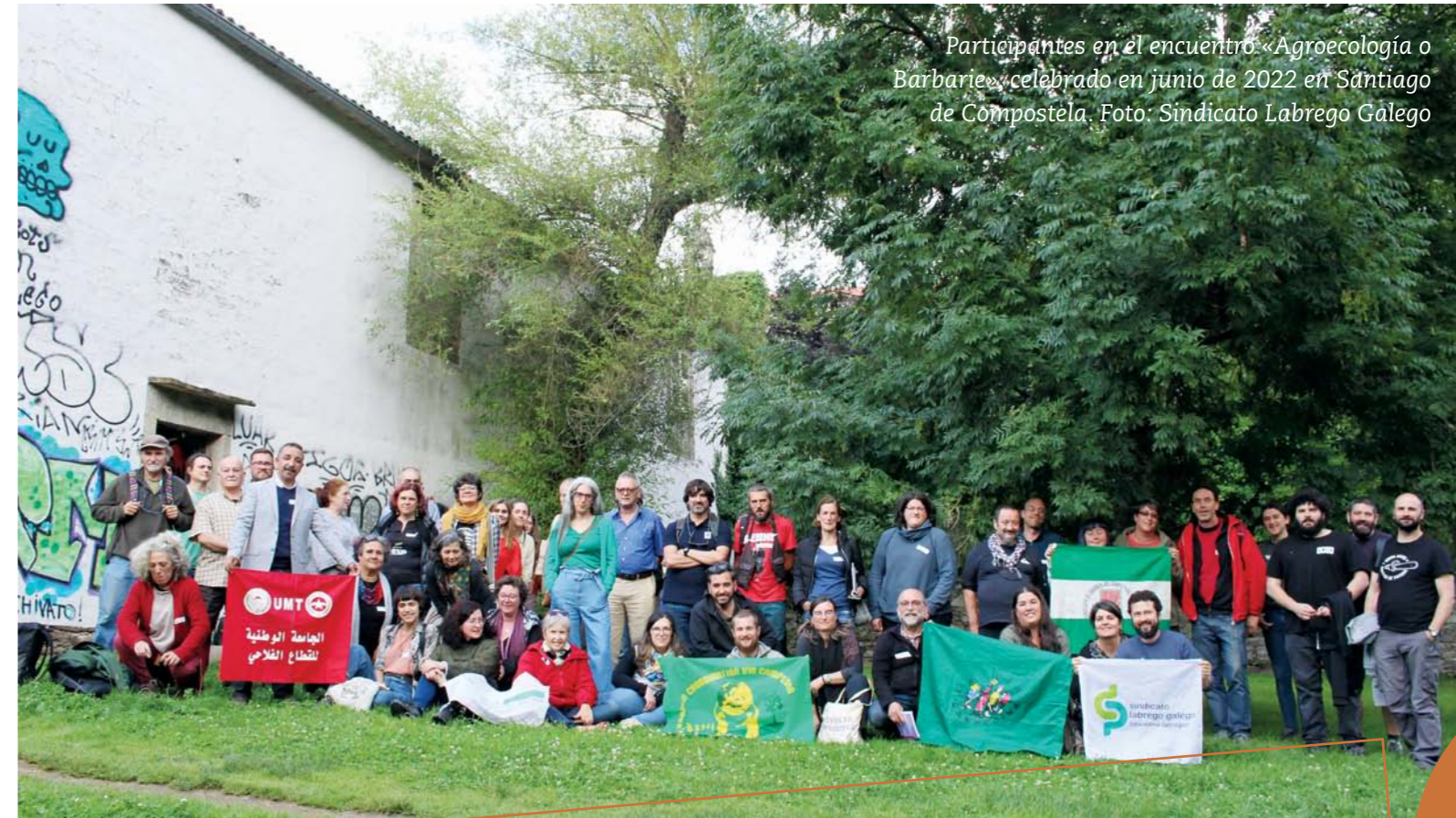
Participantes en el encuentro «Agroecología o Barbarie» celebrado en junio de 2022 en Santiago de Compostela.