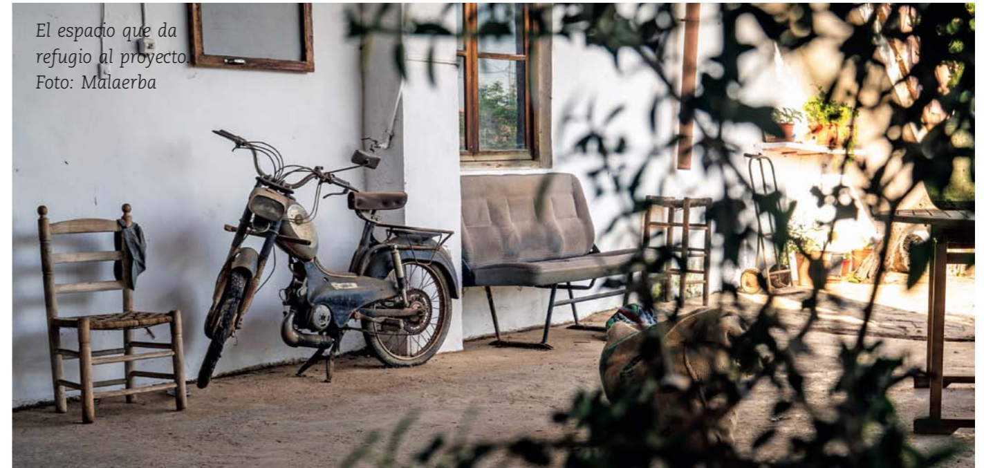
El espacio que da refugio al proyecto.

Cooperativa El Pa Sencer y Asociación Menjadors Ecològics