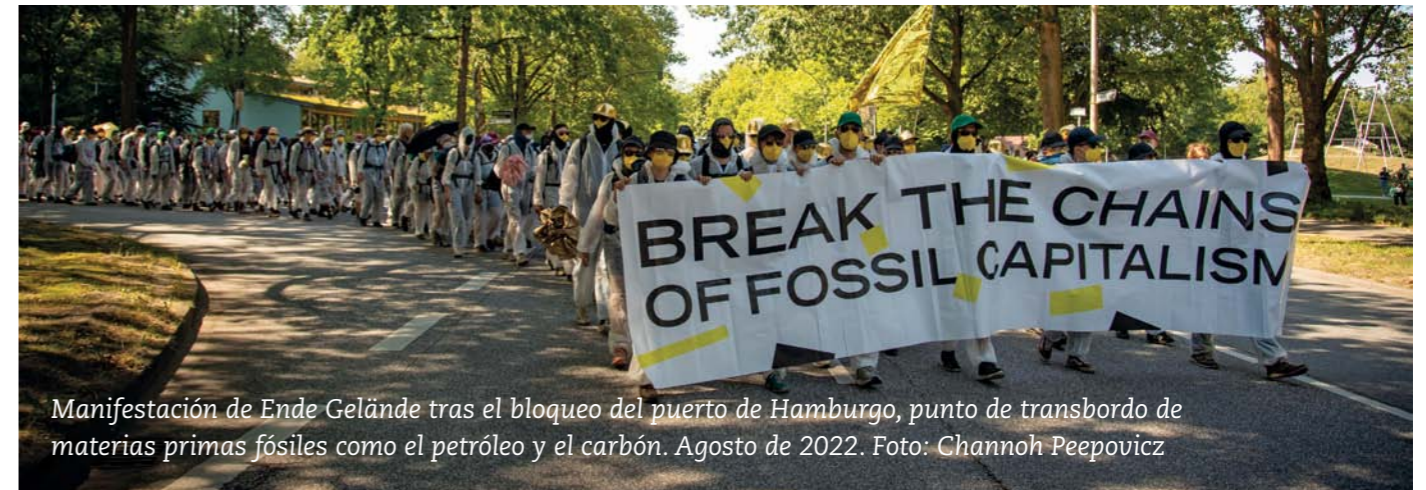
Manifestación de Ende Gelände tras el bloqueo del puerto de Hamburgo, punto de transbordo de materias primas fósiles como el petróleo y el carbón. Agosto de 2022.

alimentarias locales de Catalunya y proyectos de distribución agroecológica.