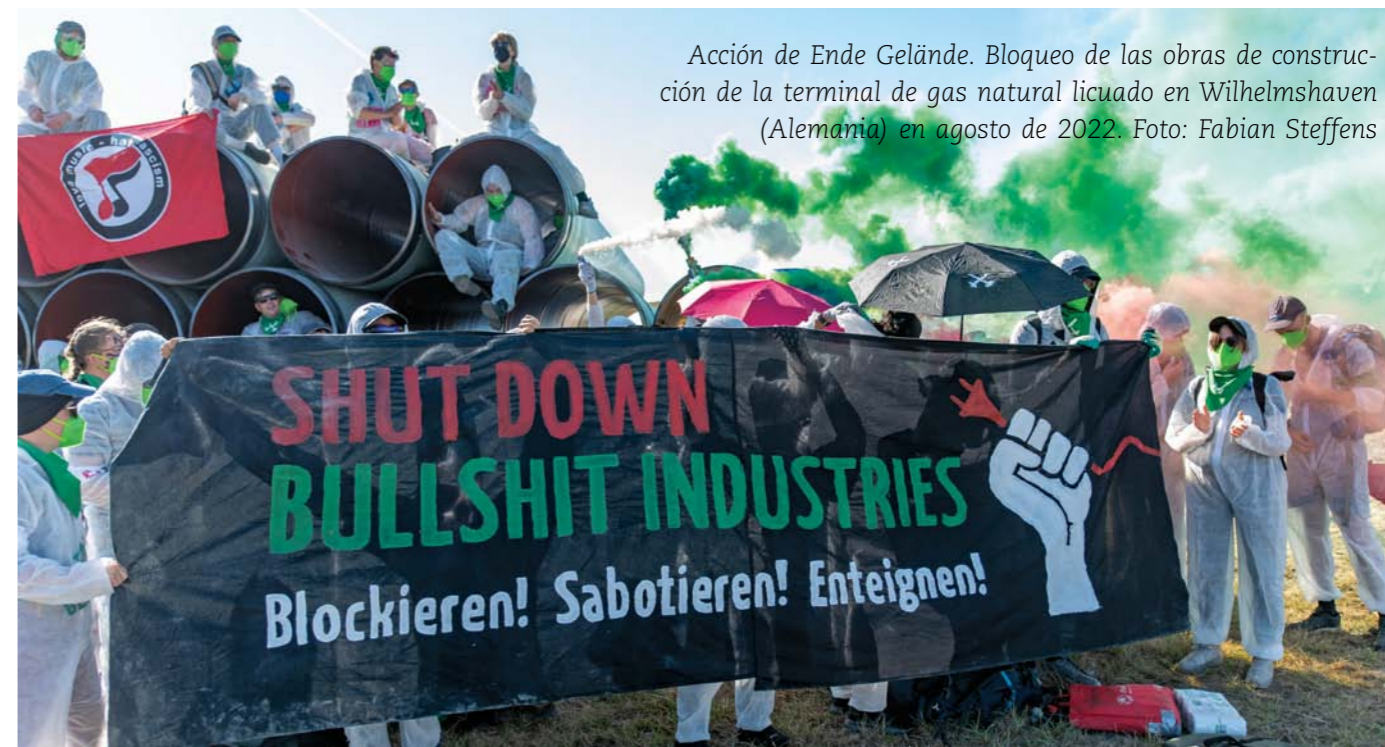
Acción de Ende Gelände. Bloqueo de las obras de construcción de la terminal de gas natural licuado en Wilhelmshaven (Alemania) en agosto de 2022.

contamos con el músculo para implementar la transformación necesaria que ponga realmente la vida en el centro del sistema alimentario. Necesitamos que el campesinado esté en el núcleo, pero al mismo tiempo somos conscientes de que es un colectivo cada vez más reducido, altamente envejecido y a menudo poco entendido en un contexto mayoritariamente urbanocéntrico. ¿Por dónde empezamos?