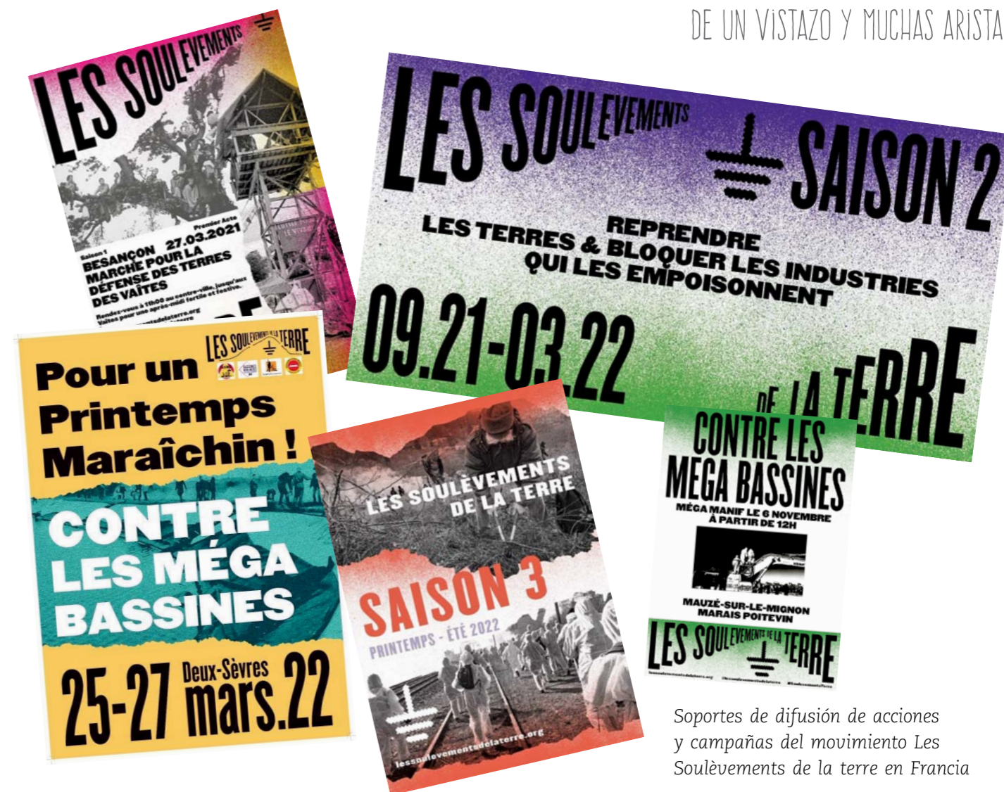
Soportes de difusión de acciones y campañas del movimiento Les Soulèvements de la terre en Francia