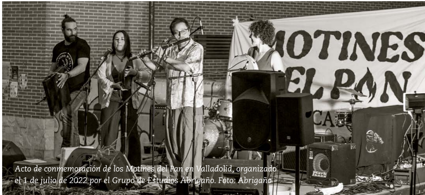
Acto de conmemoración de los Motines del Pan en Valladolid, organizado el 1 de julio de 2022 por el Grupo de Estudios Abrigaño.