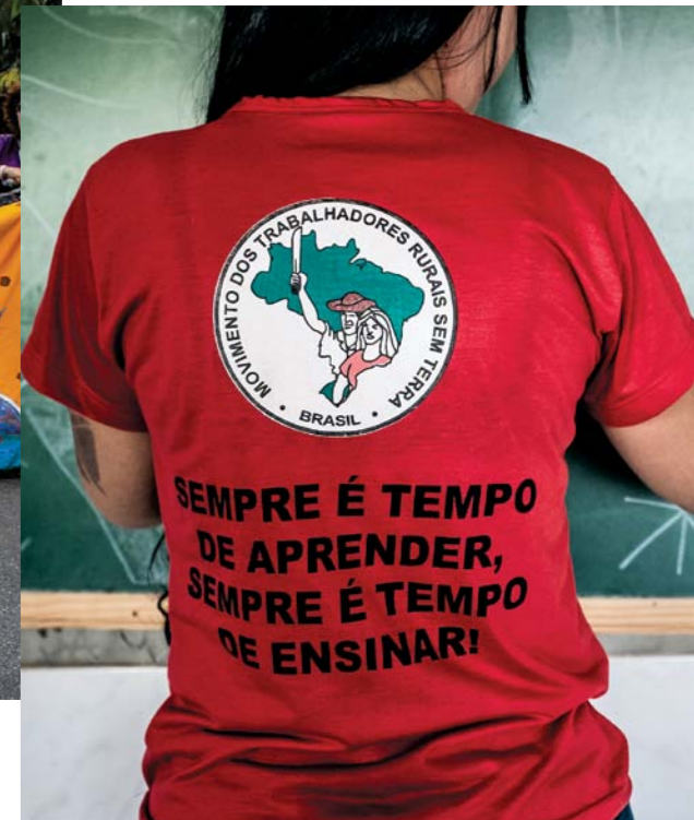
Escuelas de alfabetización campesina del Movimiento Sin Tierra (MST) en Maranhão, Brasil. ▶

sentimos copartícipes de las tomas de decisiones; pero, cuando no, los vemos como un lugar lejano para que medren y se beneficien unos pocos.