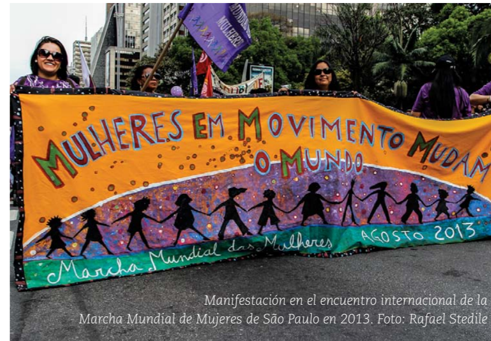
Manifestación en el encuentro internacional de la Marcha Mundial de Mujeres de São Paulo en 2013.

También tenemos, ante los conflictos, los métodos político-democráticos. Usados para hacernos más llevadera la vida política y comunitaria. Con sistemas de elecciones, partidos, sindicatos, asociaciones, formas de cabildo, etc., que pretenden ayudar a que se resuelvan litigios mediante el debate, la votación y el acuerdo. Cuando funcionan, nos