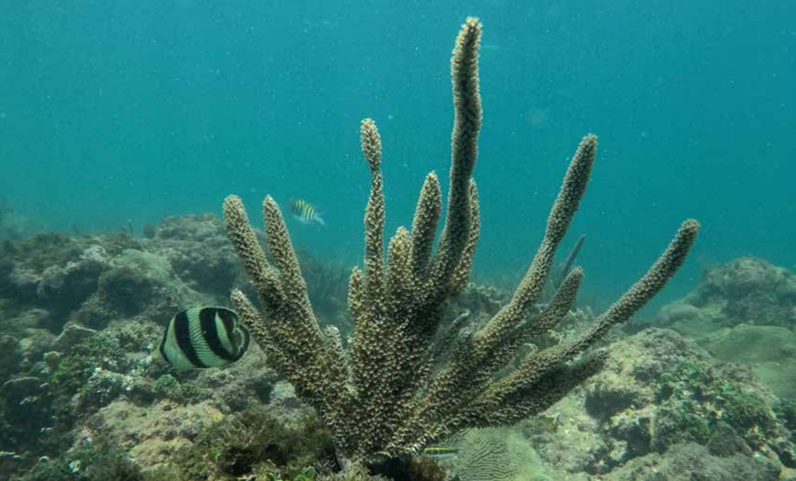
Una de tantas variedades de coral en el Caribe Sur.