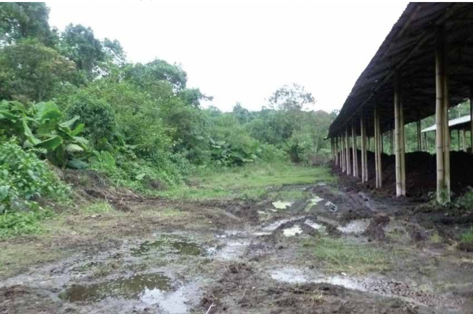
Galpones con detritos producidos por las granjas fabriles en territorio de los tsáchila