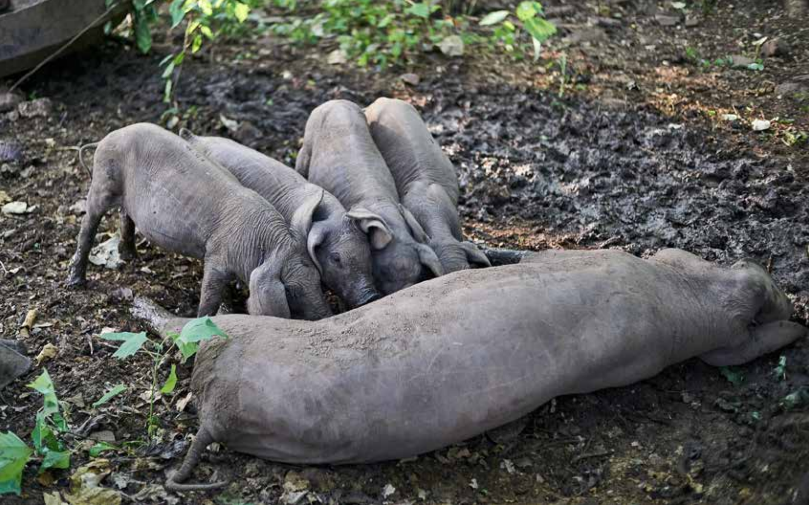
Cerda criolla con sus crías. Ver www.ceccam.org

drástica reducción de brotes, quedando totalmente erradicada en 1955. Según las cifras oficiales, con el “rifile sanitario” se sacrificaron más de un millón de cerdos. La erradicación de la fiebre aftosa representó uno de los más grandes éxitos sanitarios en México, lo que permitió entrar de lleno al mercado internacional de productos cárnicos.