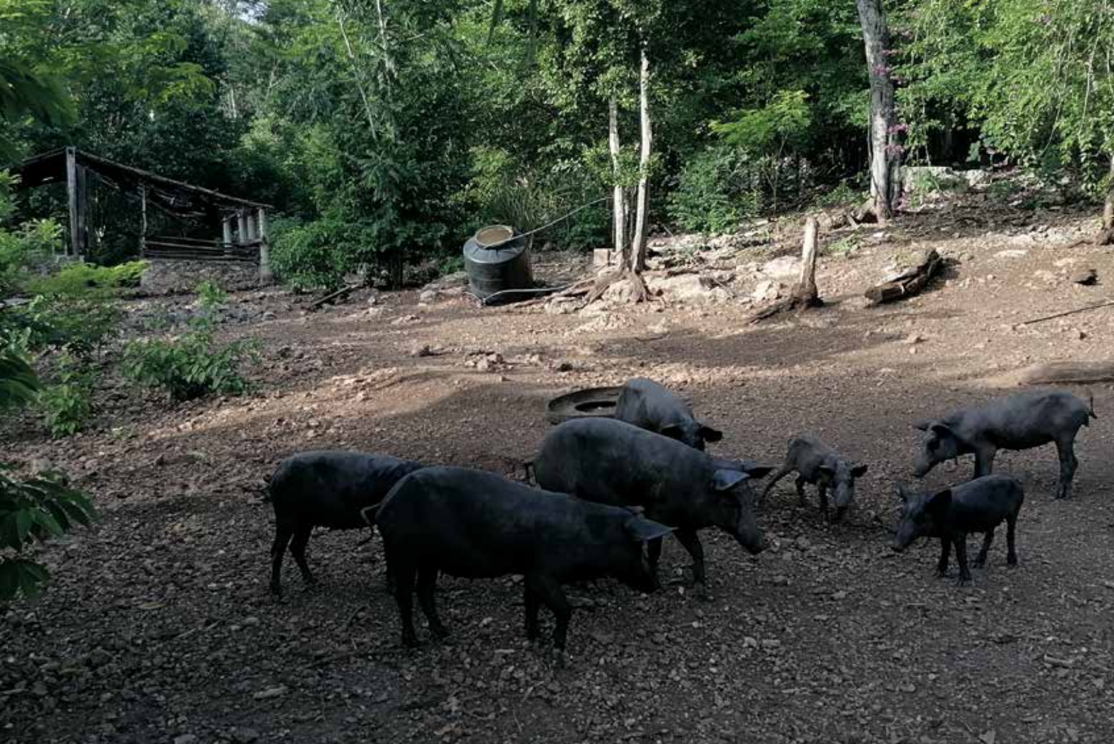
Cerdos criollos en la Península de Yucatán, México, ver www.ceccam.org