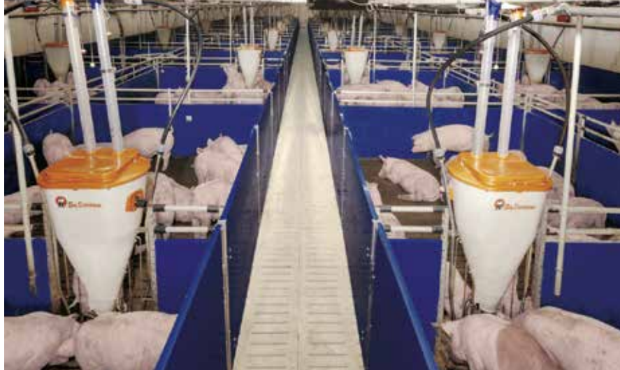
Una mega granja tecnificada. Ver www.ceccam.org

En Yucatán, México, varias comunidades están defendiendo su territorio, la naturaleza y su forma de vida (milpa, apicultura, ecoturismo de cenotes) ante la expansión de las fábricas