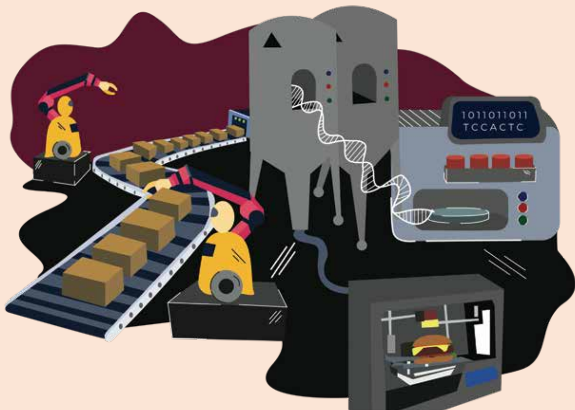
Ilustración: “fábrica-laboratorio de producción cárnica”, Cathy Dizon