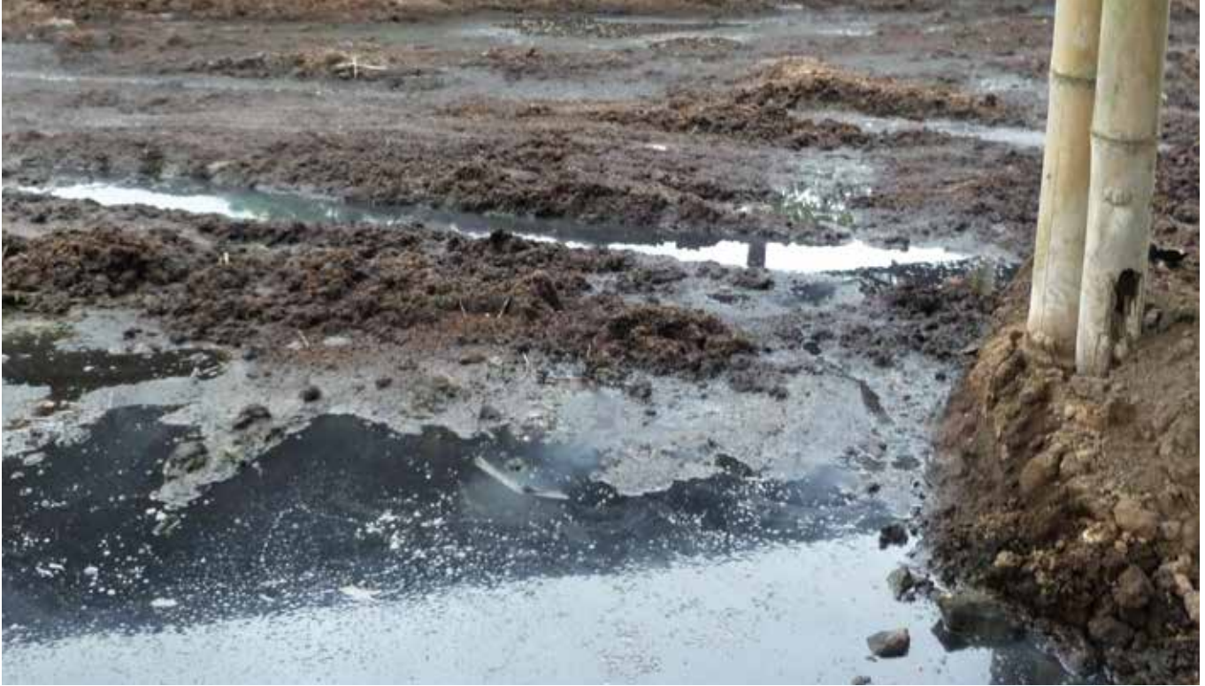
Lodo y desechos tóxicos aledaño a las granjas fabriles en territorio tsáchila.

se expanden desde Estados Unidos, donde es el modelo predominante de producción, a América Latina y otras partes del mundo.