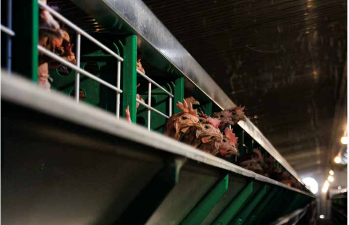
Fragmento de un galpón de gallinas poniendo huevos en una granja industrial.

Los llamados “sumideros de carbono”, con los que las empresas compran su derecho a contaminar, son pingües negocios para las mismas