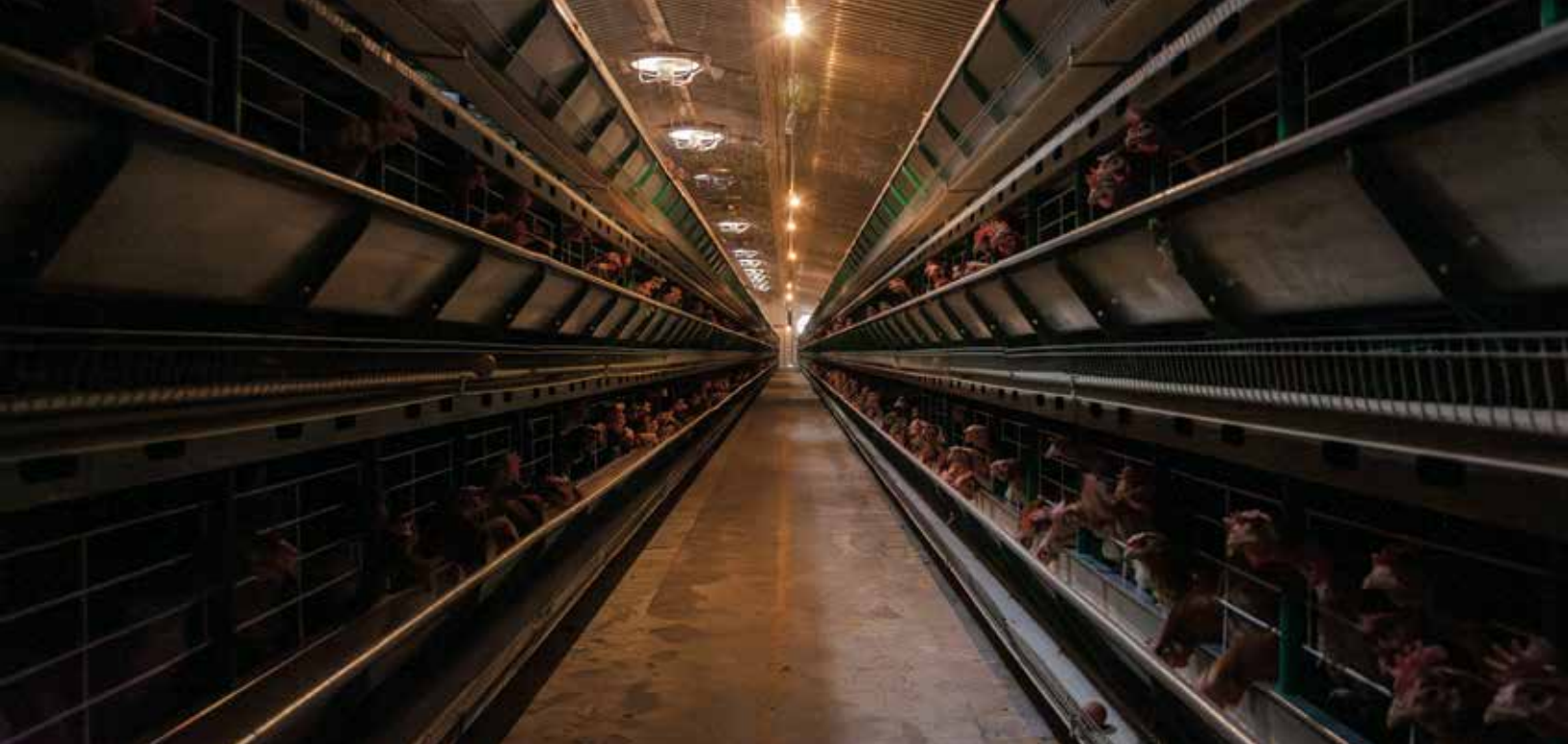
Mega instalaciones de gallinas ponedoras.

El concentrar miles de animales en un espacio reducido produce grandes cantidades de desechos (heces y orina) que contaminan el suelo, el aire y el agua y afectan la salud de la naturaleza, las personas y los animales