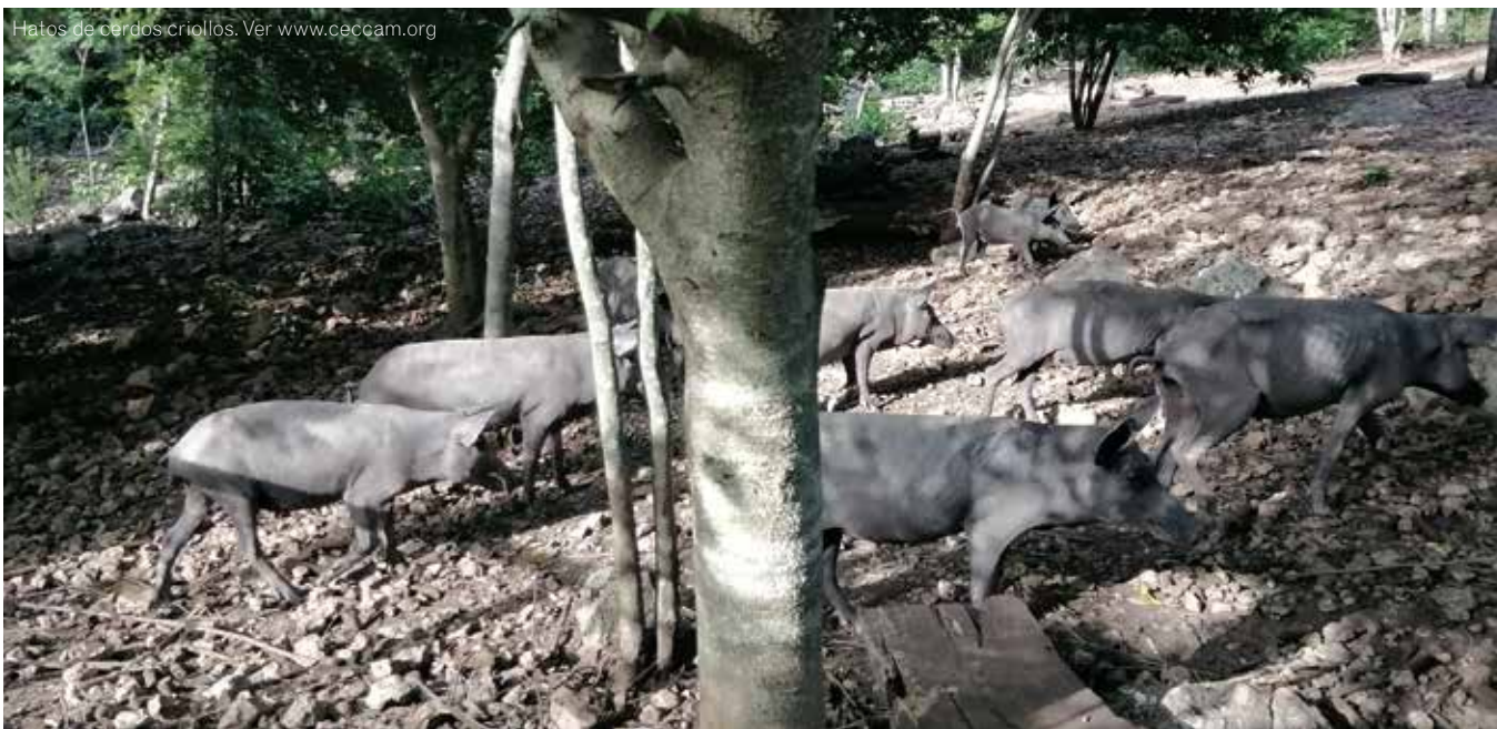
Hatos de cardos criollos. Ver www.ceccam.org

*Fragmento de La destrucción de la porcicultura campesina y la imposición de la porcicultura industrial transnacional publicado por el Centro de Estudios para el Cambio en el Campo Mexicano (Ceccam), 2020