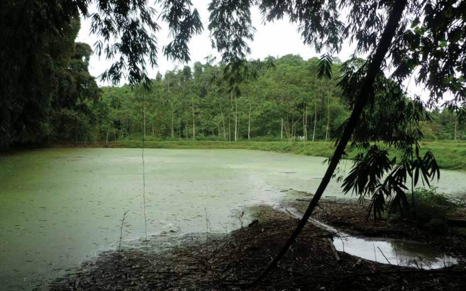
Río en Territorio Tsáchila contaminado con desechos de las granjas fabriles.