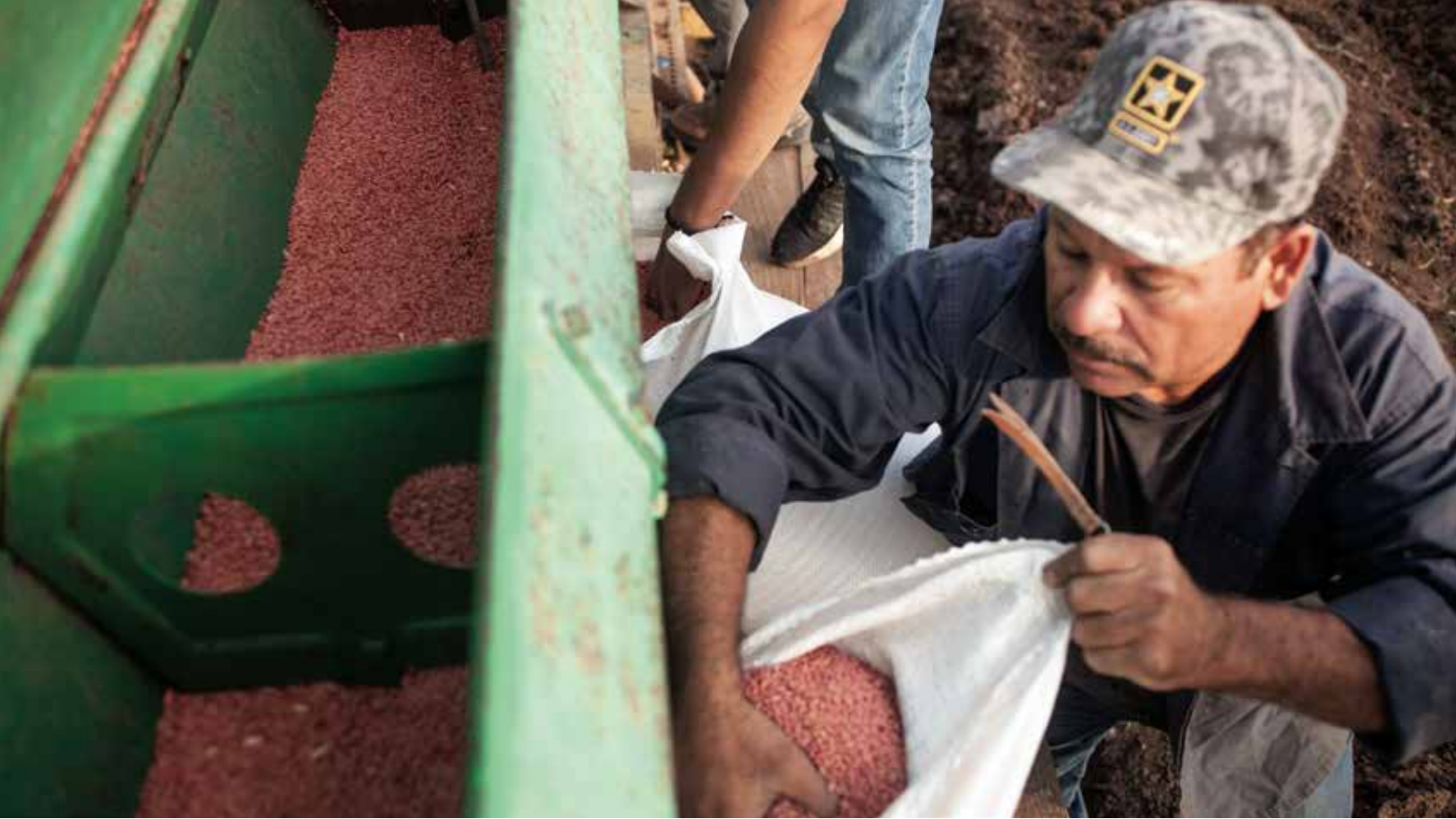
Colectando trigo convencional para sembrar en Tesia, Sonora, México. Un territorio todavía libre del trigo GM.