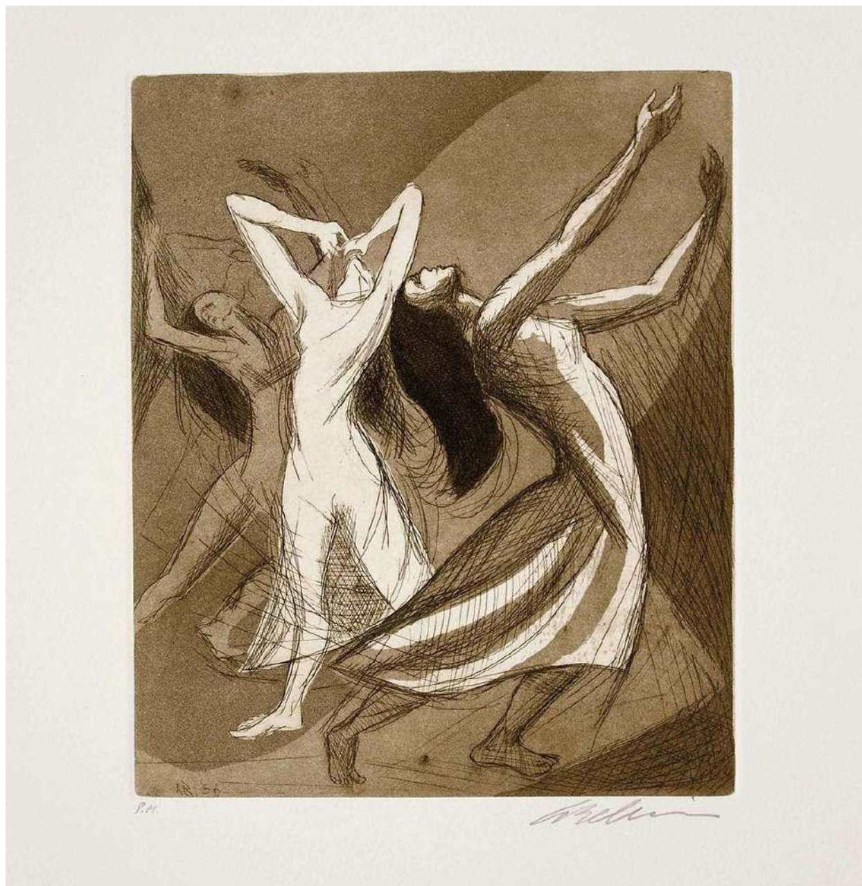
Grabado de Arnold Belkin, Museo Nacional de la Estampa

Está conformada por diez relatos, con numerosos personajes y voces. "Bájate", "Cobarde" y "El silencio" tienen como protagonista a Sergio, primo y objeto de deseo de Pablo. El primero es un relato más anecdótico, acerca del pasado del personaje; el segundo una carta dedicada a Pablo, donde le pide perdón por haberlo traicionado en el pasado; y el último una reconstrucción hecha por Pablo acerca de los últimos momentos de vida de Sergio. "Árboles secos" y "Piel de gallina" son historias que tienen