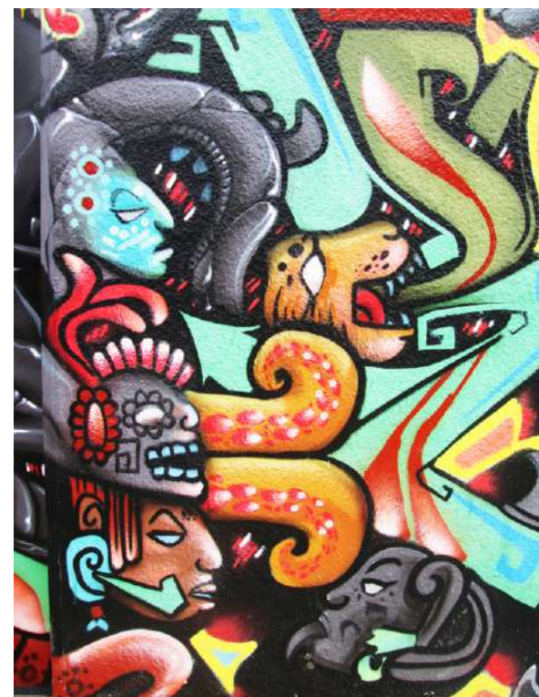
Mural callejero en La Misión, San Francisco, California.

Los ingredientes vanguardistas de la experiencia de Othón y los suyos han sido superados por el protagonismo actual de los pueblos originarios en todo el país, desde sus regiones y a escala nacional en las décadas posteriores al fenómeno de Alcozauca. Lejos aún de la autonomía que se volvió la demanda más profunda y difícil (sistemáticamente traicionada por el Estado), La Montaña Roja es un precedente ineludible de cuyos aciertos y errores todavía se pueden extraer lecciones para expandir el horizonte de los pueblos mexicanos ■