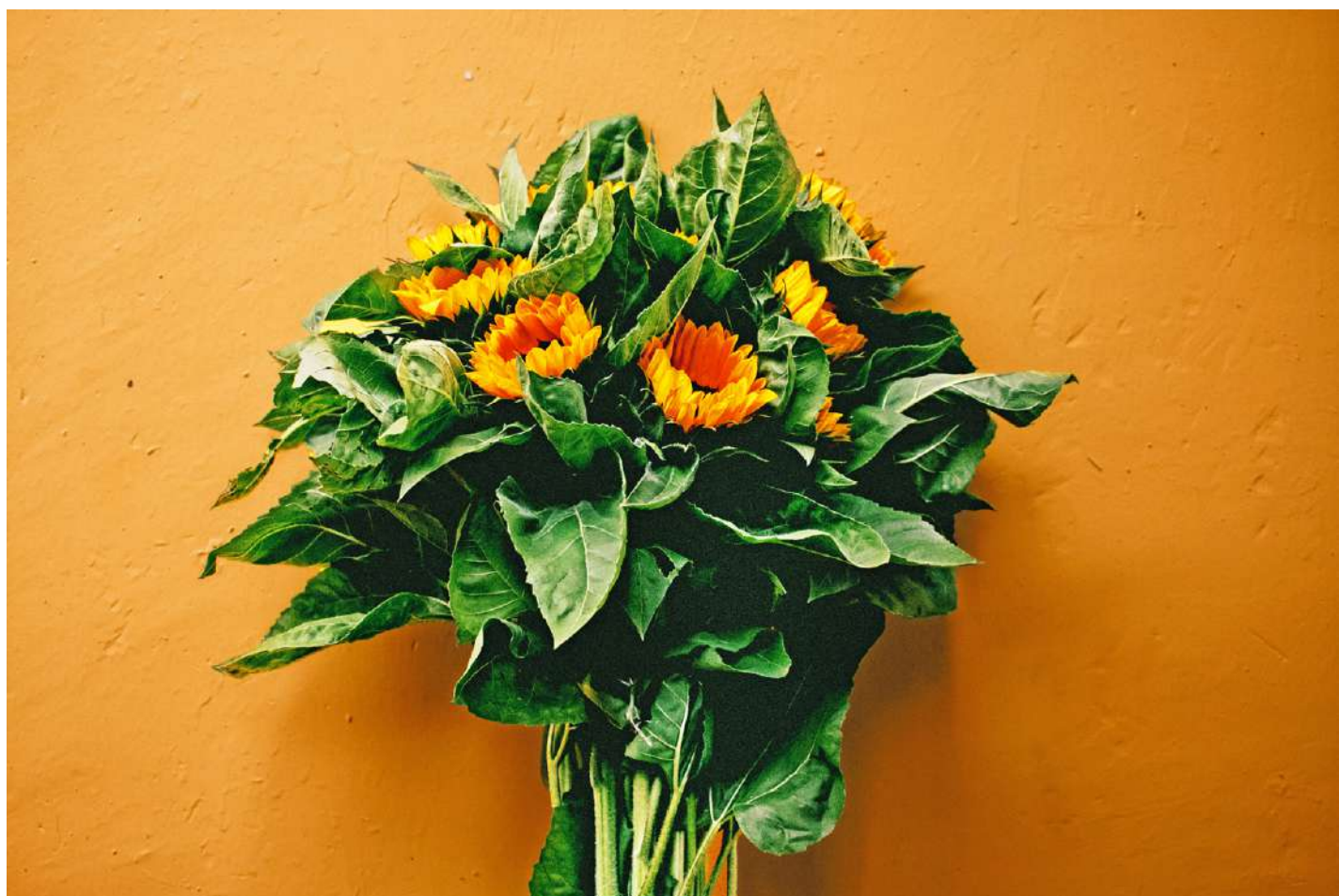
Girasoles. Coscomatepec, Veracruz.