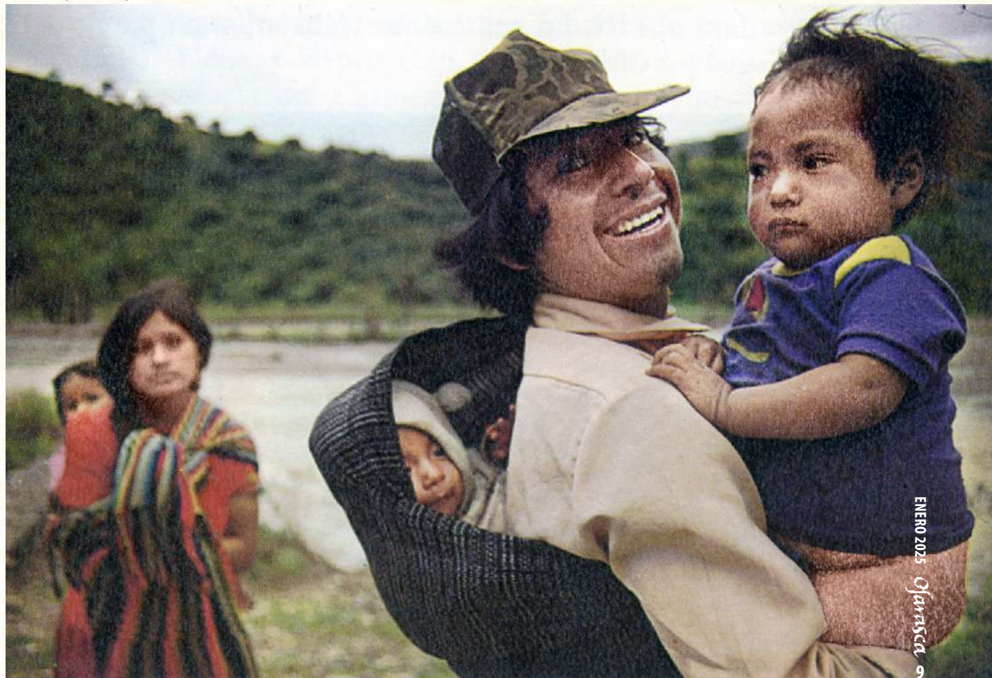
Alcozauca, Guerrero, 1989.

México Indígena, Nueva Época, número 2, noviembre de 1989