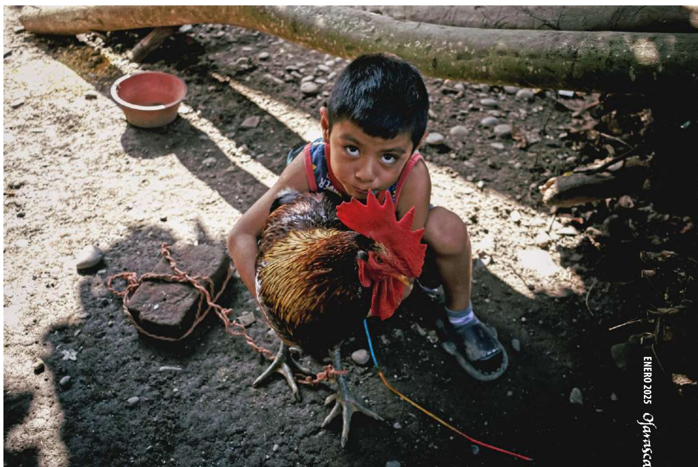
Entabladero, Veracruz, 2024.