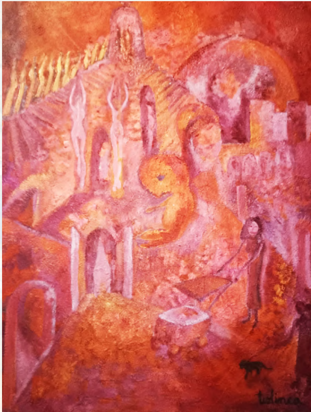
No a la violencia contra las mujeres. Pintura de Teolinca Escobedo

Si nos dan miseria , sembremos rebeldía. La resignación no encuentra lugar en nuestros corazones, compañeras, no vamos a acostumbrarnos a ver cada vez más hambre, personas en situación de calle, cada vez más pobreza, violencia y represión. Porque como Lohana Berkins nos enseñó, el tiempo de la revolución es ahora y el motor de cambio es el amor. Acá nadie le suelta la mano a nadie. Acá nadie se rinde ■