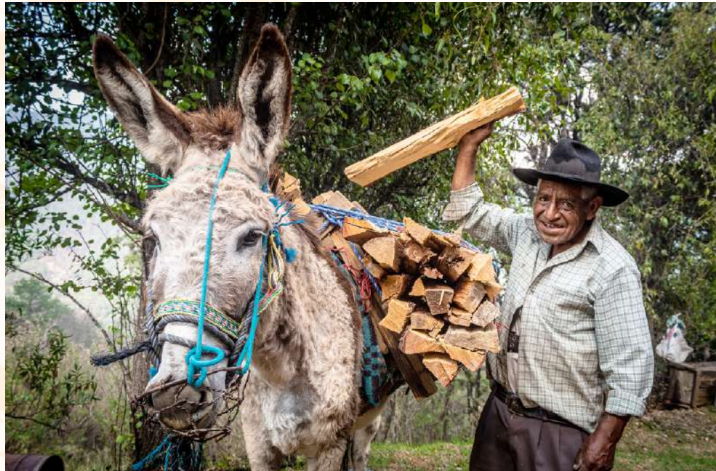
Pueblos Mancomunados, Oaxaca, 2024.