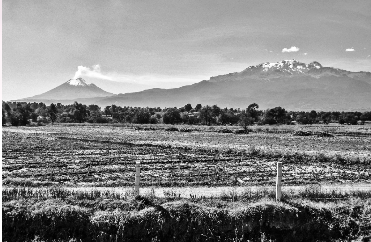
Popocatepetl y Iztazihuatl.