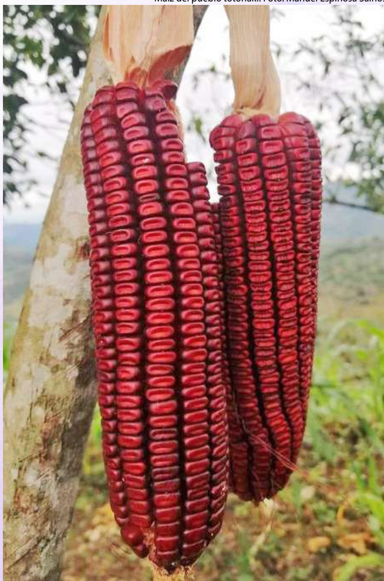
Maíz del pueblo totonaki.

Este texto es un adelanto de un documento más amplio en colaboración con Enlace Comunicación y Capacitación AC.