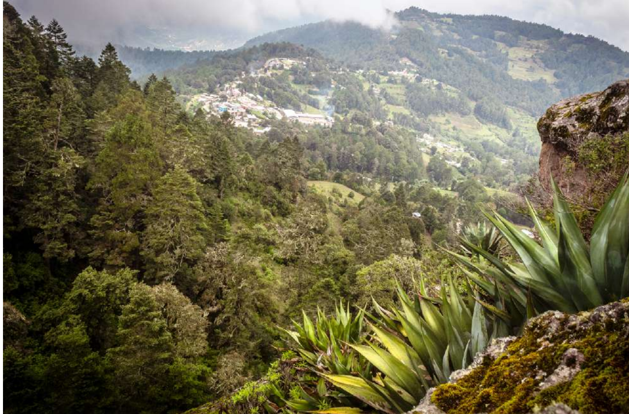
Benito Juárez, Oaxaca.