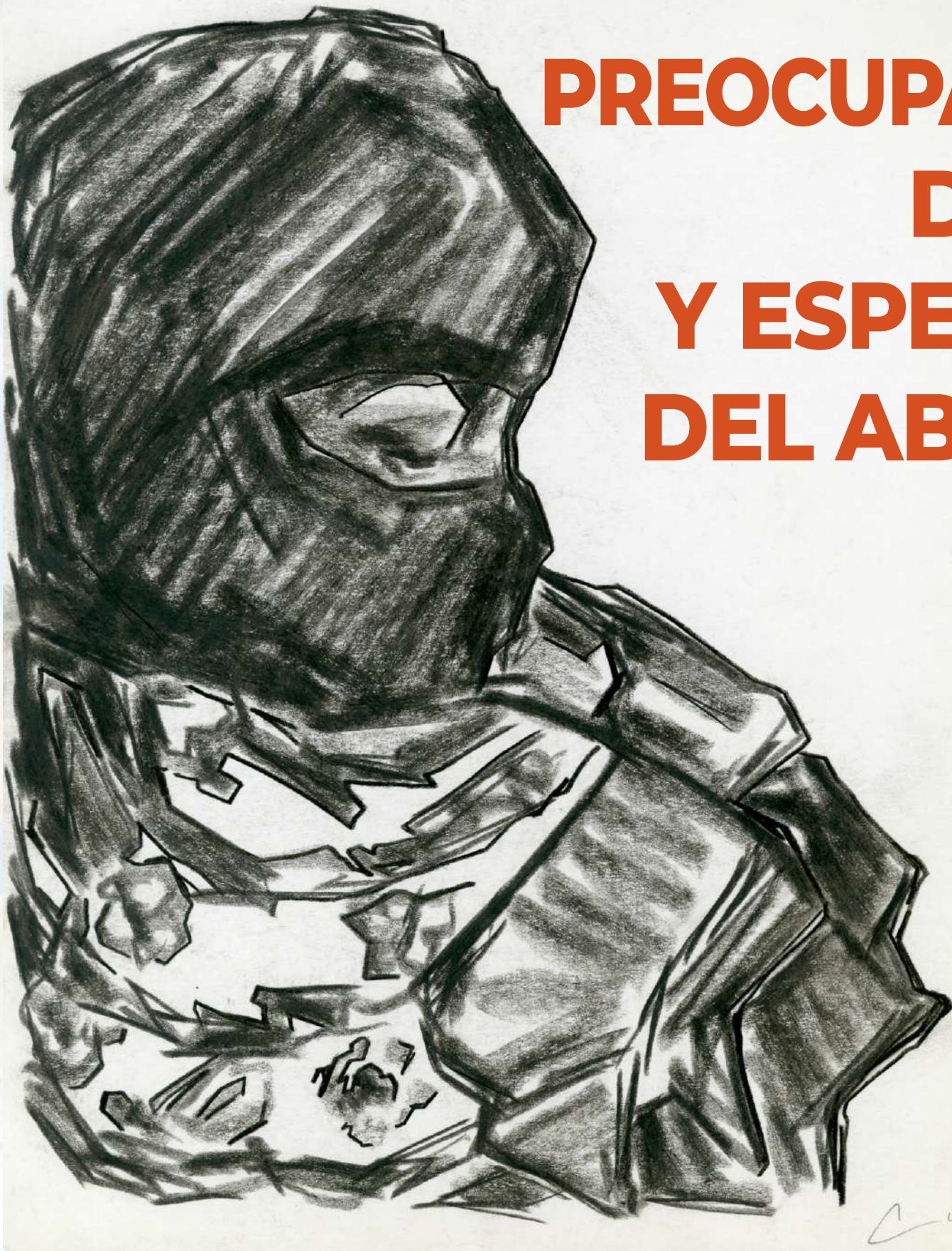
Dibujo al carbón de Arhat Monter Cid

Feministas de Abya Yala resumen en carta algunas de las luchas en los territorios de la región encabezadas por mujeres en defensa de la tierra, el agua, los derechos y la autonomía de los pueblos, frente a las distintas formas de violencia.