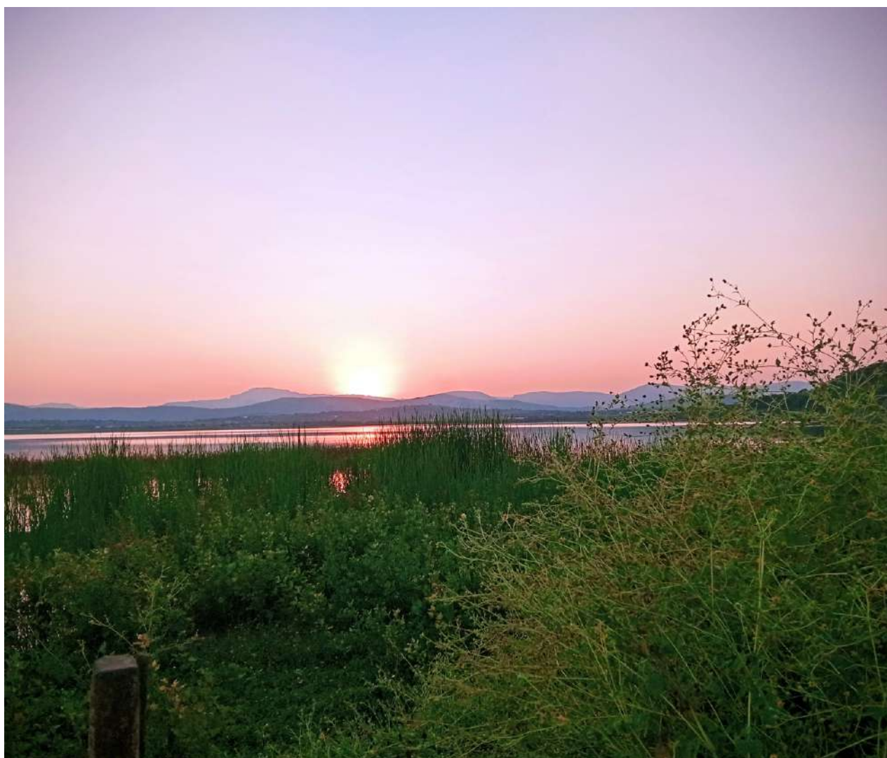
Atardecer en Coatetelco, Morelos, 2024.