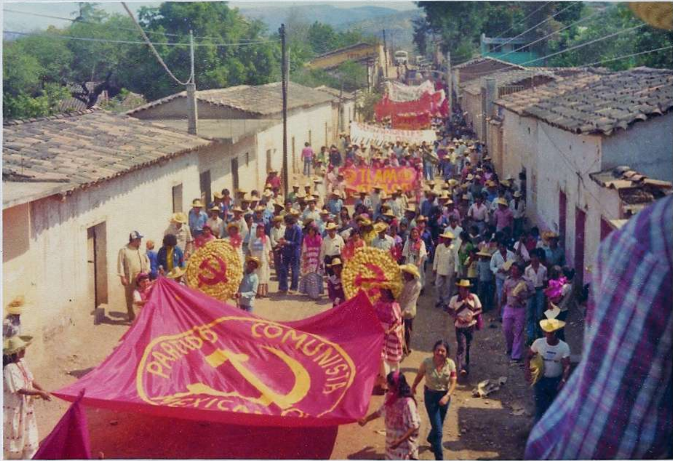
Marcha en Alcozauca, Guerrero, cuando fue llamada La Montaña Roja, 1979.