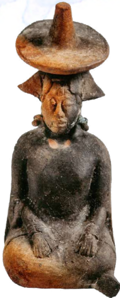
Figura de una mujer con sombrero, cerámica modelada, Isla de Jaina, Campeche

Tu tséel a k'áanche'il nojochchaj in tuukul, ta ts'akaj u k'oja'anil in pixanil yéetel u kili'ichil mokt'aan, sawal t'aanil ta k'exil in muk'yaj tu táan Yuum iik', ta púustaj u yiik'al in luba'an óolal yéetel u muut siipche', nupbil ta beetil in náay tu yóol a yuumtsilil.