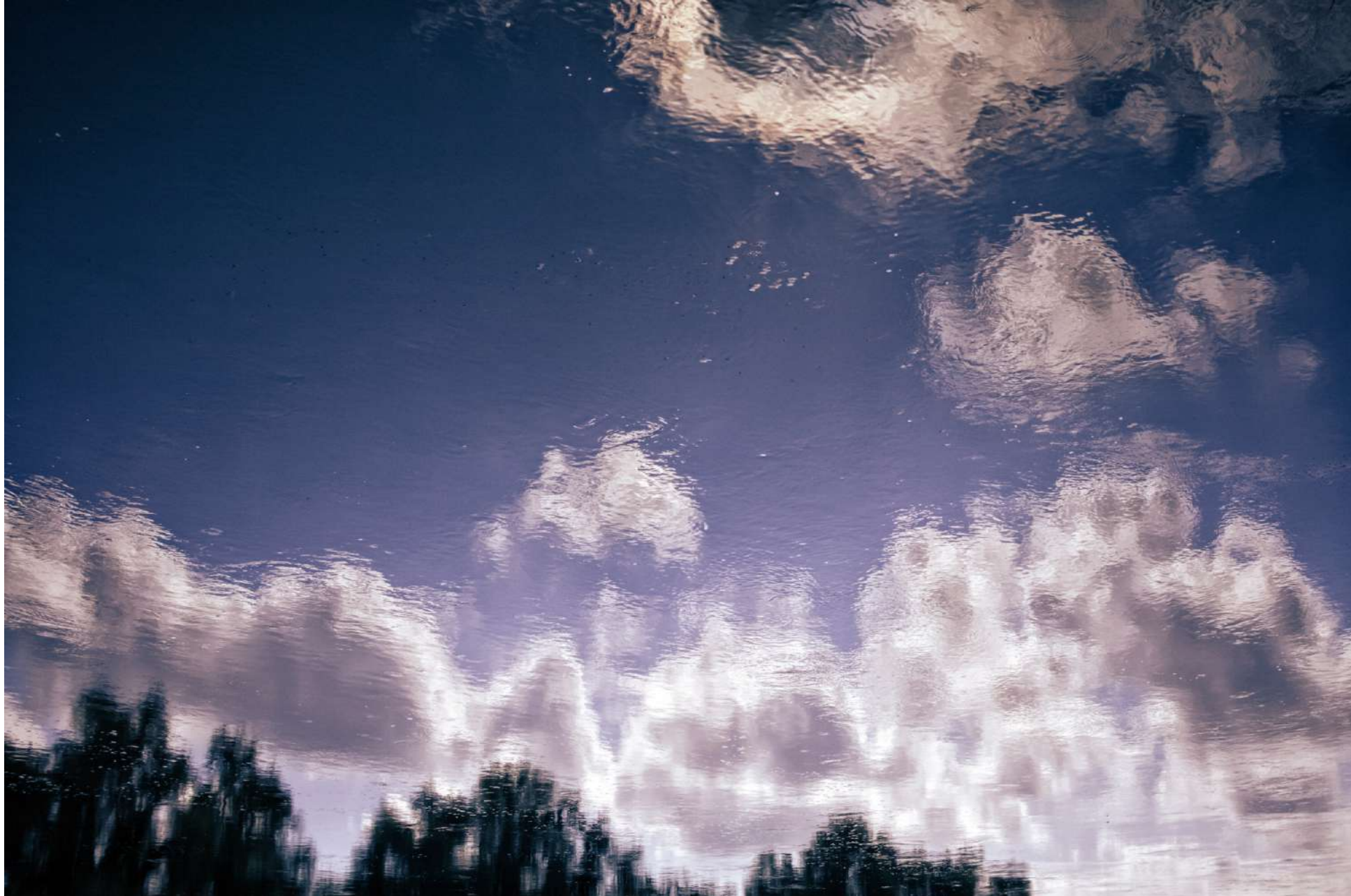
Reflejo. Entabladero, Veracruz, 2024.