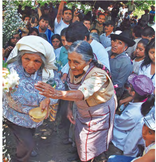
Fotografía tomada en el primer festival de Tierra Caliente en la comunidad de Calpulálpam en 2012.

En el año 2015 hubo un grupo una asociación civil y llegó con algunas propuestas, unos cursos y de ahí muchas mujeres se animaron a entrar. Tuvimos un tope muy fuerte, muchos hombres se negaron a que entrara a las asambleas. Después dijeron que no nos iban a dejar entrar y a la siguiente asamblea mi hija dijo yo quiero participar como ciudadana y ahí dije, si le van a poner topes, ahí si voy yo. Y entonces nos dejaron entrar a muchas éramos