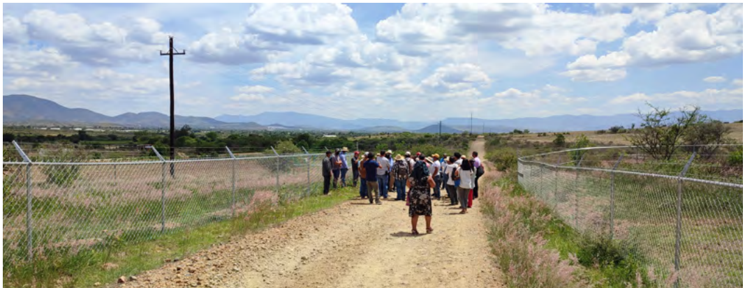
9. Comunicado No más proyectos mineros en Valles Centrales de Oaxaca 13 de noviembre de 2024.