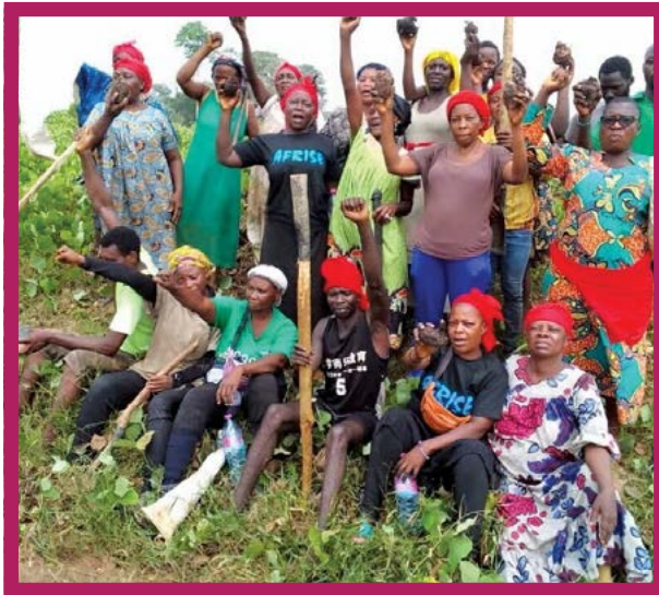
Mujeres del grupo AFRISE en una protesta contra las plantaciones de Socapalm en Camerún, enero de 2025.

Un desafío importante en relación al acaparamiento de tierras y agua es la participación directa de los gobiernos y sus militares . Un ejemplo es un proyecto de una zona de producción alimentaria en Papúa, Indonesia, donde, como parte de nuestros esfuerzos,