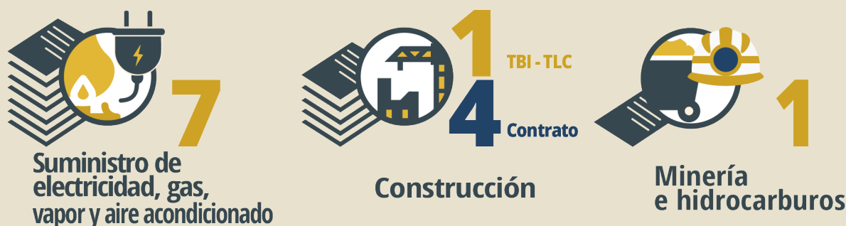
Gráfico 4 • Sectores de las demandas