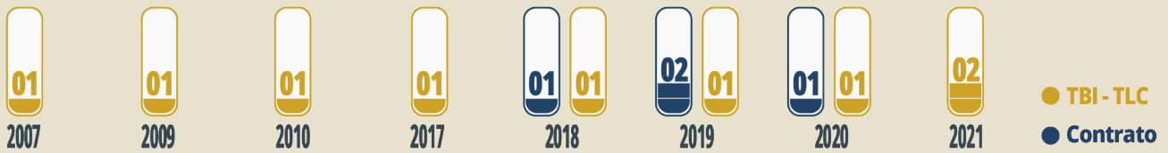
Gráfico 1 • Demandas contra Guatemala por año