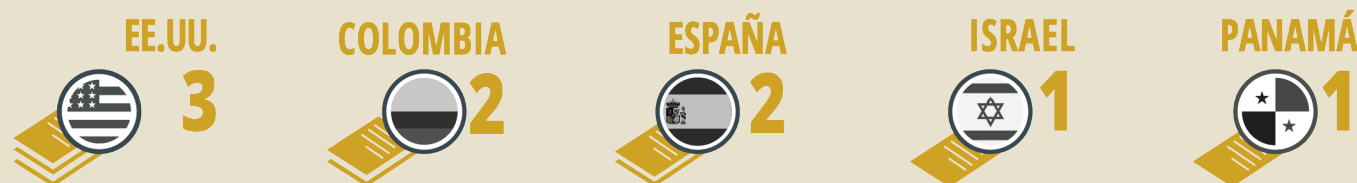
Gráfico 3 • Origen de inversores que demandan a Guatemala