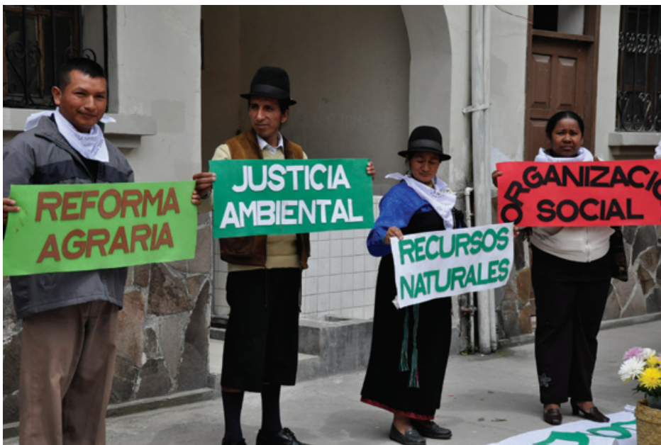
Inauguración de la Secretaría Operativa de la CLOC-Vía Campesina

Con mucha alegría y frenesí, presentamos la última publicación de nuestro Boletín Tierra, el cual es un esfuerzo conjunto de todas las organizaciones que forman parte de la CLOC-Vía Campesina. En la presente edición queremos conmemorar junto a ustedes el Día Mundial de la Lucha de las Mujeres, el cual se ha constituido en un testimonio vivo de resistencia de millones de mujeres alrededor del mundo. Hacemos un reconocimiento al trabajo incansable y constante que realiza la articulación de mujeres de la CLOC-Vía Campesina. Con este sentir de lucha, convocamos a hombres y mujeres, jóvenes y niños a movilizarse en todo el mundo en contra de la violencia ejercida hacia las mujeres, espe-