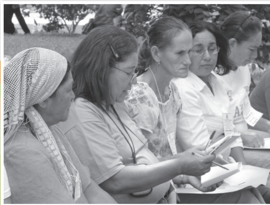
Mujeres trabajando en equipo para evaluar las actividades de Conamuri, durante el Congreso.