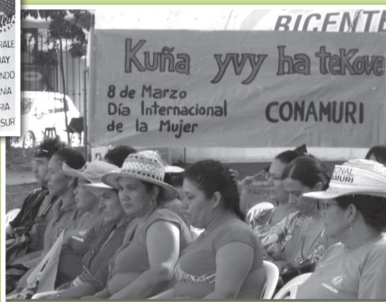
Compañeras de Conamuri participando durante el Foro Abierto en la Plaza Uruguaya.