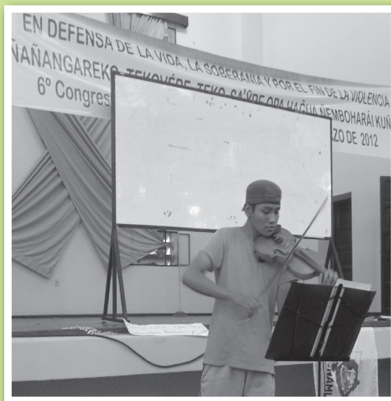
Participación de jóvenes artistas indígenas del Chaco durante el 6to Congreso Nacional.