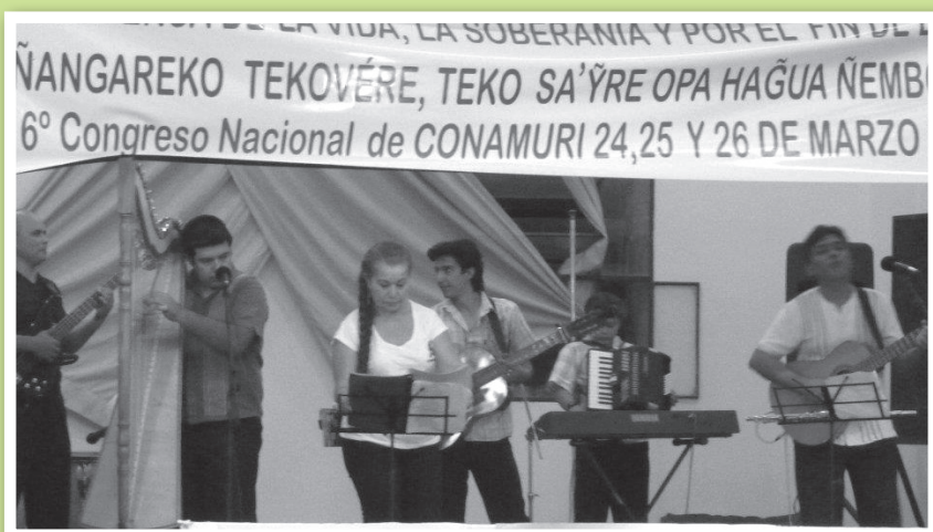
Actuación del Grupo Los Corales, durante el acto de homenaje, en el 6to Congreso Nacional.