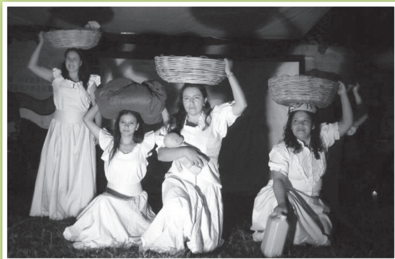
Presentación Teatral de la obra "Kuña Yvy", durante el 4to Campamento de Juventud.