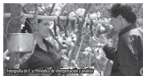
Fotografía de E'á. Periódico de Interpretación y análisis

Ambas entrevistadas coinciden que ha sido siempre un anhelo muy deseado tener un espacio televisivo donde podamos expresarnos y mostrar el trabajo que estamos realizando pero sobre todo defender desde este medio nuestras banderas de lucha. Hoy ese sueño es una realidad. En la TV Pública Paraguay las mujeres campesinas e indígenas tenemos nuestro espacio, nuestro programa televisivo “Tembi'ú Rape”, que se emite todos los jueves a las 20:00.