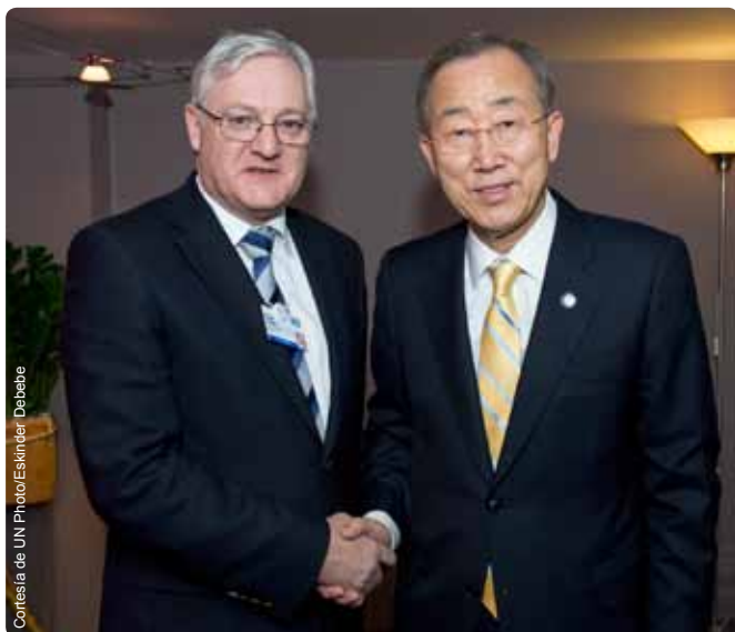
Saludo protocolar del director ejecutivo de Shell Peter Voser y el Secretario General de la ONU Ban Ki-Moon.