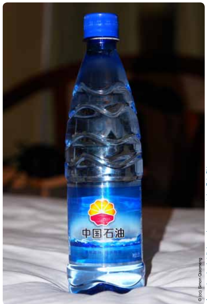
Agua mineral embotellada para la empresa petrolera PetroChina.

La continuación del trabajo del Centro de las Naciones Unidas sobre las Empresas Transnacionales, establecido en 1974, o la creación de una organización similar en la ONU, podría ser uno de los primeros pasos para comenzar a abordar seriamente en el marco de la ONU los impactos de las grandes empresas.