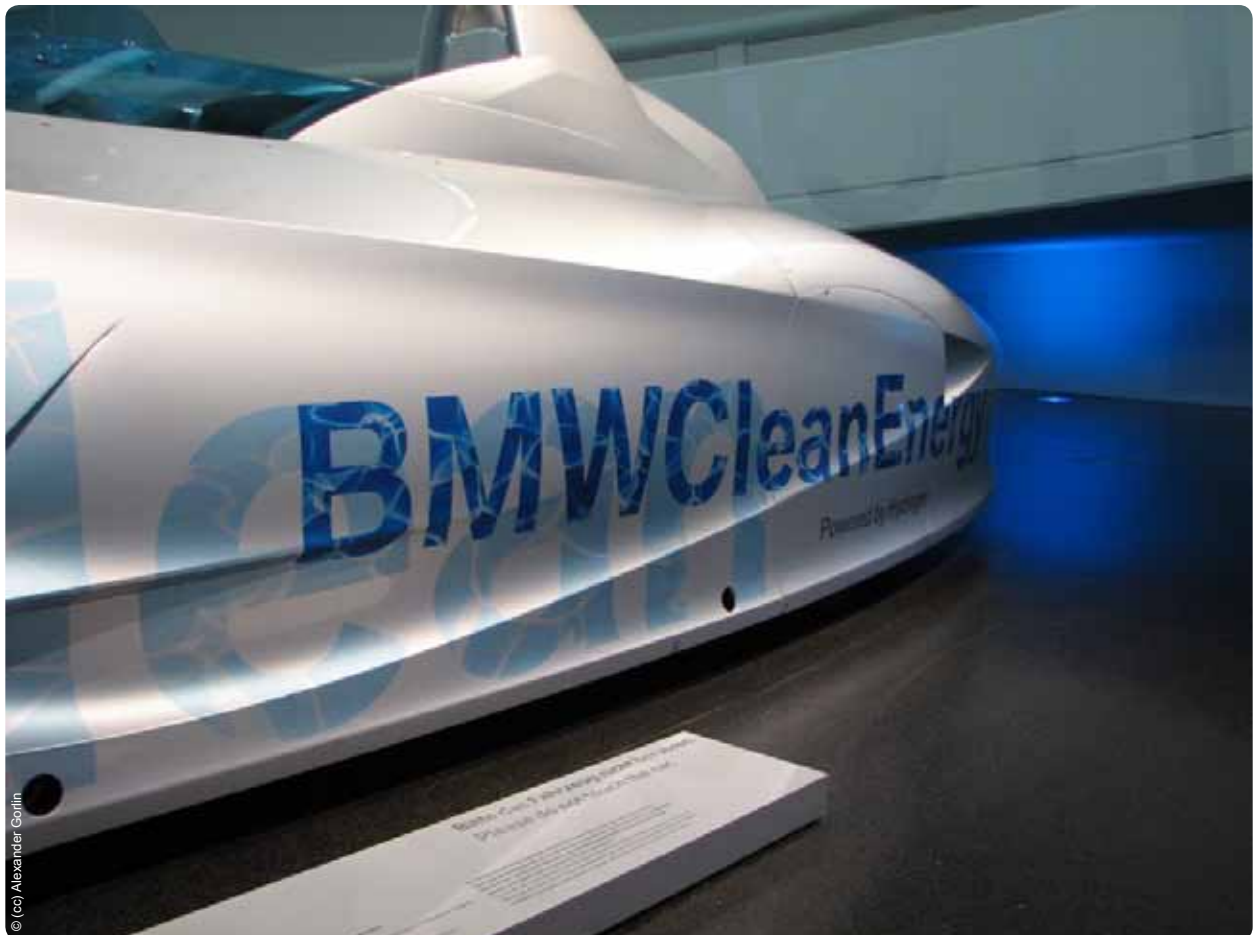
BMW exhibe un prototipo de automóvil a hidrógeno en su propio museo en Múnich, Alemania

empresa de servicios públicos de electricidad de América Latina; Statoil , la empresa de gas y petróleo de Noruega; y Duke Energy , una multinacional estadounidense vinculada fuertemente a la generación a carbón y con operaciones en Estados Unidos, Canadá y América Latina. El director general del Fondo de Desarrollo de la Organización de Países Exportadores de Petróleo (OPEP) también forma parte del grupo, así como Mark Moody-Stuart, Presidente de la Fundación para el Pacto Mundial de la ONU y ex director ejecutivo de la Royal Dutch Shell, y John Browne, ex director ejecutivo de British Petroleum (BP) y actual director de Riverstone Holdings , una empresa privada que se especializa en maximizar el rendimiento de las inversiones en el sector de la energía y la electricidad. Además, el grupo es presidido por Charles Holliday, jefe de DuPont y actual Director Ejecutivo del Bank of America , el tercer