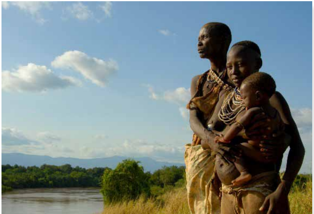
Agricultores indígenas en el Valle del Omo Inferior siembran a lo largo de las riberas fértiles cada año cuando las aguas de inundación del Río Omo retroceden. Una represa que ha sido propuesta podría eliminar los cultivos alimentarios de los campesinos cuando se elimine la inundación anual. También reducirá las tierras de pastoreo de las cuales dependen los pastores locales para alimentar sus ganados durante la temporada seca. Un menor flujo de entrada al Lago Turkana dañará la industria pesquera local y amenaza al único ecosistema por el cual el lago fue reconocido como Patrimonio de la Humanidad.

de la masiva entrega de tierras y derechos de agua. Las áreas donde se concentra el acaparamiento de tierras coinciden estrechamente con los sistemas de ríos y lagos más grandes del continente y, en la mayoría de estas áreas, el riego es un prerrequisito para la producción comercial. El gobierno etíope está construyendo una represa en el río Omo para generar electricidad y regar una gigantesca plantación de caña de azúcar; un proyecto que amenaza a los cientos de miles de personas nativas de la región que dependen del río, aguas abajo. También amenaza vaciar el lago de desierto más grande del mundo, el Lago Turkana, alimentado por el río Omo. En Mozambique el gobierno aprobó una plantación de 30 mil hectáreas a lo largo del río Limpopo, la cual habría afectado directamente a los campesinos y pastores que ahora dependen del agua. El proyecto fue cancelado porque los inversionistas no se presentaron, pero el gobierno está buscando a otros que se hagan cargo. En Kenya, una tremenda controversia ha surgido por los planes del gobierno de repartir inmensas áreas de tierra en el delta de Río Tana con desastrosas consecuencias para las comunidades locales que dependen del agua del delta. La ya degradada cuenca del río Senegal y su delta han sido objeto de entregas de cientos de miles de hectáreas de tierras, poniendo al