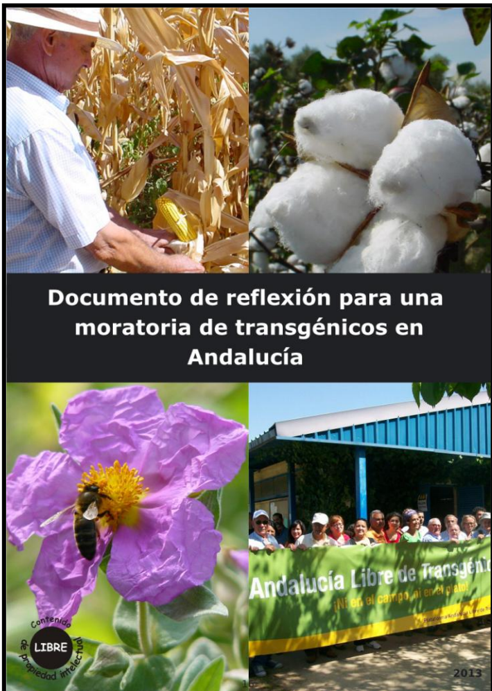
Documento de reflexión para una moratoria de transgénicos en Andalucía